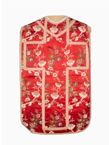
vue générale du dos de la chasuble IVR84_20174300077NUC4A