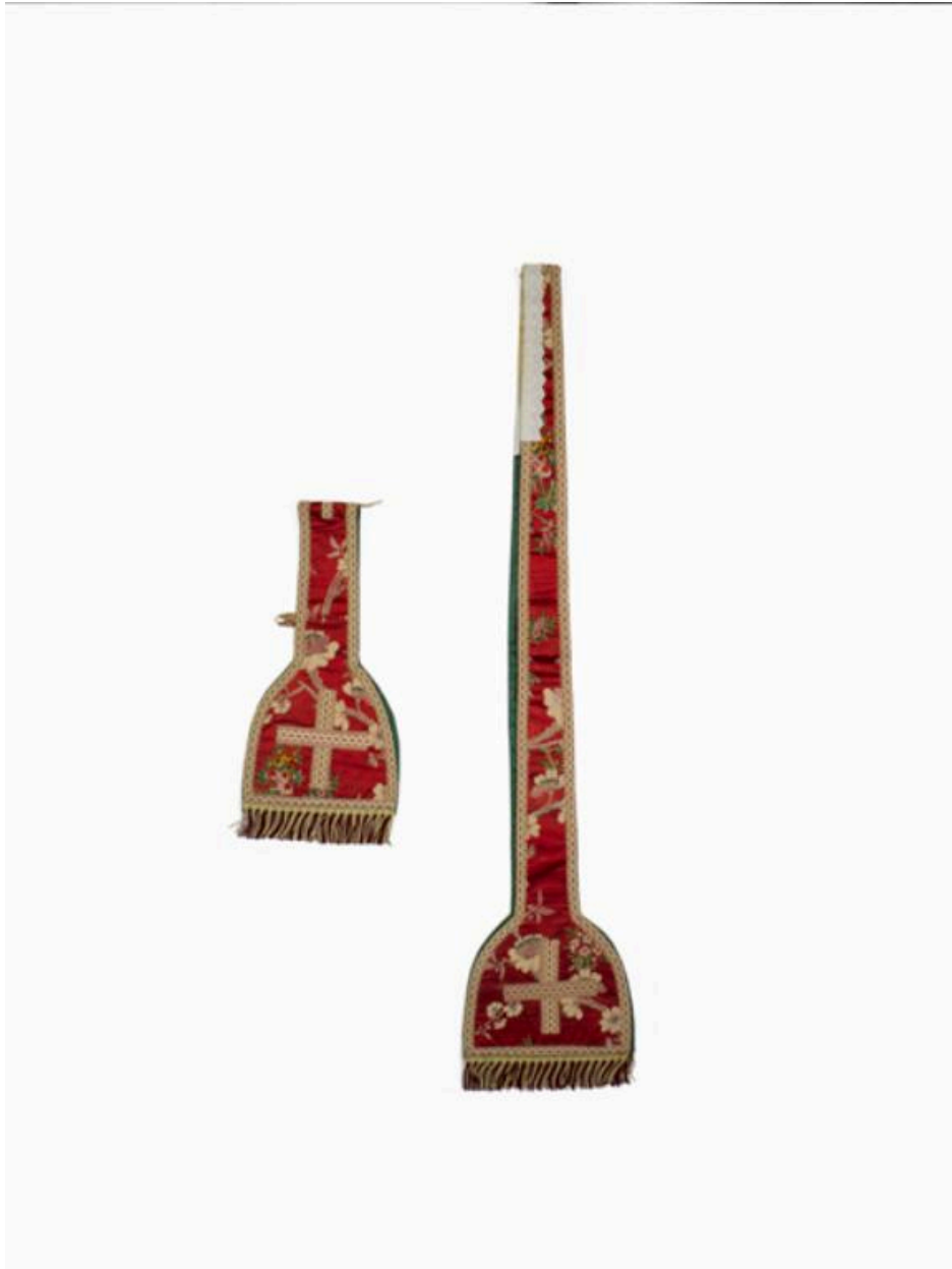
vue générale de l'étole et du manipule