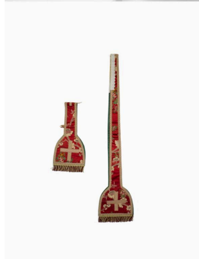
vue générale de l'étole et du manipule IVR84_20174300085NUC4A