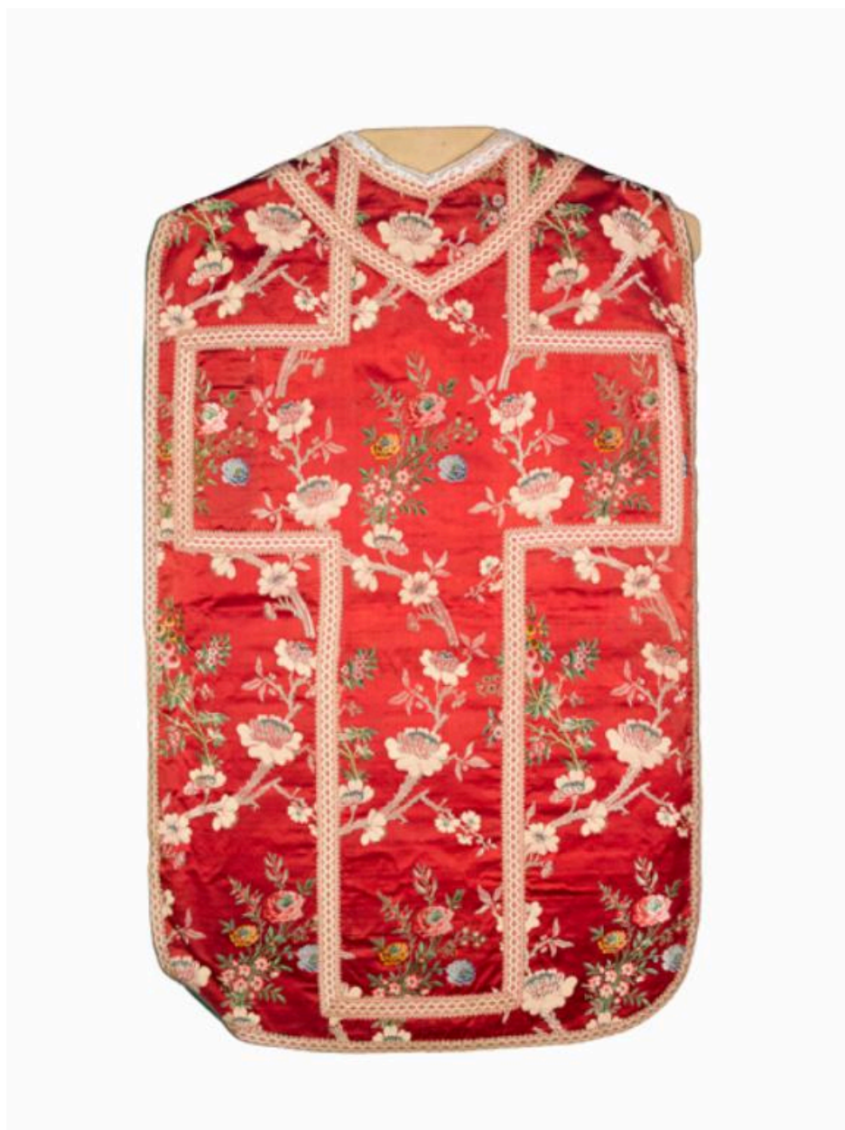
vue générale du dos de la chasuble