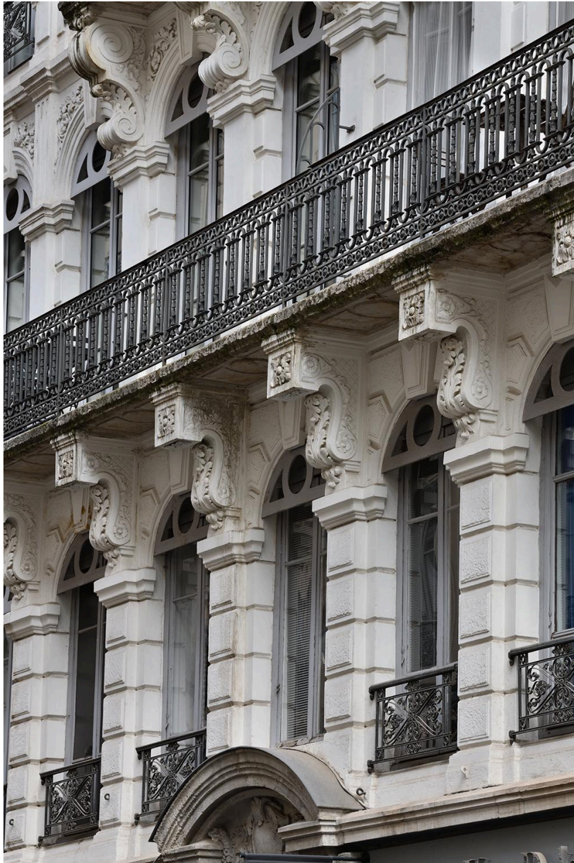
Consoles soutenant le balcon du deuxième étage carré