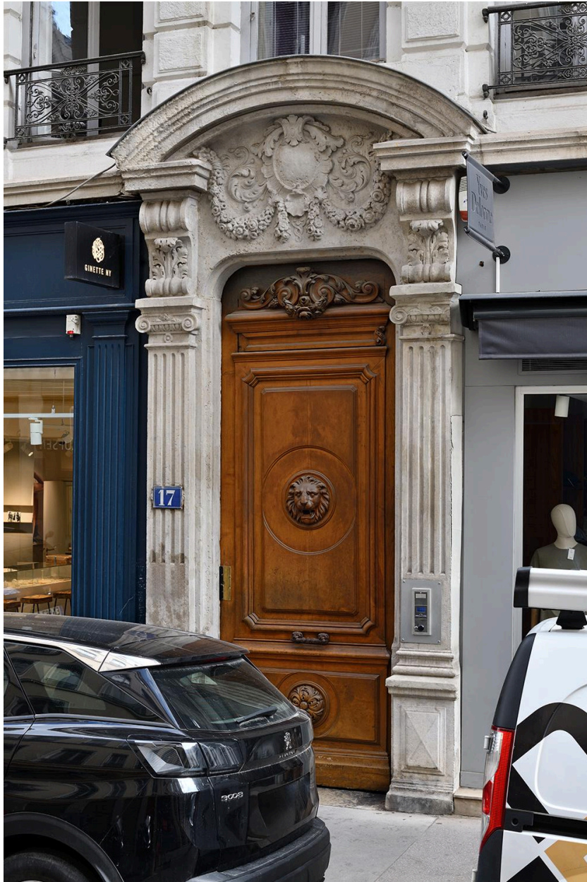
Elévation antérieure : la porte