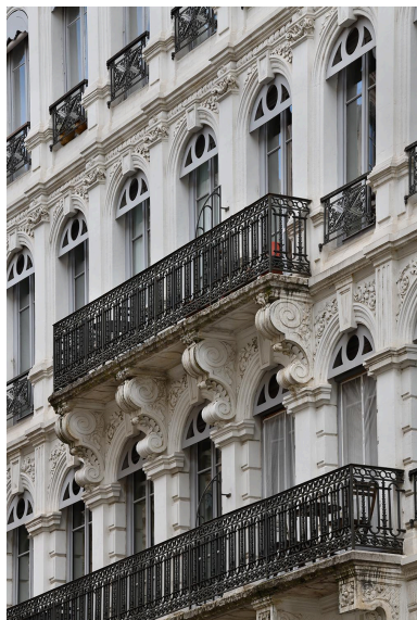
Balcon du troisième étage carré IVR84_20266900581NUCAQ