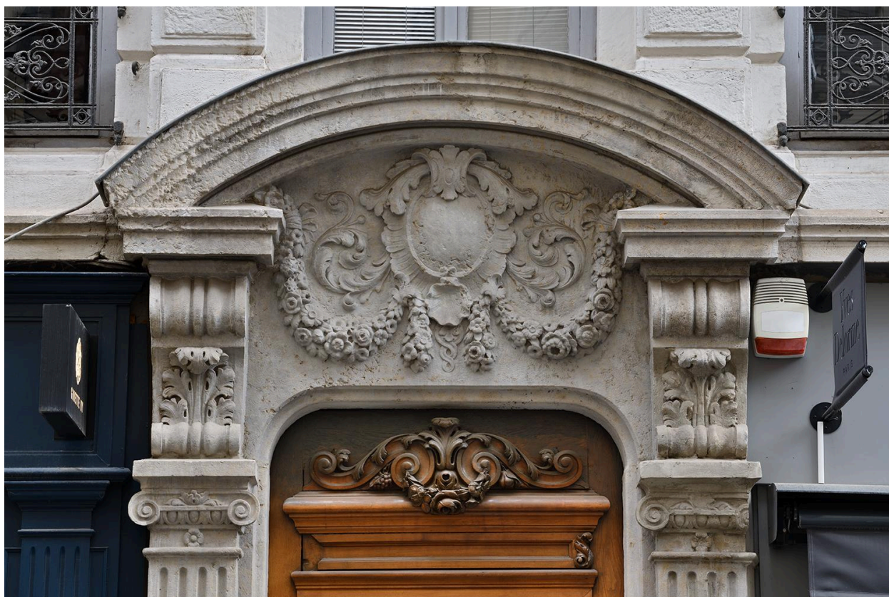
La porte : détail de la partie supérieure