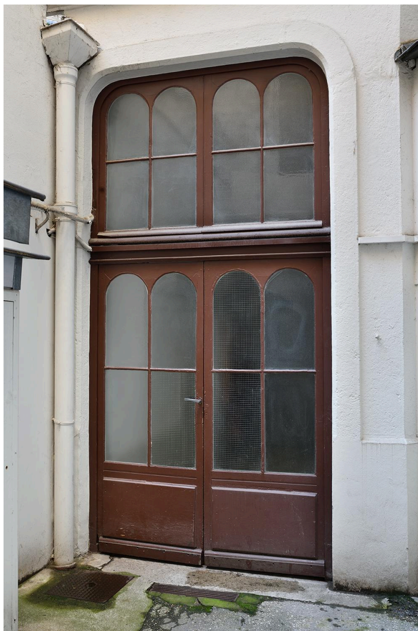
Porte donnant sur la cour commune