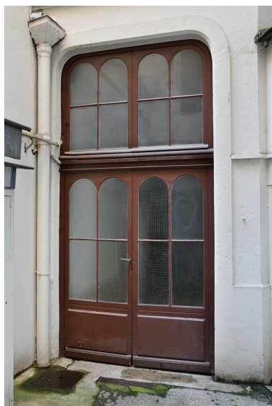
Porte donnant sur la cour commune