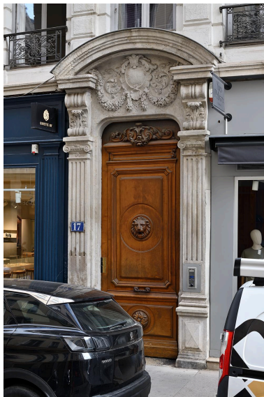
Elévation antérieure : la porte IVR84_20266900573NUCAQ