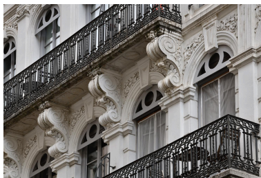
Consoles soutenant le balcon du troisième étage carré IVR84_20266900584NUCAQ