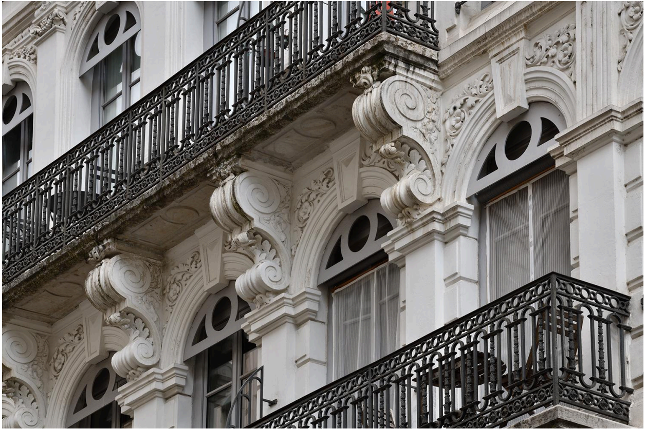
Consoles soutenant le balcon du troisième étage carré