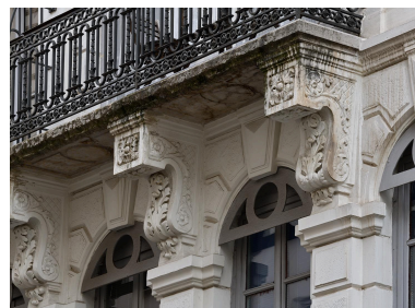
Consoles : détail IVR84_20266900580NUCA