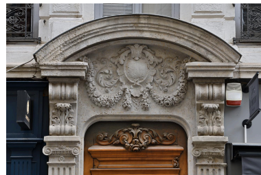
La porte : détail de la partie supérieure IVR84_20266900575NUCAQ