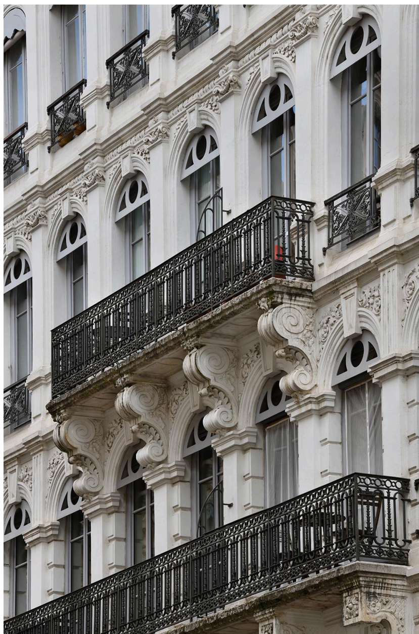
Balcon du troisième étage carré