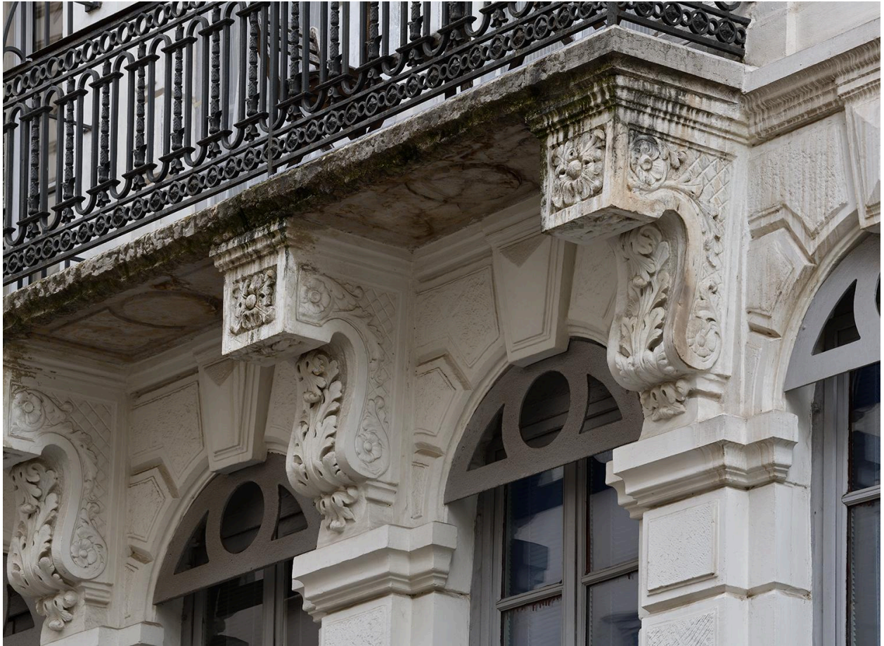
Consoles : détail