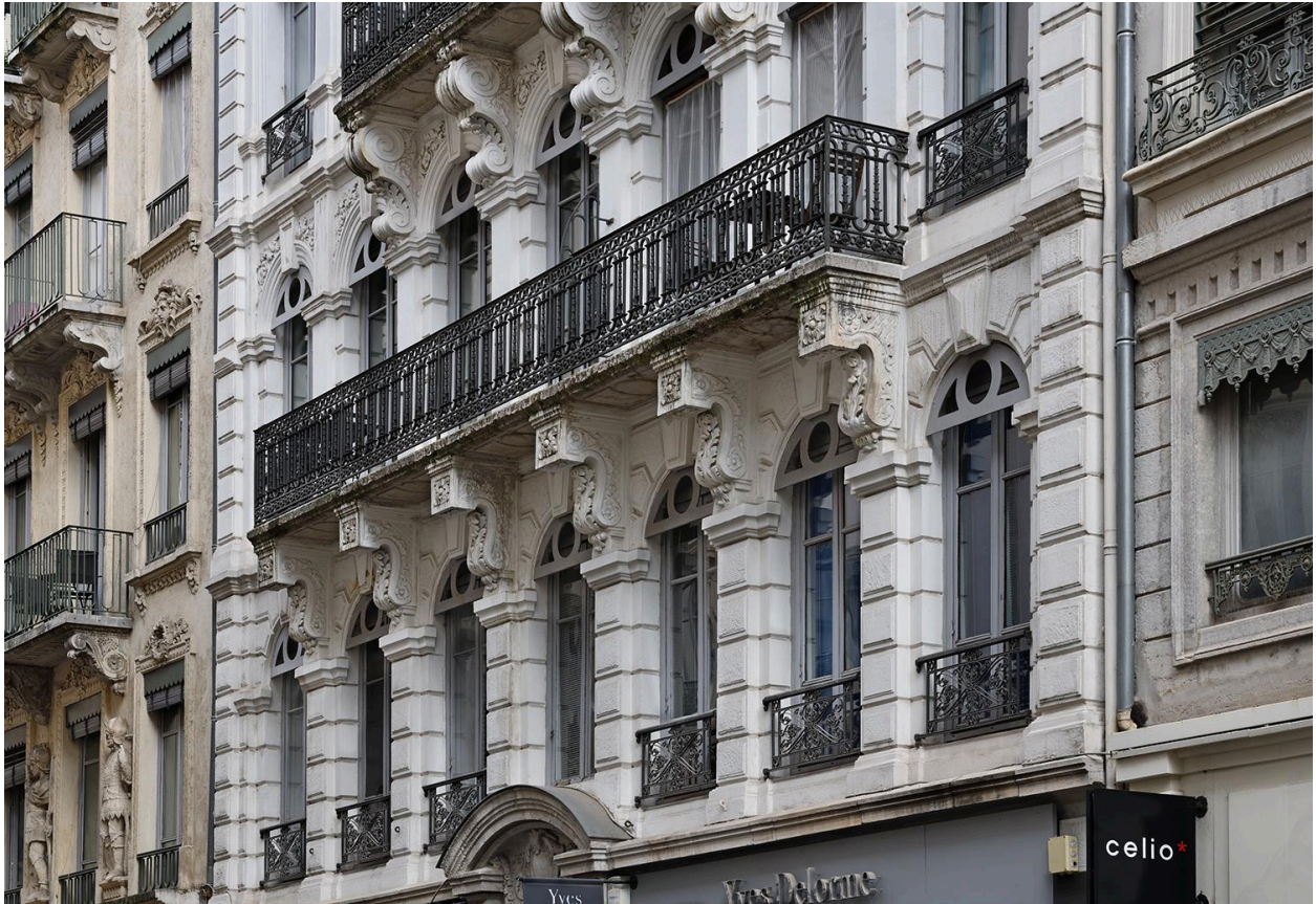
Balcon du deuxième étage carré