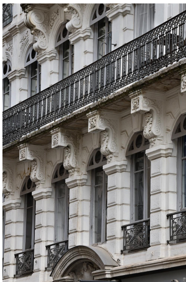
Consoles soutenant le balcon du deuxième étage carré IVR84_20266900578NUCAQ