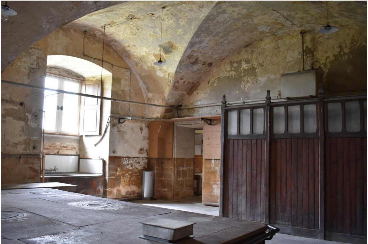
Vue du système d'alimentation en eau chaude