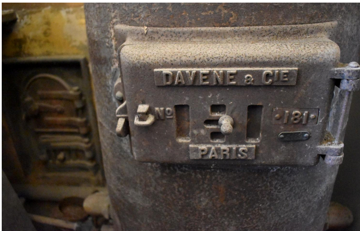
Vue de la marque