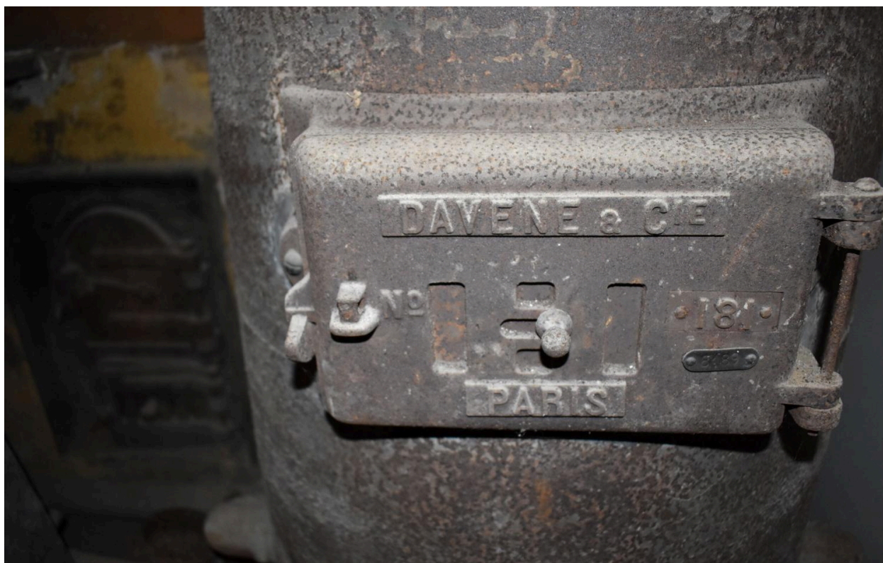
Vue de la marque