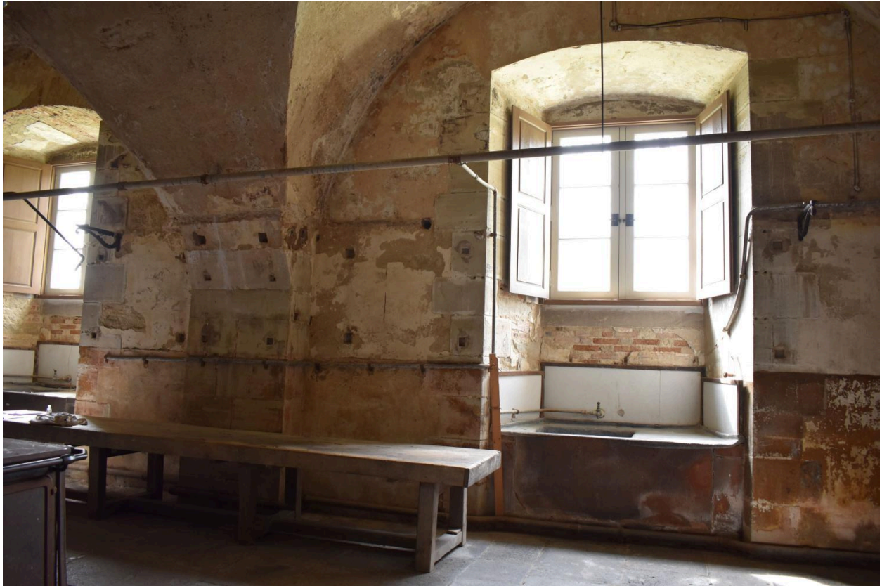
alimentation en eau chaude vers les évier