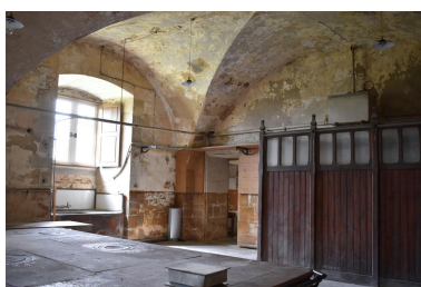
Vue du système d'alimentation en eau chaude