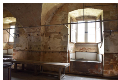
alimentation en eau chaude vers les éviers IVR84_20226300617NUC4A