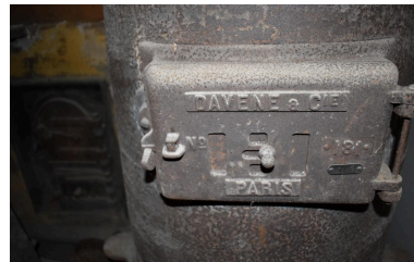
Vue de la marque IVR84_20226300614NUC4A