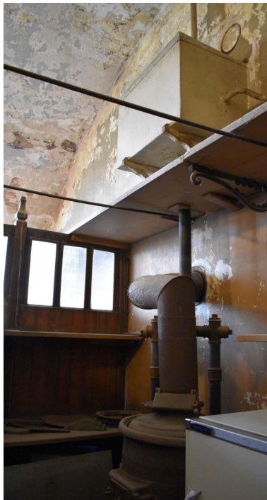
Vue de la réserve d'eau IVR84_20226300613NUC4A