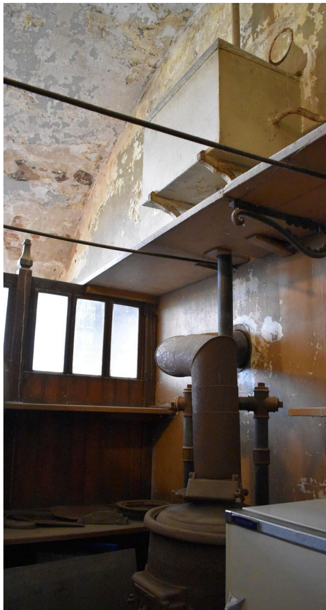
Vue de la réserve d'eau