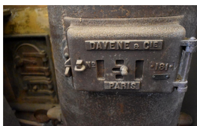
Vue de la marque IVR84_20226300615NUC4A