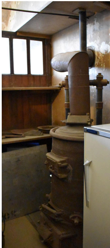
Vue de la chaudière