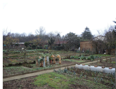
Vue des parcelles