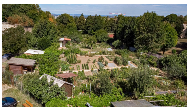
Vue des jardins ouvriers en limite des anciennes fortifications