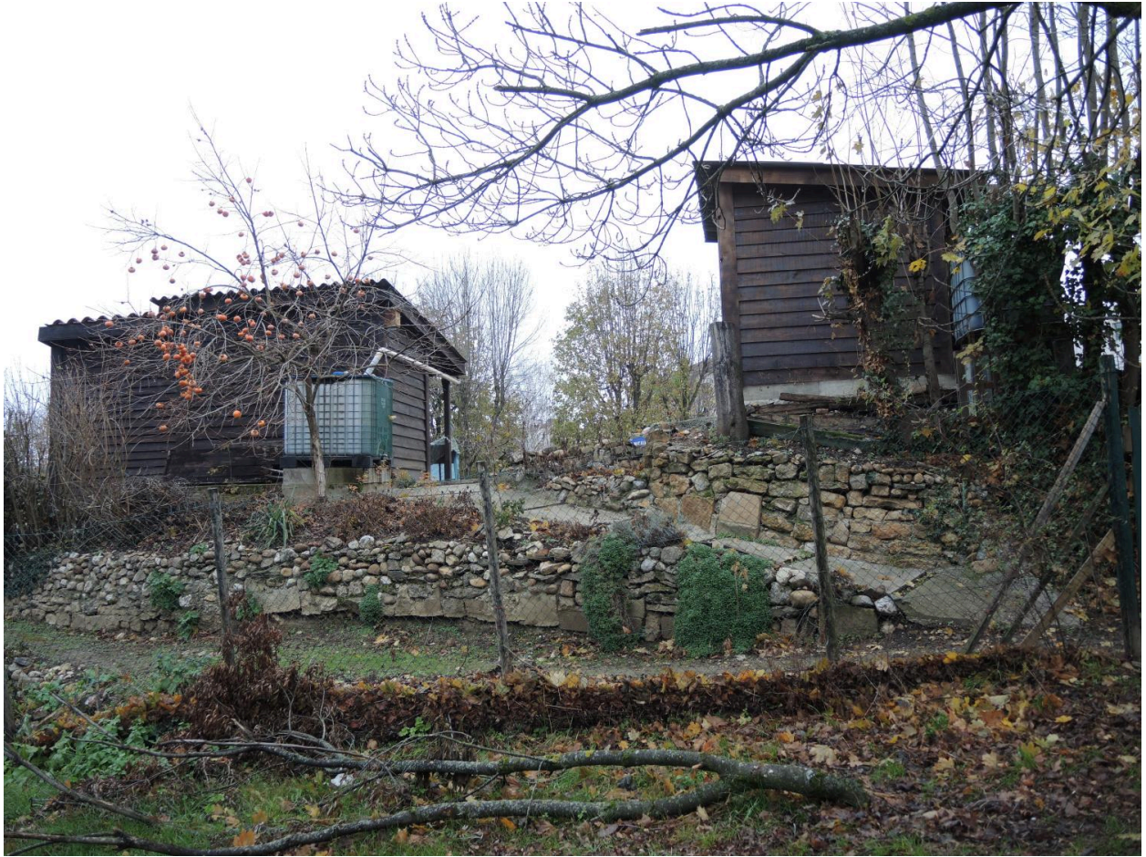
Vue des jardins ouvriers