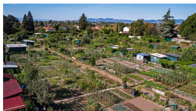
Vue d'ensemble des jardins ouvriers (drone) IVR84_20206901184NUCA