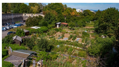
Jardins ouvriers et mur d'enceinte du fort de Saint-Foy-lès-Lyon IVR84_20206901190NUCA