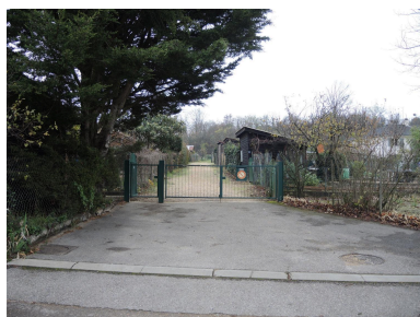
Entrée principale des jardins ouvriers de Saint-Foy-lès-Lyon