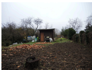
Détail parcelle IVR84_20236900016NUCA