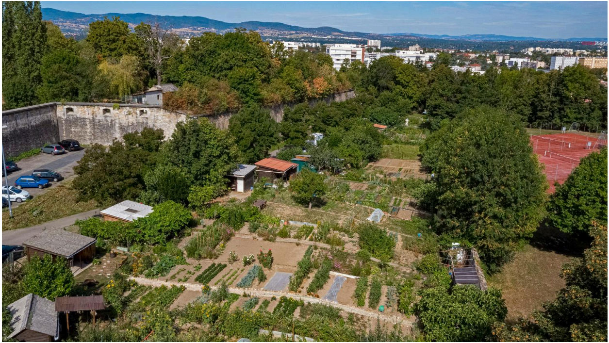
Vue d'ensemble des jardins ouvriers et mur d'enceinte du fort de Saint-Foy