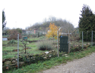
Détail portail de jardin IVR84_20236900024NUCA