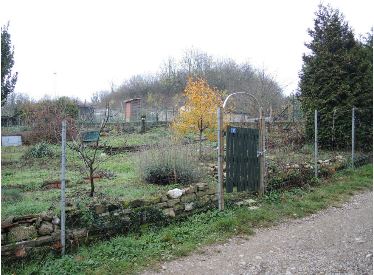
Détail portail de jardin