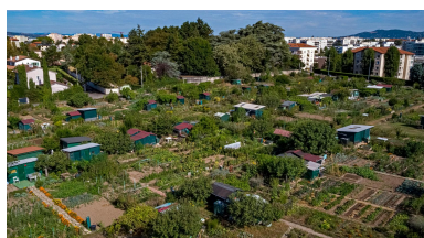
Vue d'ensemble des jardins ouvriers et vue des cabanes de jardin (drone)