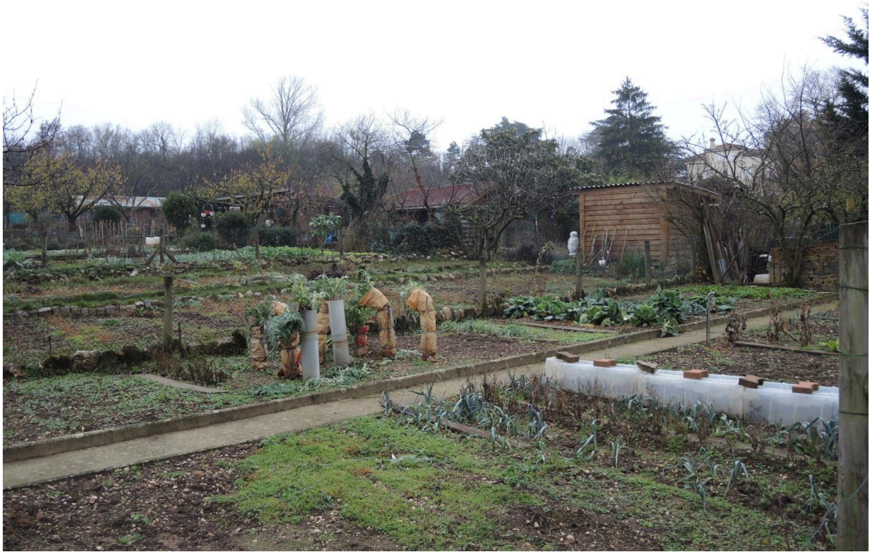
Vue des parcelles