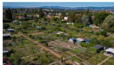
Vue d'ensemble des jardins ouvriers (drone) IVR84_20206901186NUCA