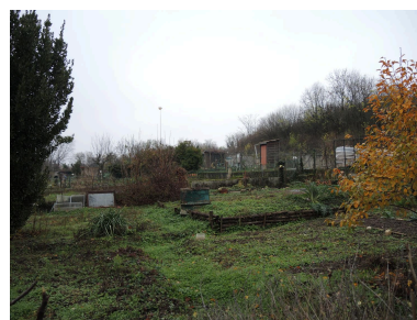
Vue des jardins ouvriers