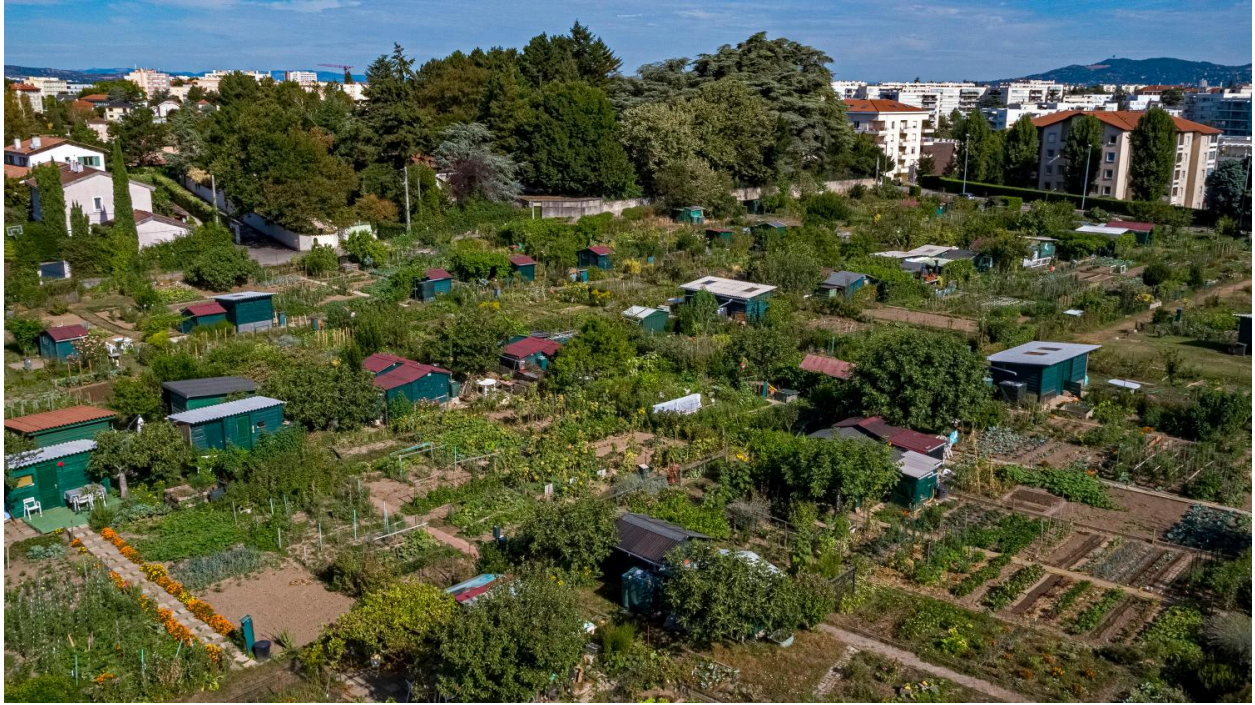
Vue d'ensemble des jardins ouvriers et vue des cabanes de jardin (drone)