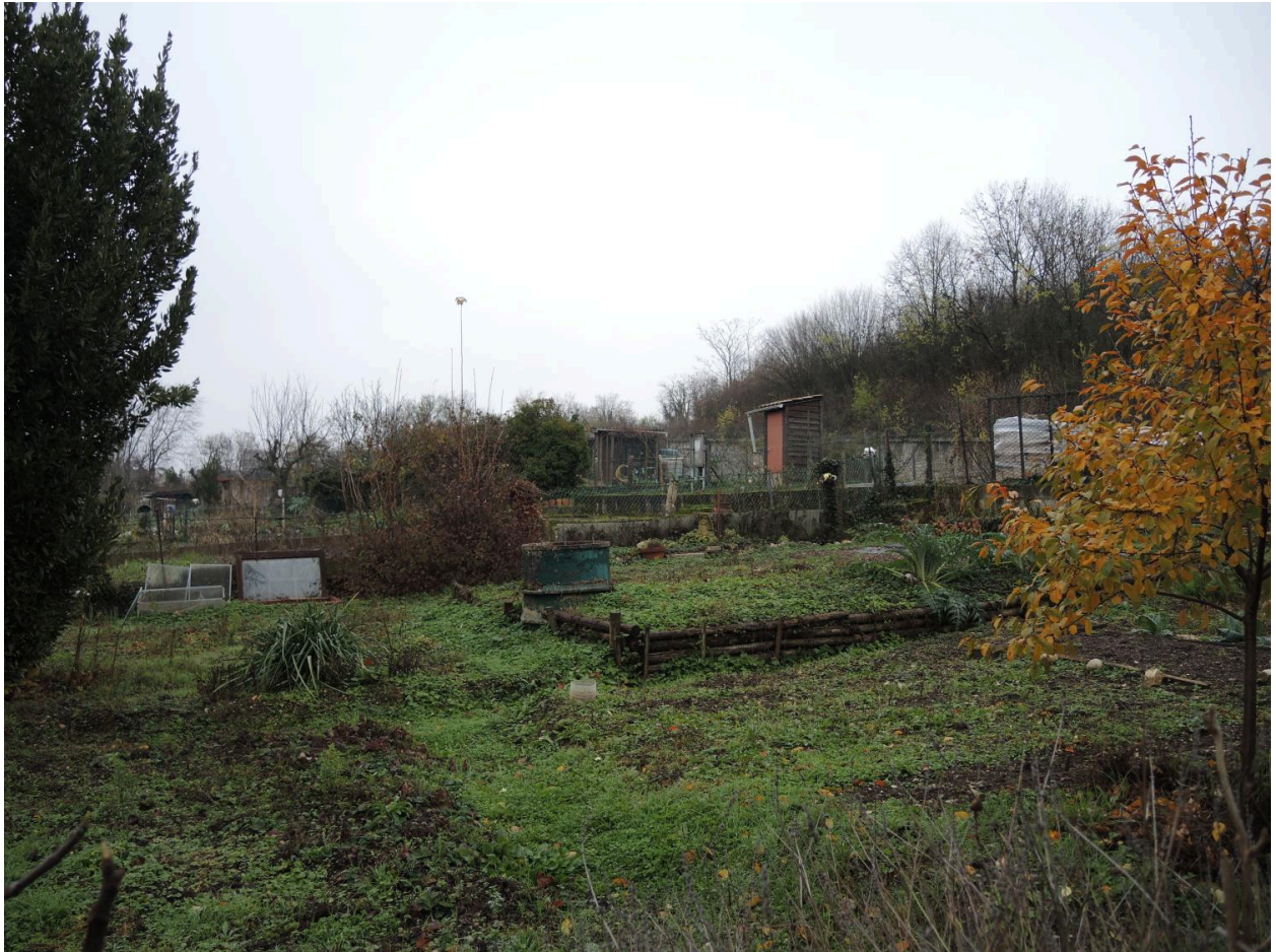
Vue des jardins ouvriers