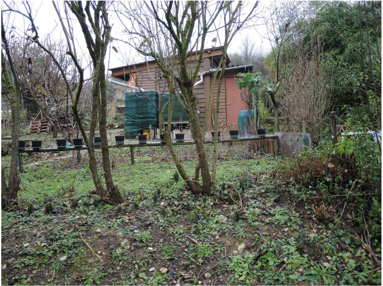
Détail cabane de jardin