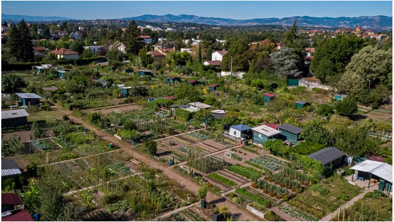
Vue d'ensemble des jardins ouvriers (drone)