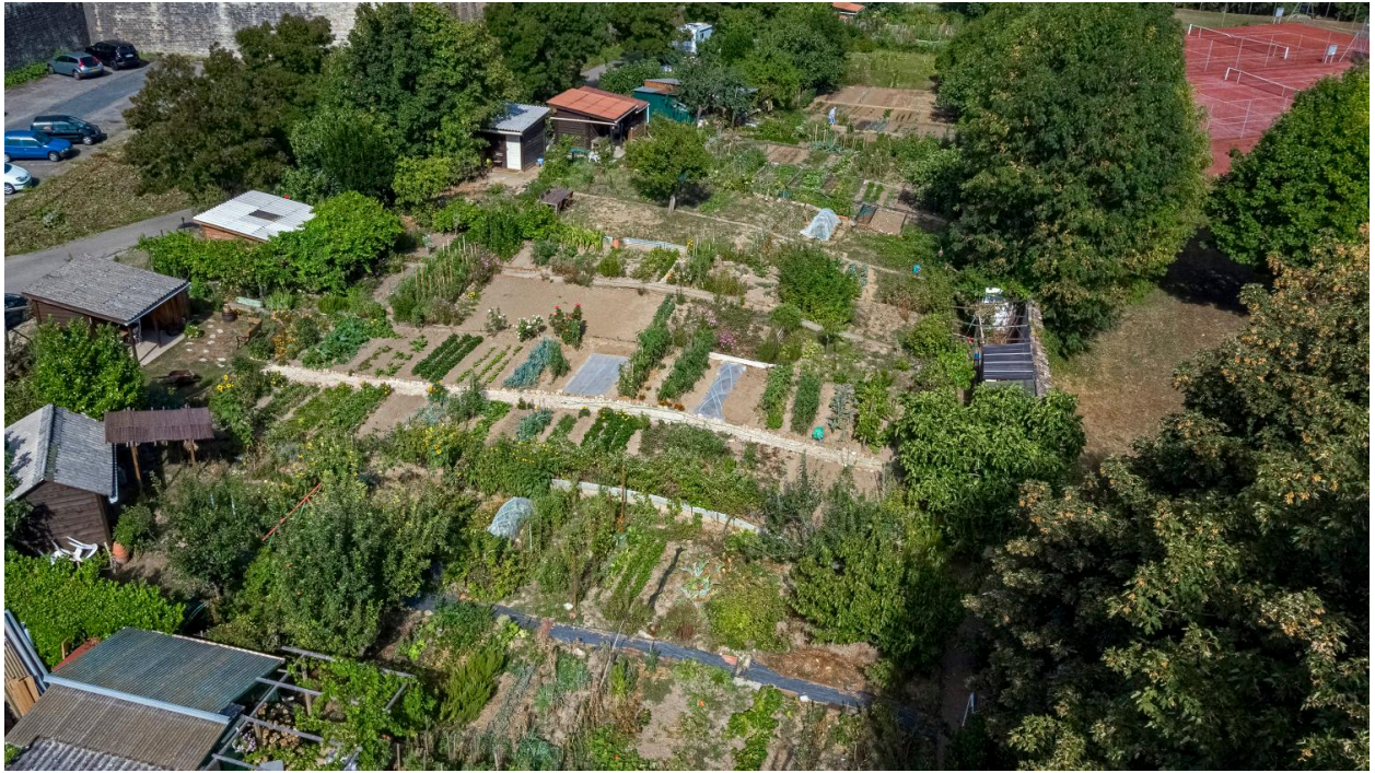
Vue d'ensemble des jardins ouvriers (drone)