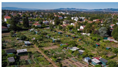
Vue d'ensemble des jardins ouvriers IVR84_20206901185NUCA