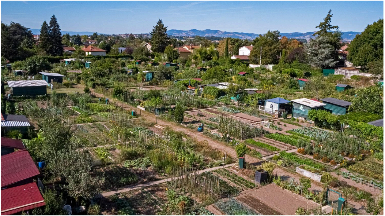
Vue d'ensemble des jardins ouvriers (drone)