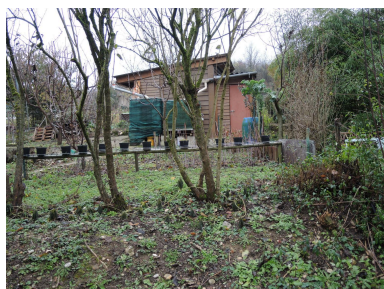
Détail cabane de jardin