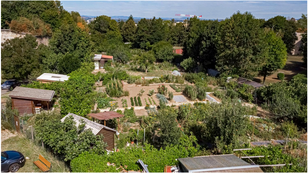
Vue des jardins ouvriers en limite des anciennes fortifications