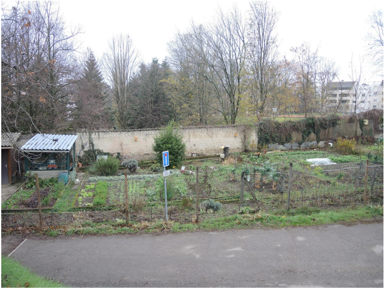
Vue des jardins