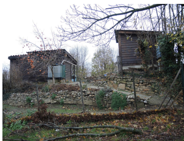
Vue des jardins ouvriers