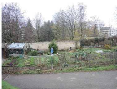
Vue des jardins IVR84_20236900023NUCA