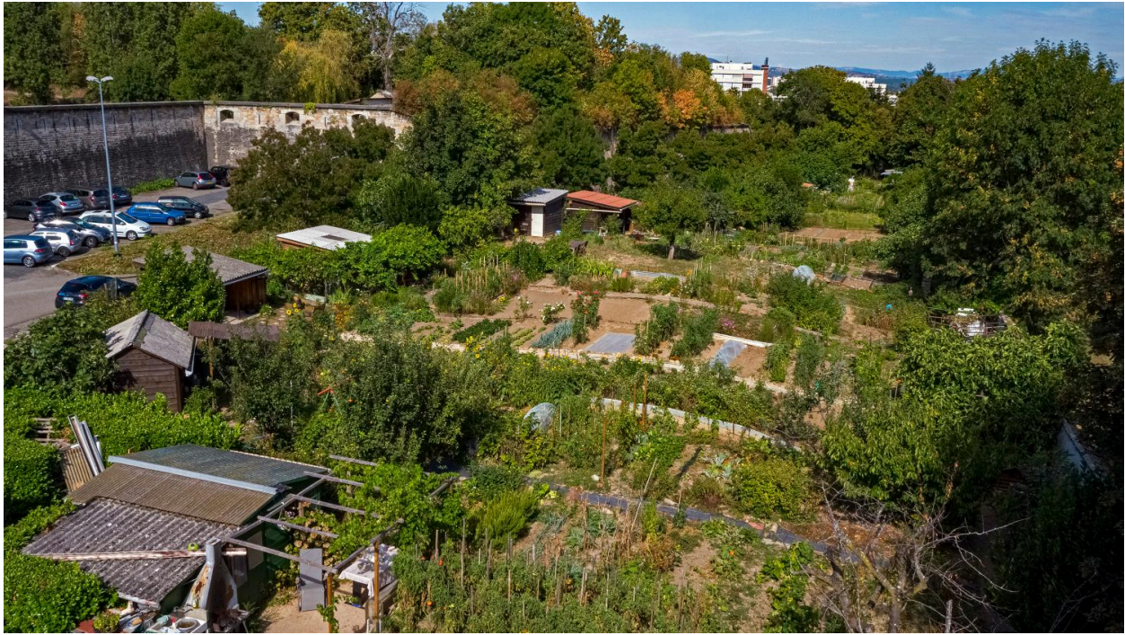
Jardins ouvriers et mur d'enceinte du fort de Saint-Foy-lès-Lyon