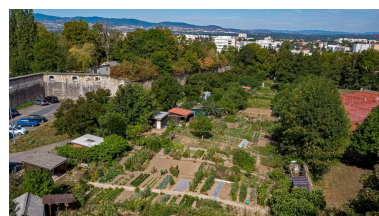
Vue d'ensemble des jardins ouvriers et mur d'enceinte du fort de Saint-Foy