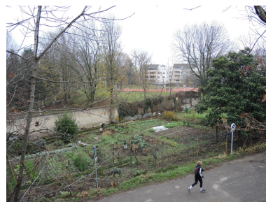
Vue des jardins ouvriers IVR84_20236900021NUCA