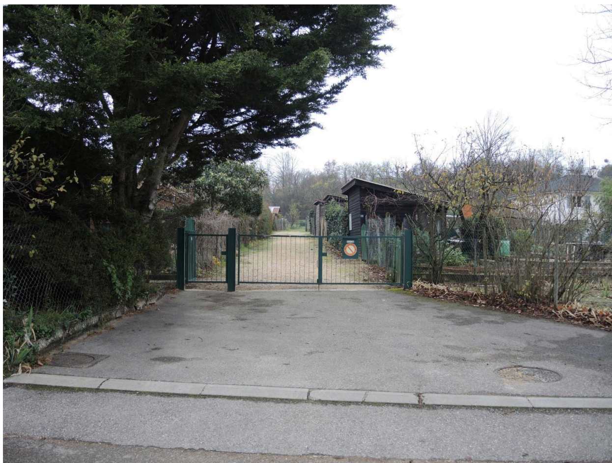
Entrée principale des jardins ouvriers de Saint-Foy-lès-Lyon