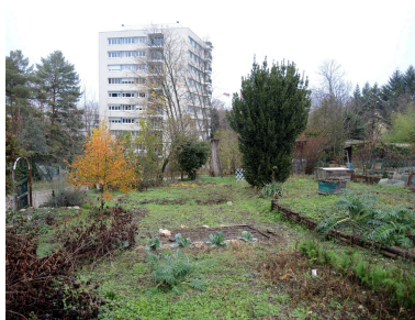
Vue des jardins IVR84_20236900017NUCA