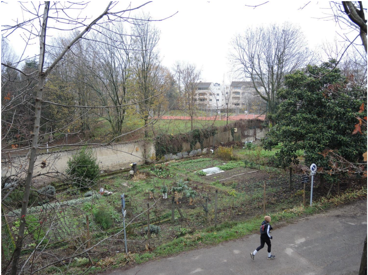
Vue des jardins ouvriers