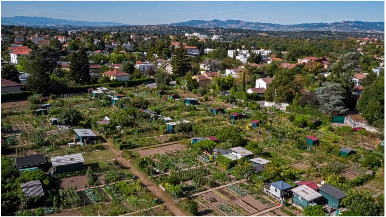
Vue d'ensemble des jardins ouvriers