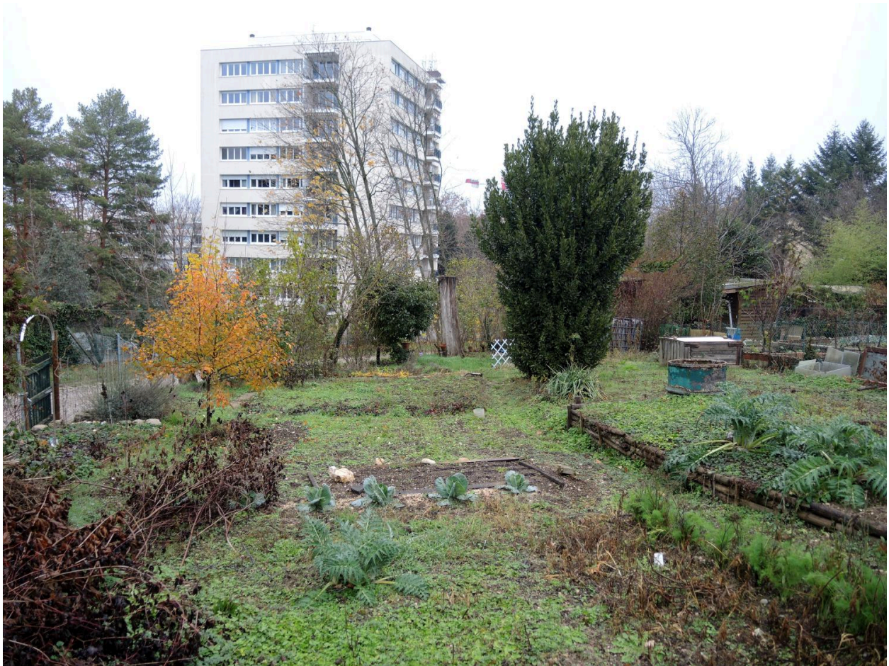
Vue des jardins