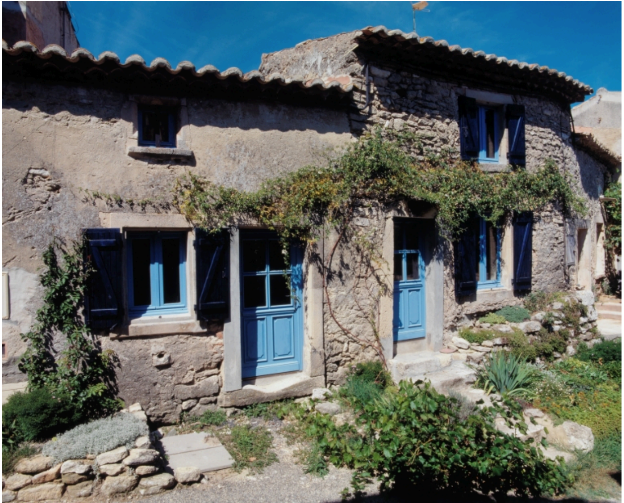
Elévation principale de maisons accolées (A3 537).