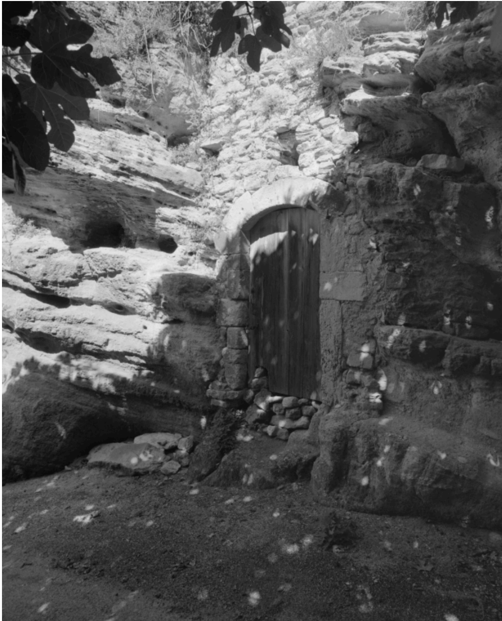
Exemple de dépendance isolée des maisons du village : l'entrée d'une cave troglodytique sous l'ancien château.