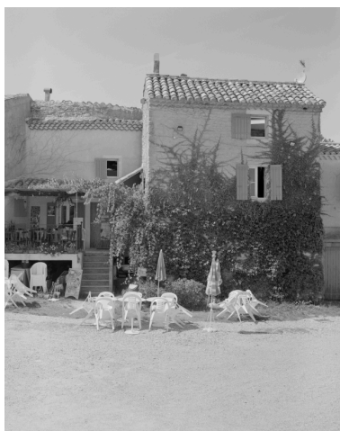
Vue de l'élévation principale d'une maison du haut du village (A3 534), comprenant autrefois une épicerie et aujourd'hui un café.