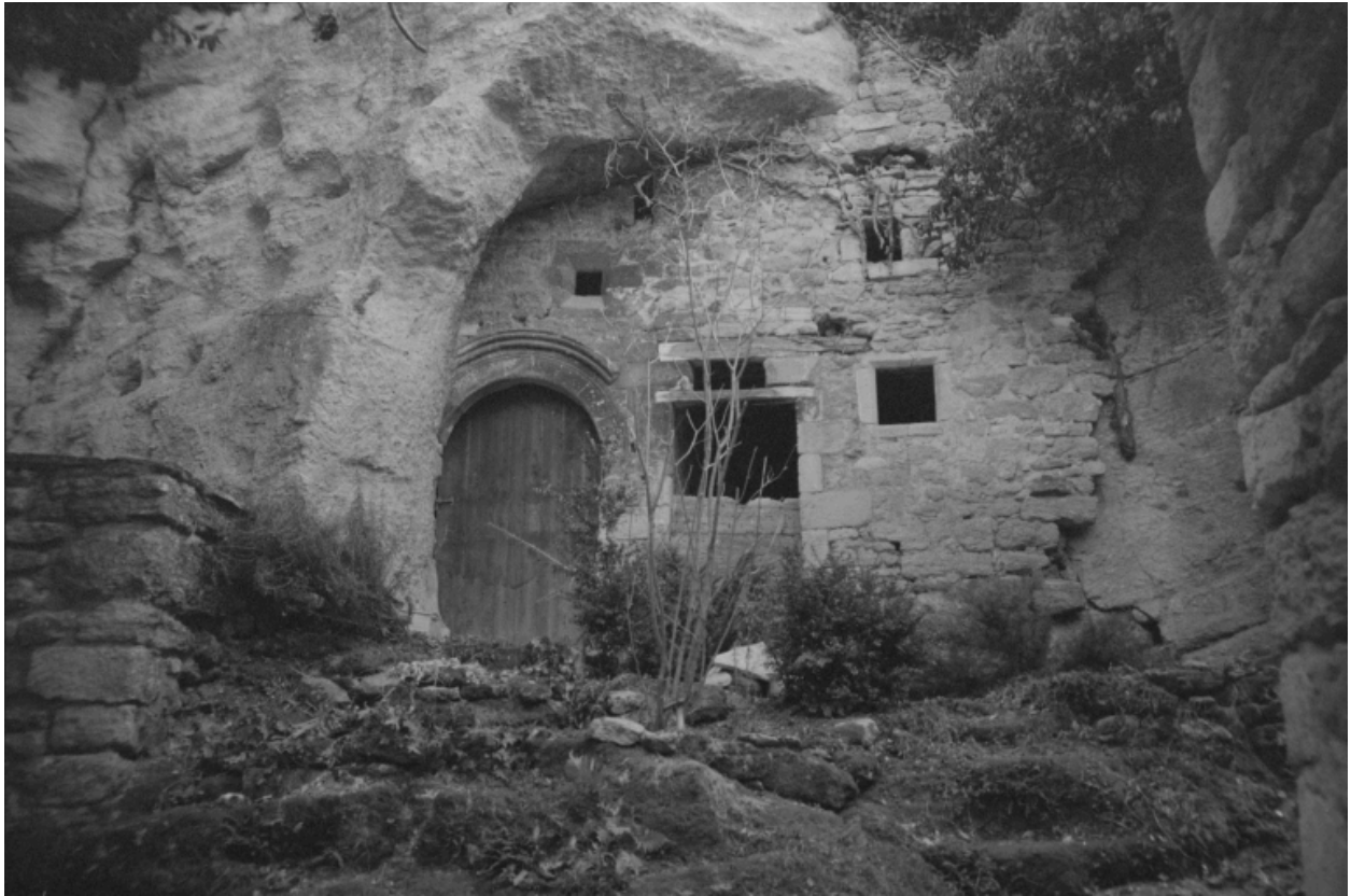
Façade d'habitat troglodytique, aujourd'hui désaffecté, avec porte du 16e siècle (?), dans le noyau ancien du village.