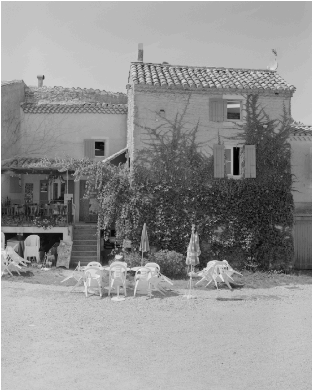
Vue de l'élévation principale d'une maison du haut du village (A3 534), comprenant autrefois une épicerie et aujourd'hui un café.