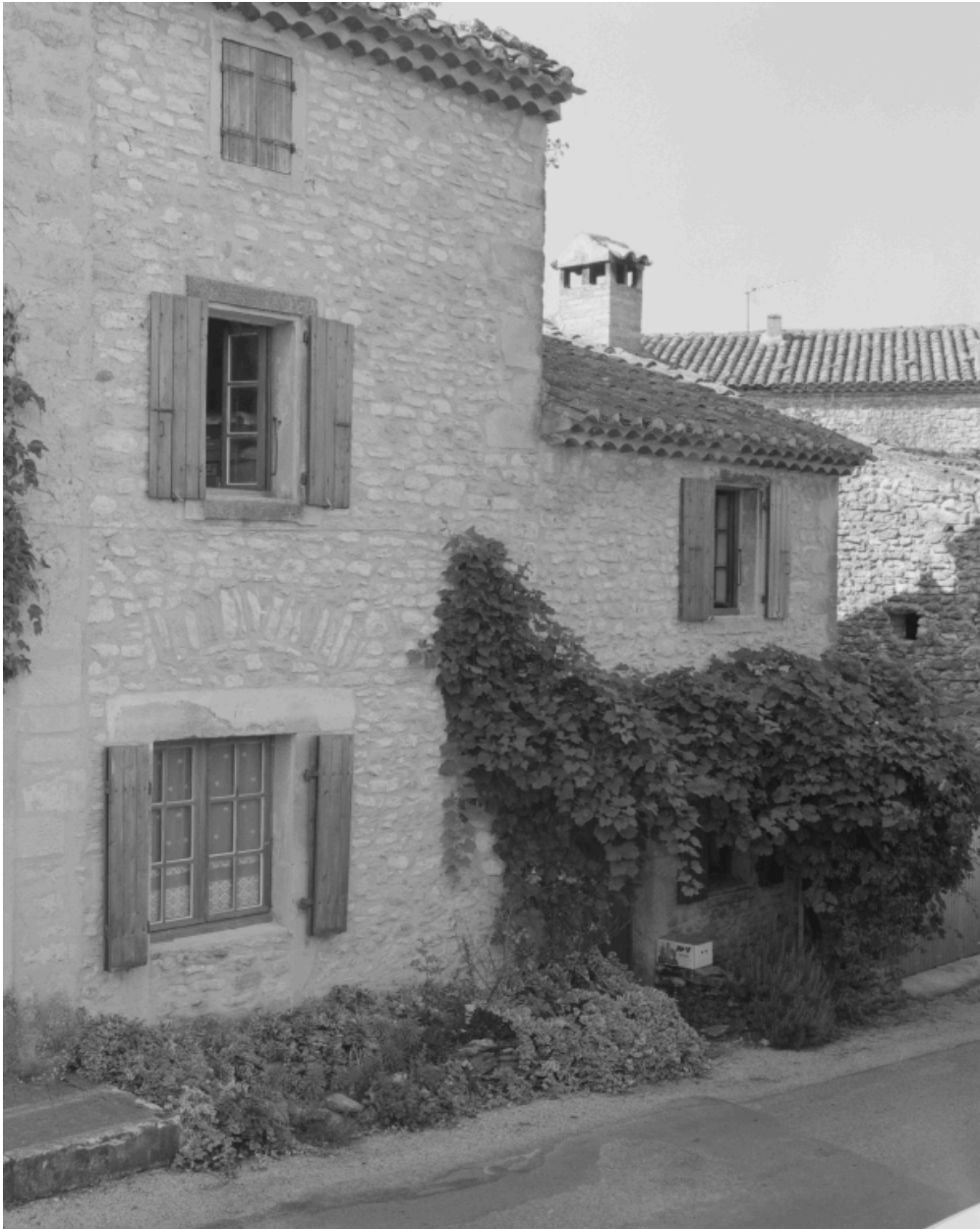
Maison (D 276) de type fréquent, située en bas du village, sur le côté sud de la voie communale n° 1.