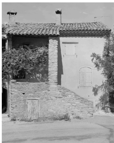
Élévation principale d'une maison (A3 540), située en haut du village, au principal carrefour.