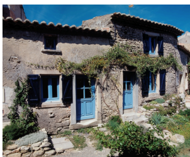
Élévation principale de maisons accolées (A3 537).