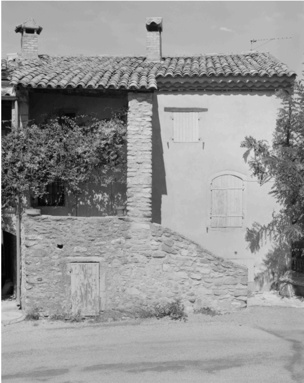
Elévation principale d'une maison (A3 540), située en haut du village, au principal carrefour.