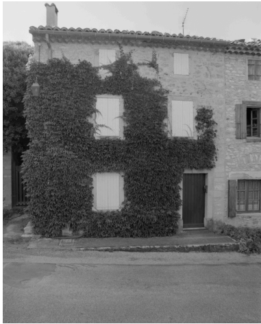
L'élévation principale d'une maison (D 163), portant la date 1830, du type le plus fréquent.