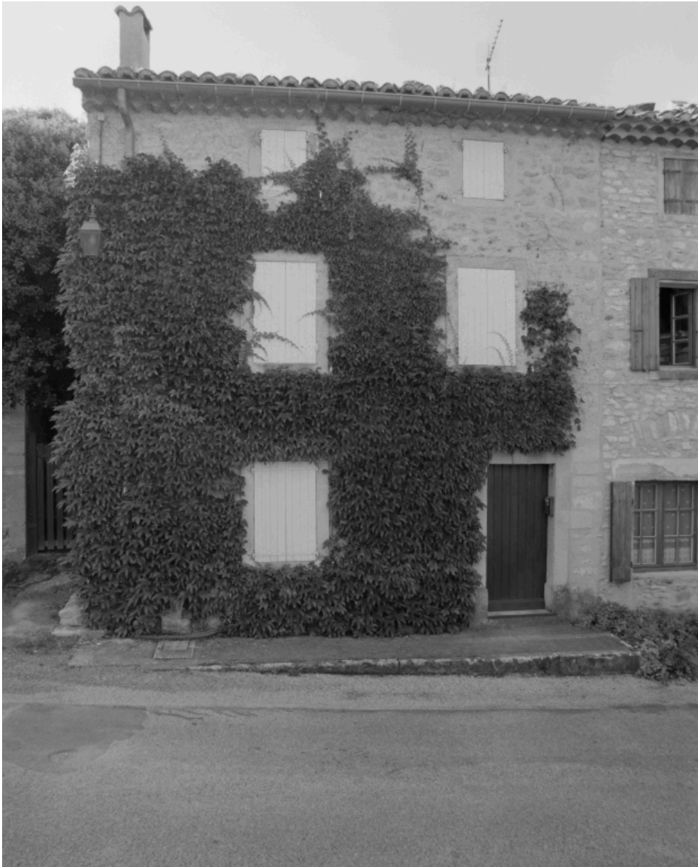
L'élévation principale d'une maison (D 163), portant la date 1830, du type le plus fréquent.