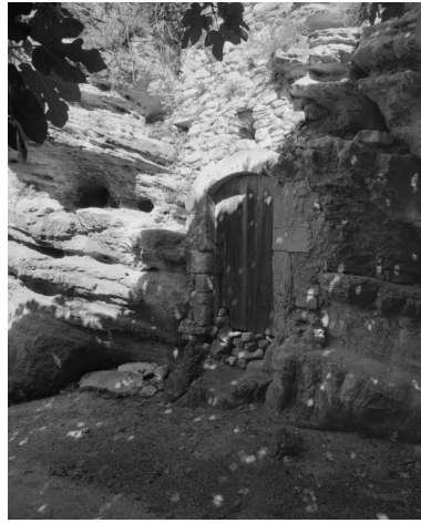
Exemple de dépendance isolée des maisons du village : l'entrée d'une cave troglodytique sous l'ancien château.