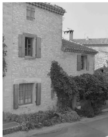
Maison (D 276) de type fréquent, située en bas du village, sur le côté sud de la voie communale n° 1.