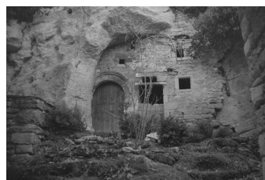
Façade d'habitat troglodytique, aujourd'hui désaffecté, avec porte du 16 e siècle (?), dans le noyau ancien du village. IVR82_20052600008Z