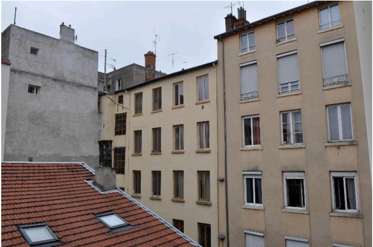
Elévation sur cour, vue partielle (à droite)