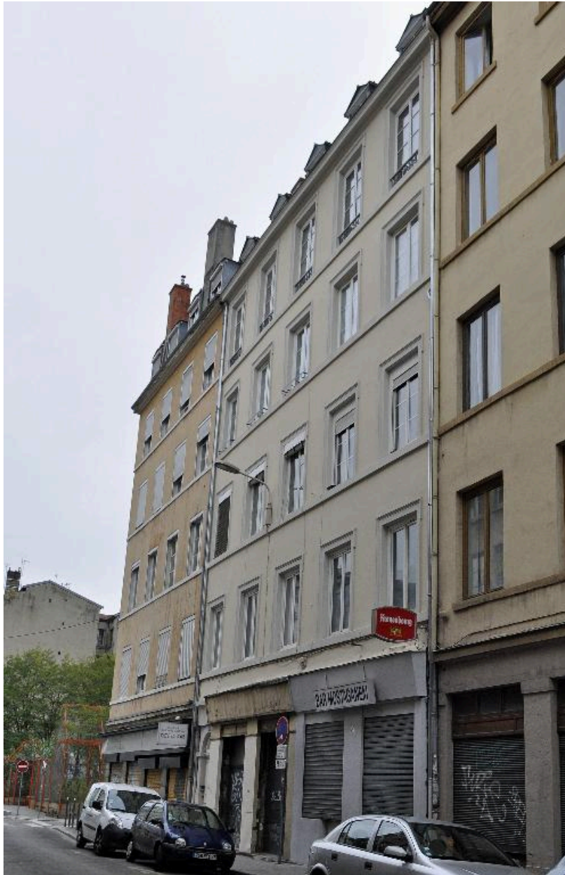
Elévation sur rue