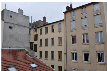
Elévation sur cour, vue partielle (à droite)