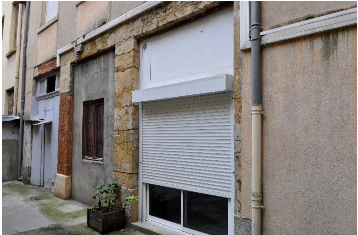
Élévation sur cour, ouvertures du rez-de-chaussée