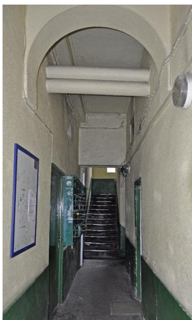
Vue intérieure : l'allée et l'escalier rampe-sur-rampe