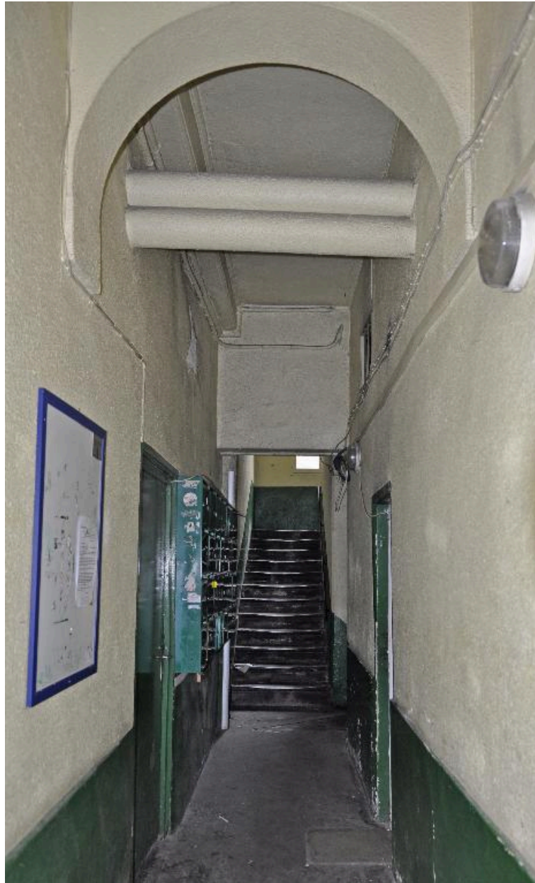
Vue intérieure : l'allée et l'escalier rampe-sur-rampe