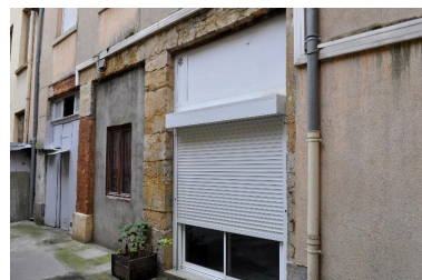
Elévation sur cour, ouvertures du rez-de-chaussée IVR84_20166900793NUCA