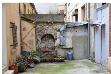
Cour, ancienne fontaine IVR84_20166900792NUCA