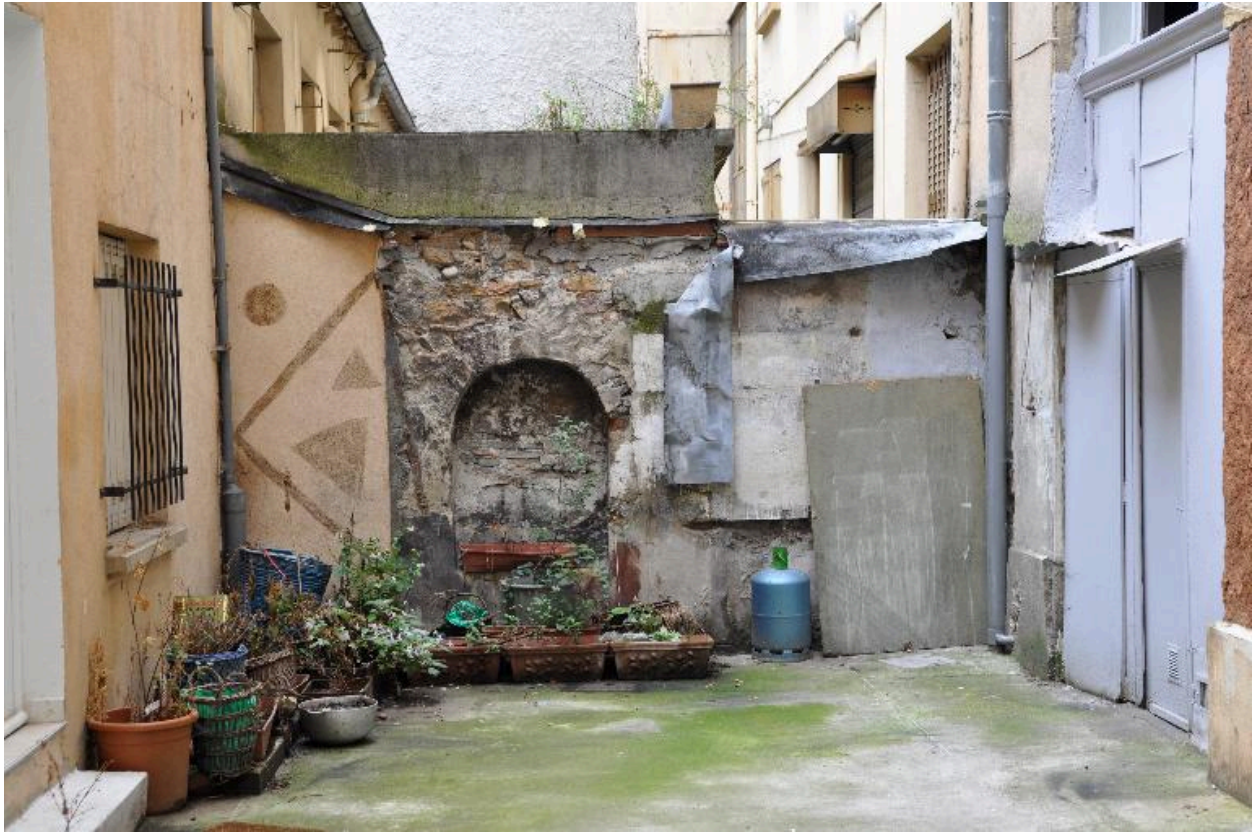
Cour, ancienne fontaine