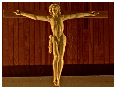
Vue générale du Christ en croix IVR82_20066900623NUCA