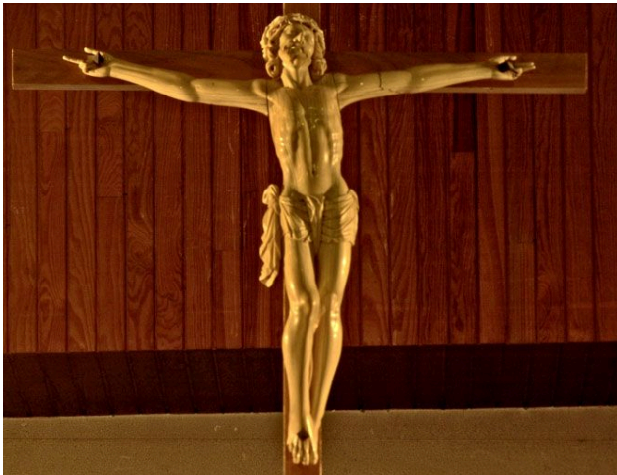
Vue générale du Christ en croix