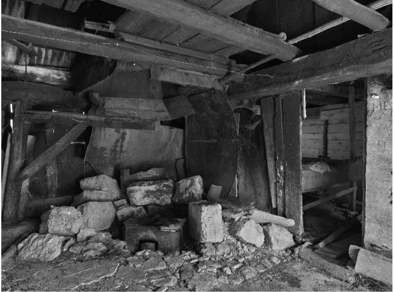
Vue intérieure de la cuisine et salle de fabrication : angle du foyer, cloison et porte vers la chambre.