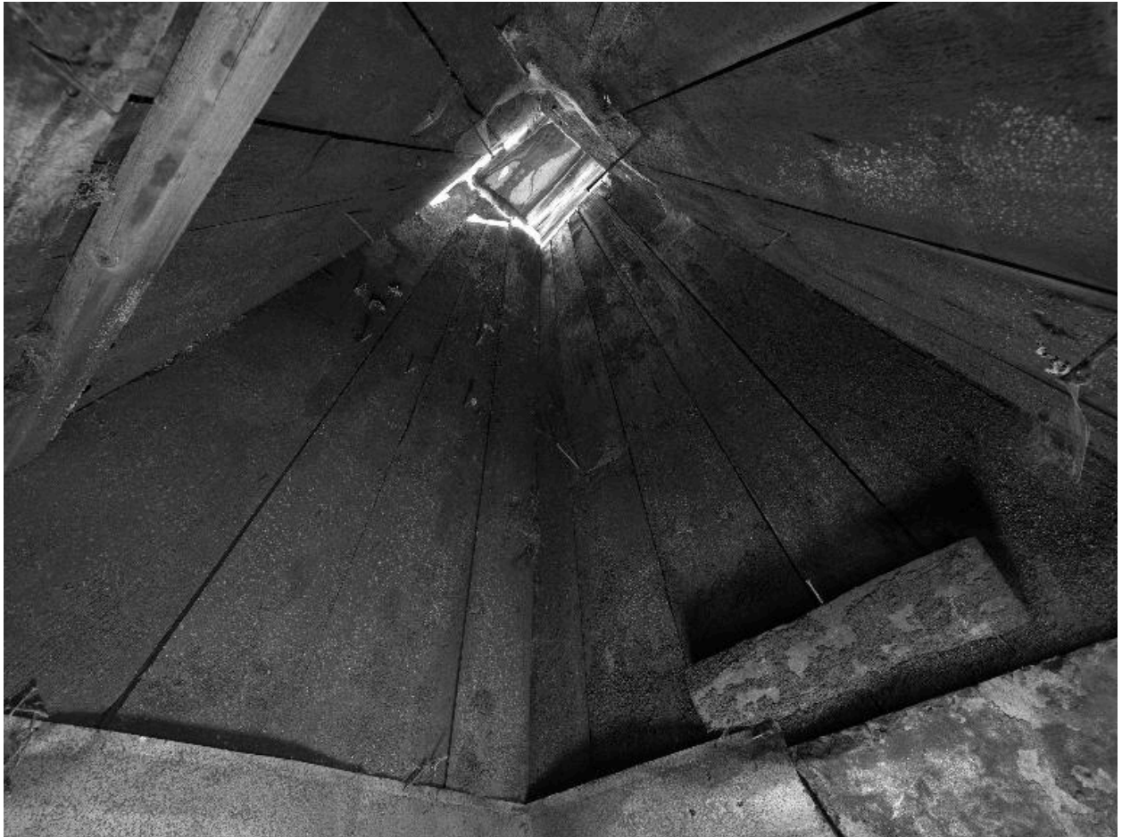
Détail du conduit de cheminée en bois.