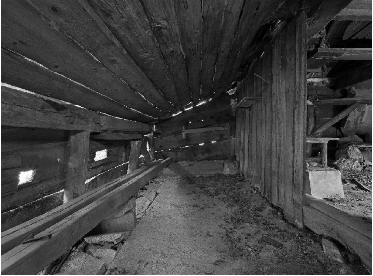
Vue intérieure du freidi.