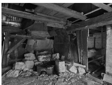
Vue intérieure de la cuisine et salle de fabrication : angle du foyer, cloison et porte vers la chambre.