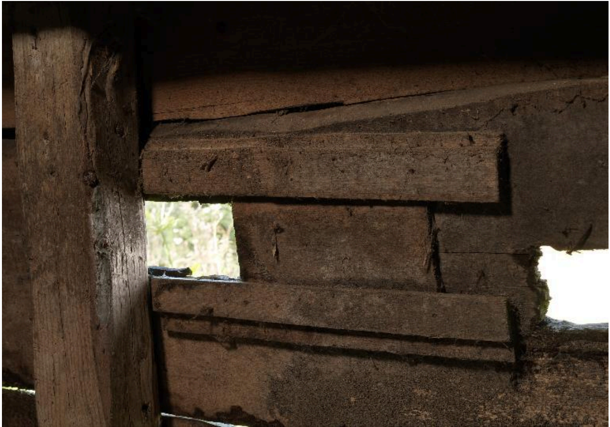
Détail des ouvertures à volet coulissant du freidi.