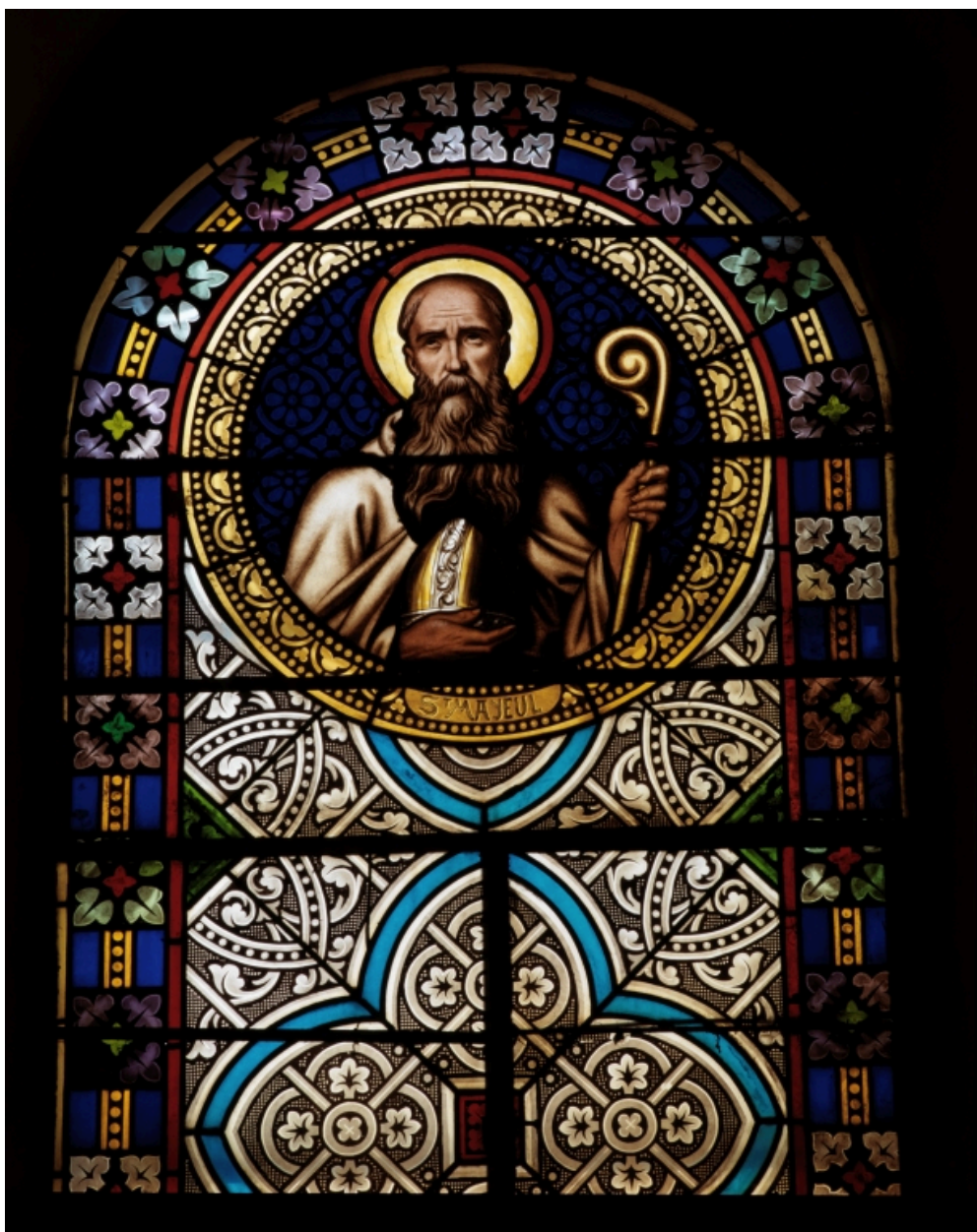
Détail : médaillon de saint Mayeul.