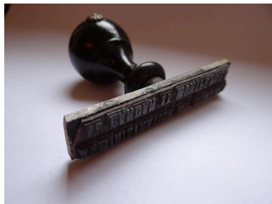
Vue générale IVR84_20216300466NUC4A