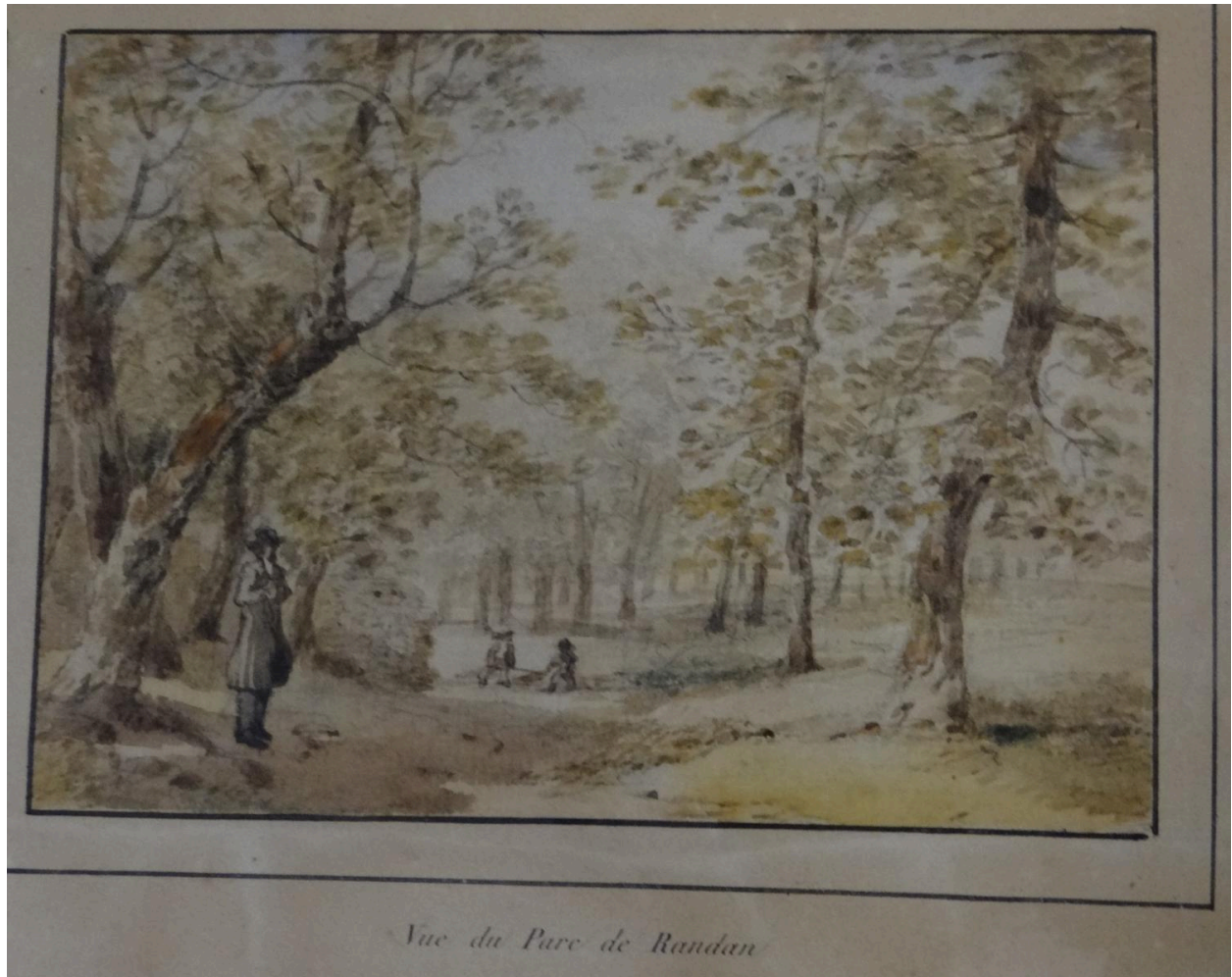
Aquarelle droite - Parc du château