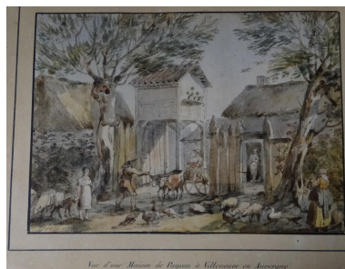
Aquarelle gauche - Ferme à Villeneuve IVR84_20216300496NUCA