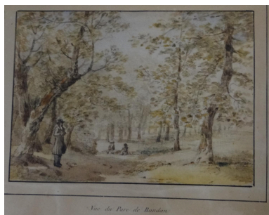
Aquarelle droite - Parc du château IVR84_20216300498NUCA