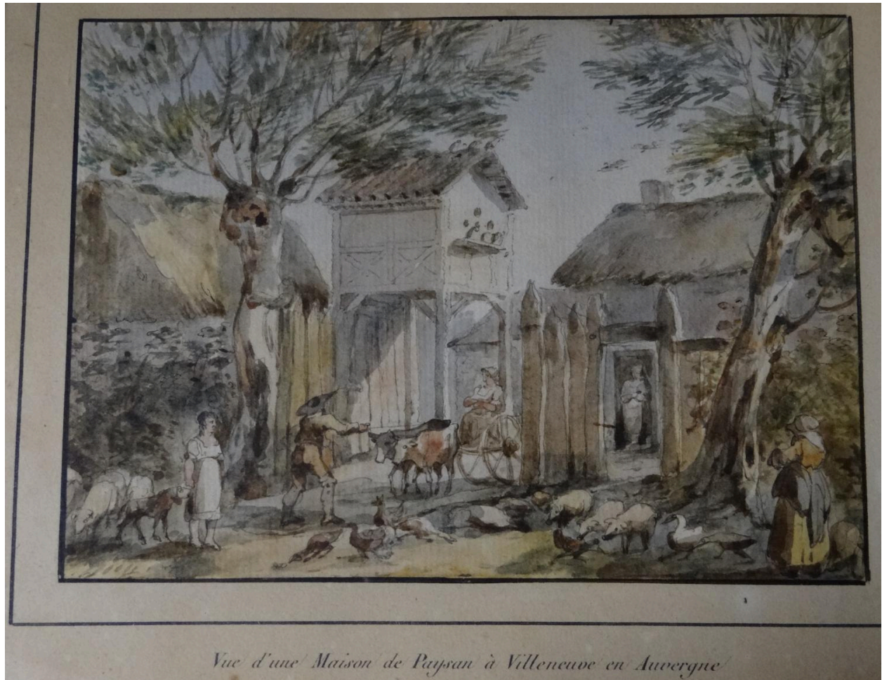
Aquarelle gauche - Ferme à Villeneuve