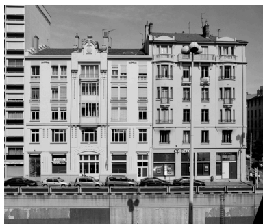
Vue générale ouest IVR82_20056902975X