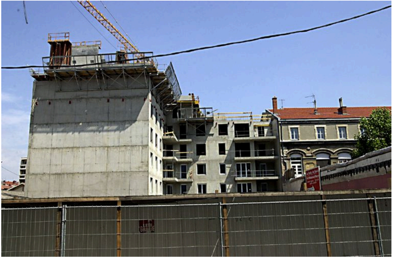
Immeuble en construction, côté rue du Béguin