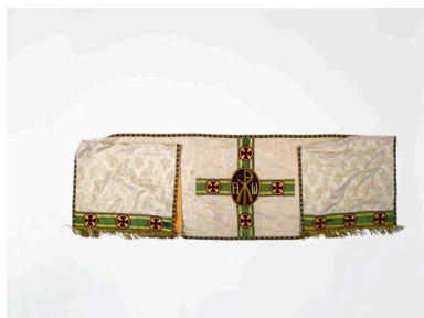
Vue générale IVR84_20160300125NUC4A