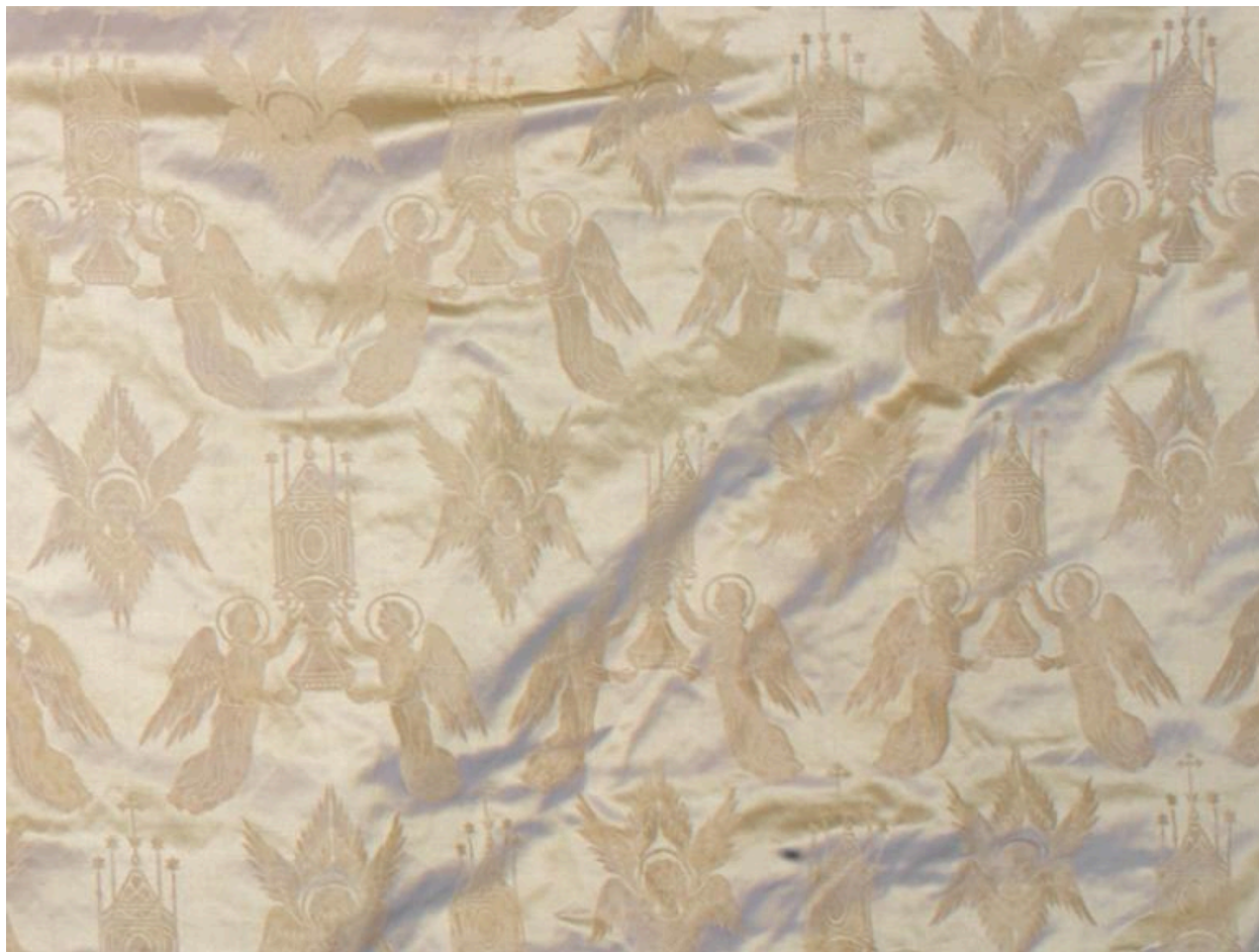
Détail du motif du voile huméral (détail de 20160300125NUC4A)