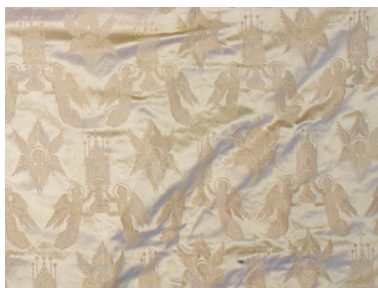
Détail du motif du voile huméral (détail de 20160300125NUC4A) IVR84_20160300173NUC4A