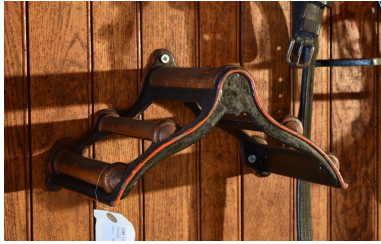
Vue générale d'un support IVR84_20226303393NUC4A