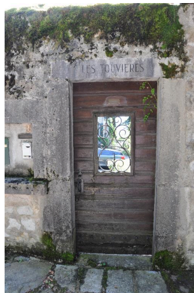
Porte d'entrée et linteau gravé