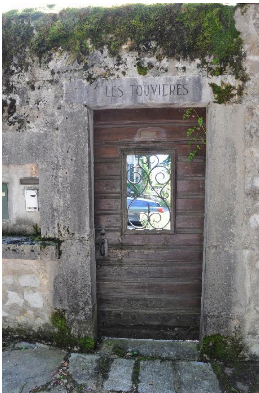
Porte d'entrée et linteau gravé