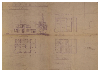
Plans et élévation