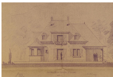
Elévation ouest IVR82_20137300802NUCB