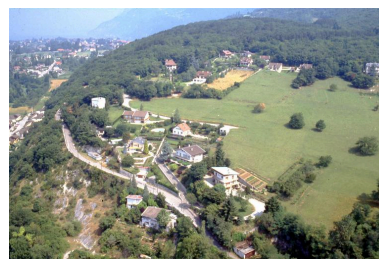
Vue aérienne : maison dite Les Touvières (en-haut à gauche) IVR82_20147300046NUCB