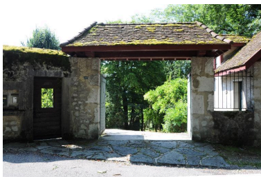
Portail d'entrée