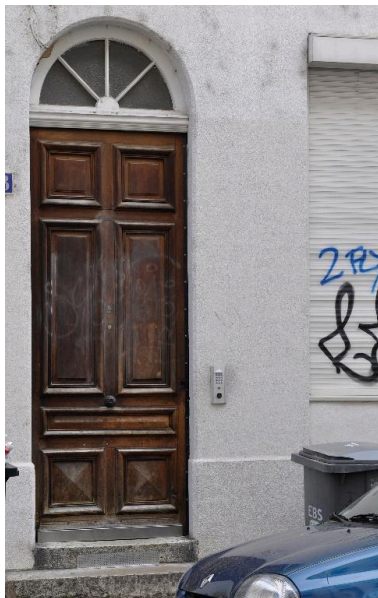
Vue rapprochée de la porte IVR84_20176901481NUCA