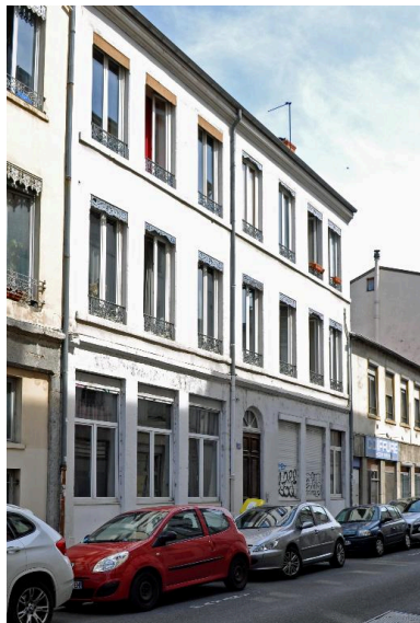
Vue générale, élévation sur rue IVR84_20176901480NUCA