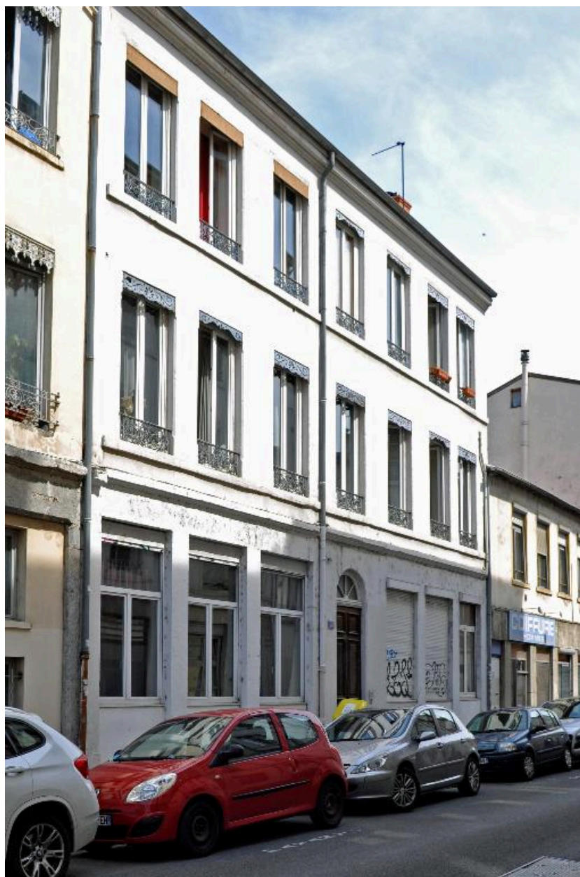
Vue générale, élévation sur rue