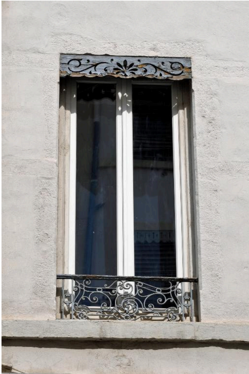
Détail d'une fenêtre du premier étage : garde-corps en ferronnerie et lambrequin en bois