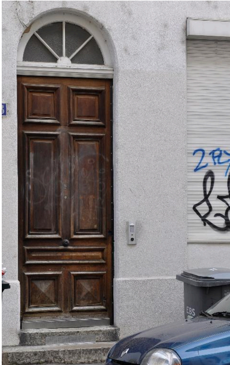
Vue rapprochée de la porte