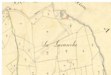
Premier cadastre français, Saint-Jean-de-la-Porte, 1892, Section C, feuille 1 (FR.AD073, 3P 7250).

Autr. Clara Bérelle IVR82_20147303008NUCA