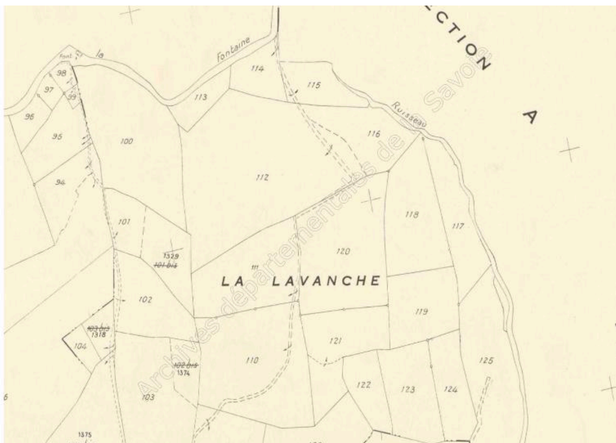
Cadastre rénové, Saint-Jean-de-la-Porte, 1954/1988, Section C, feuille 1 (FR.AD073, 3P 7251).