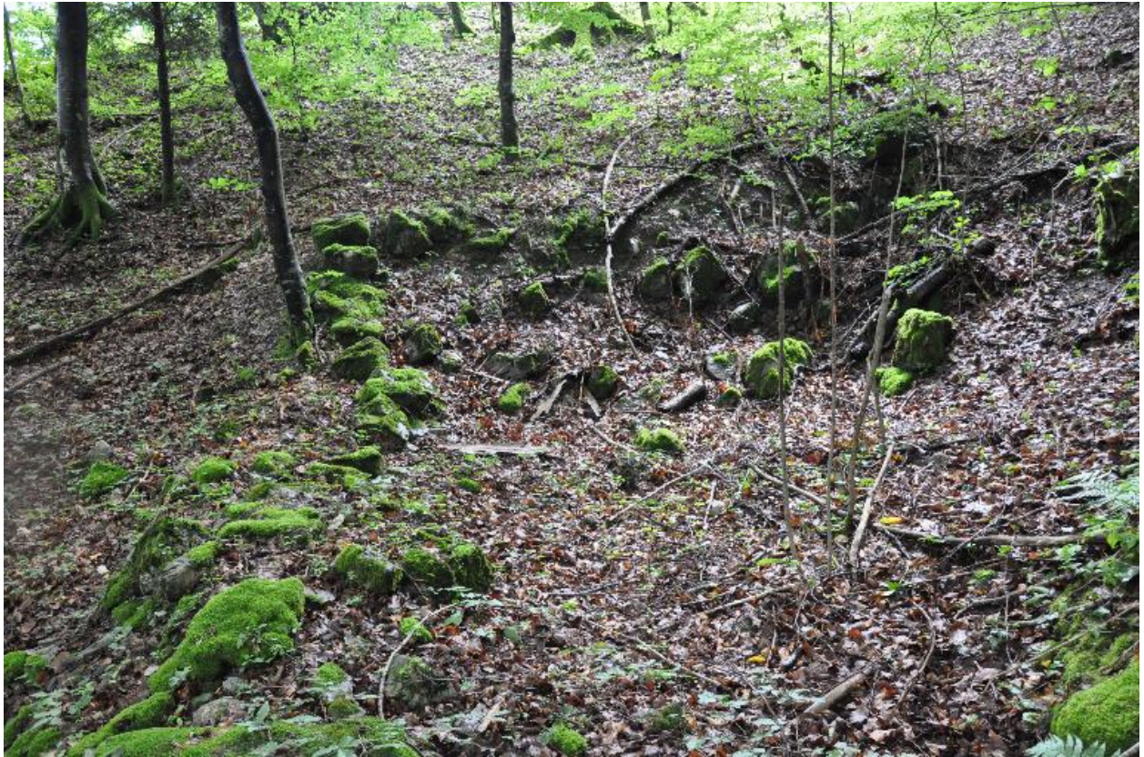
Vestiges du moulin.