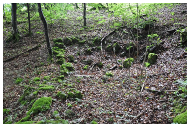
Vestiges du moulin.

Autr. Clara Bérelle IVR82_20147303010NUCA