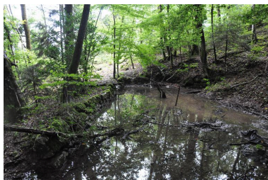
Réserve d'eau du moulin Gaudin.

IVR82_20147303011NUCA