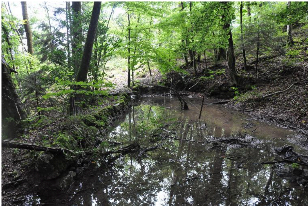
Réserve d'eau du moulin Gaudin.