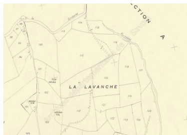
Cadastre rénové, Saint-Jean-de-la-Porte, 1954/1988, Section C, feuille 1 (FR.AD073, 3P 7251).

Autr. Clara Bérelle IVR82_20147303008NUCA