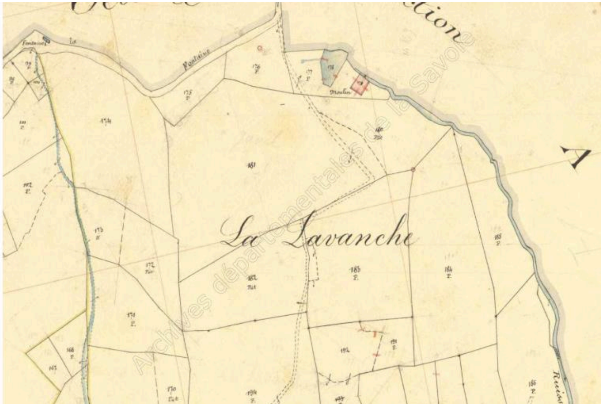
Premier cadastre français, Saint-Jean-de-la-Porte, 1892, Section C, feuille 1 (FR.AD073, 3P 7250).