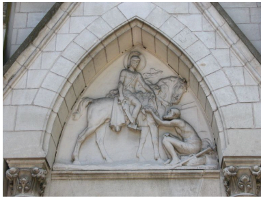
Vue d'ensemble du tympan sculpté IVR82_20114200107NUCA