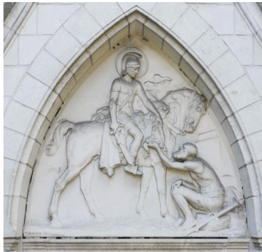
Vue générale IVR82_20074201163NUCA