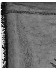
vue de détail du damas du fond