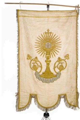
Vue générale de l'avert IVR83_20136300300NUC4A