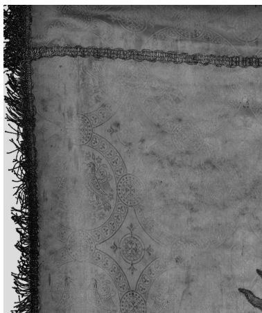
vue de détail du damas du fond IVR83_20136300300NUC4A