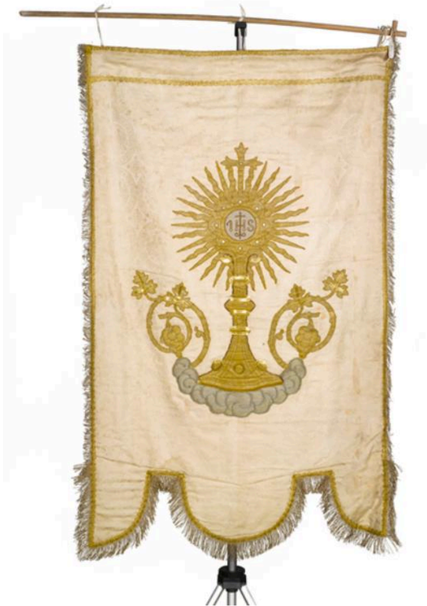
Vue générale de l'avvers