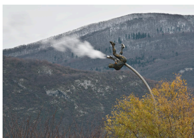
Détail de la partie supérieure IVR84_20197302461NUCAQ