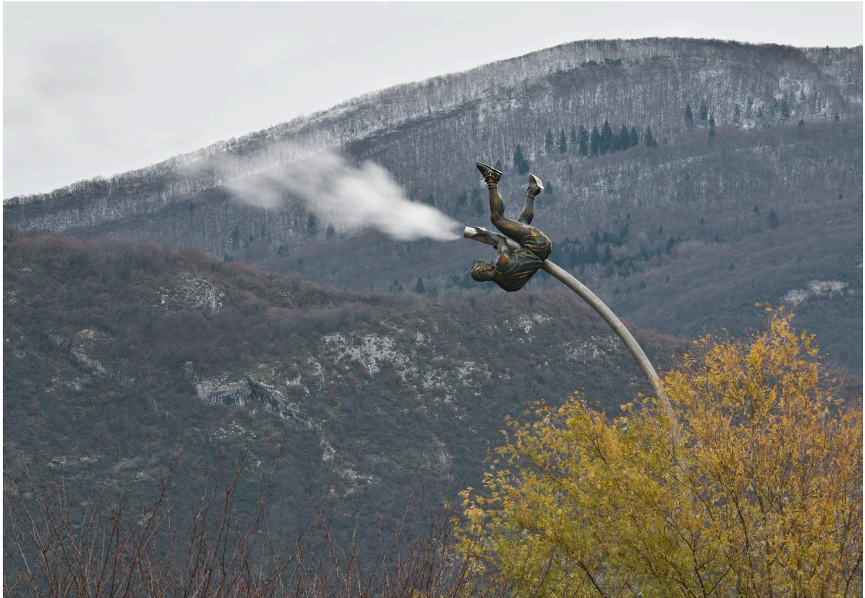
Détail de la partie supérieure