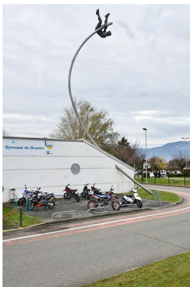
Vue d'ensemble 1 IVR84_20197302483NUCAQ