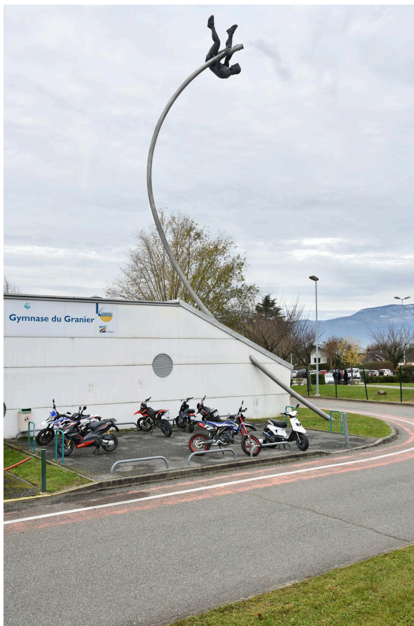
Vue d'ensemble 1