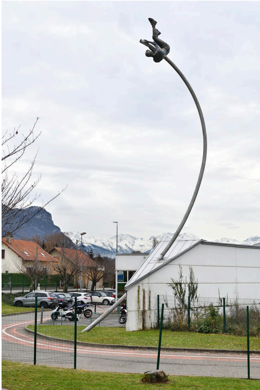
Vue d'ensemble 3