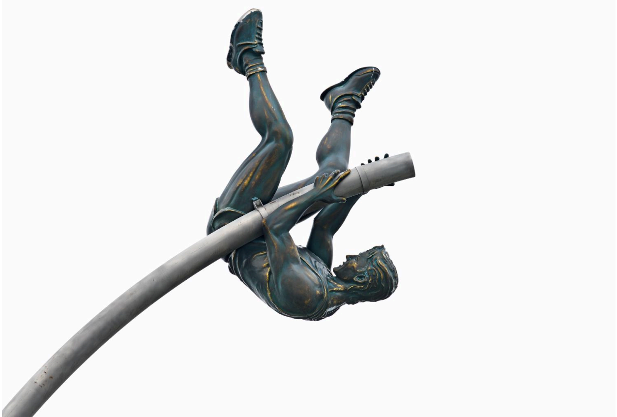
Le perchiste : profil gauche