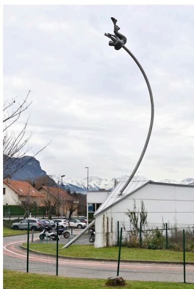
Vue d'ensemble 3 IVR84_20197302473NUCAQ