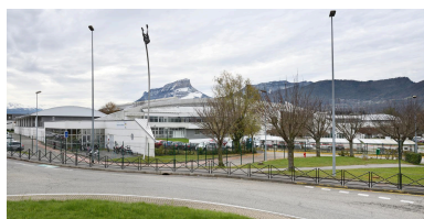
L'œuvre dans son contexte. IVR84_20197302452NUCAQ