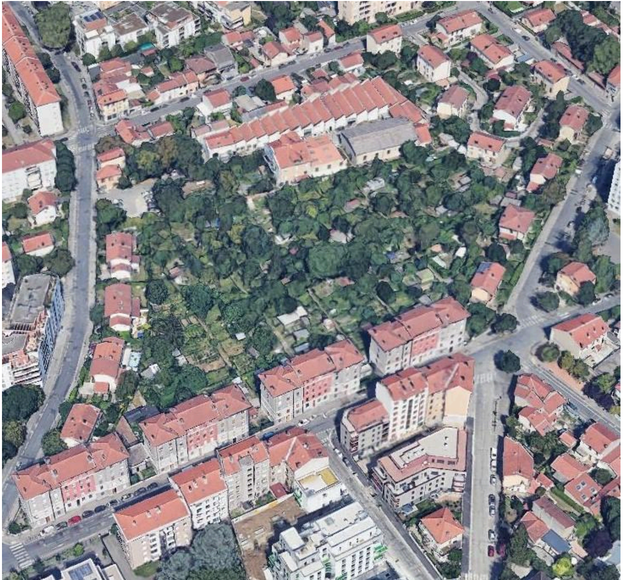
Jardins ouvriers Flachet à Villeurbanne (vue Google)