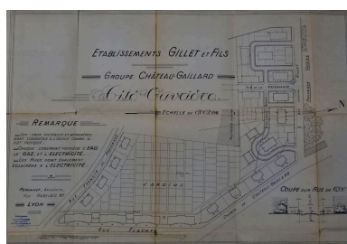
Plan de la cité ouvrière Château-Gaillard (AC Villeurbanne) IVR84_20196901031NUC