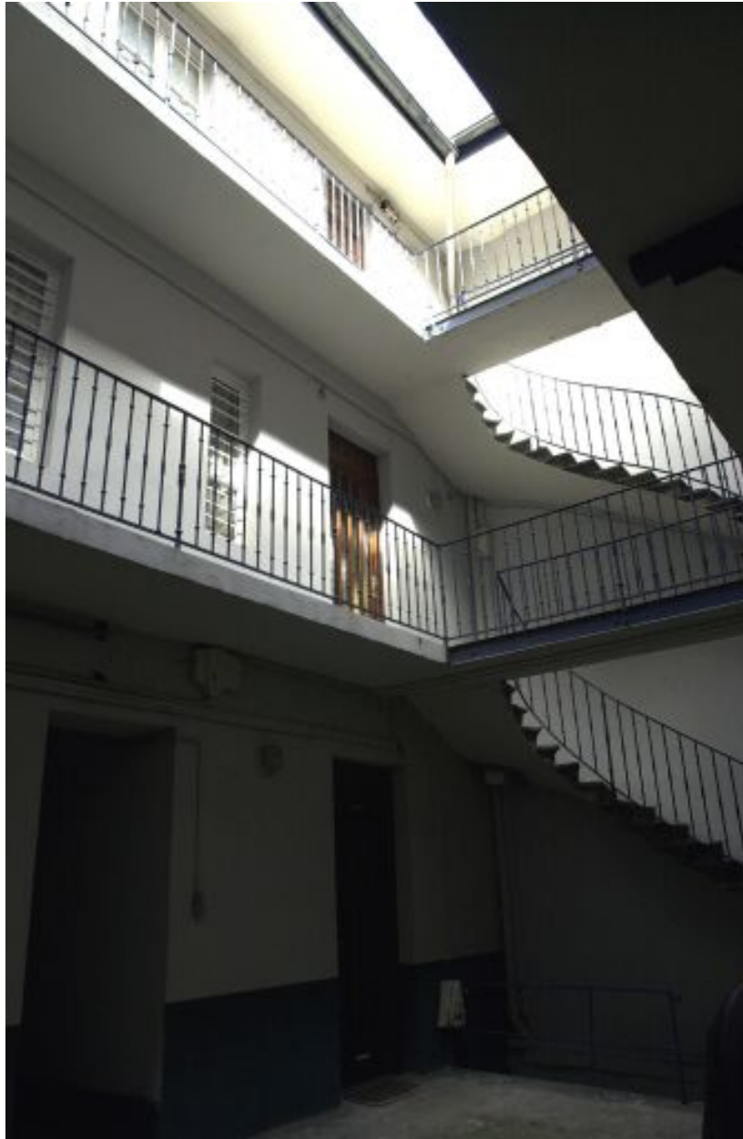
L'escalier de la 2e cour et la coursière du corps de bâtiment occidental