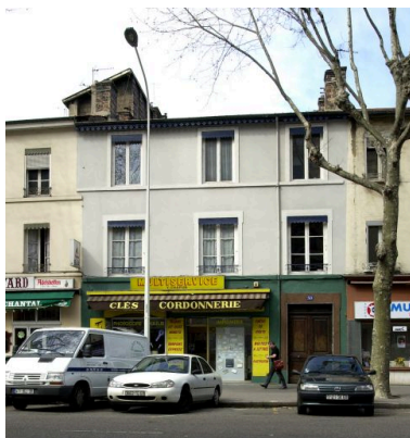
Élévation cours Charlemagne