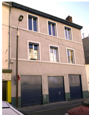
Élévation rue Seguin IVR82_20016901804NUCA