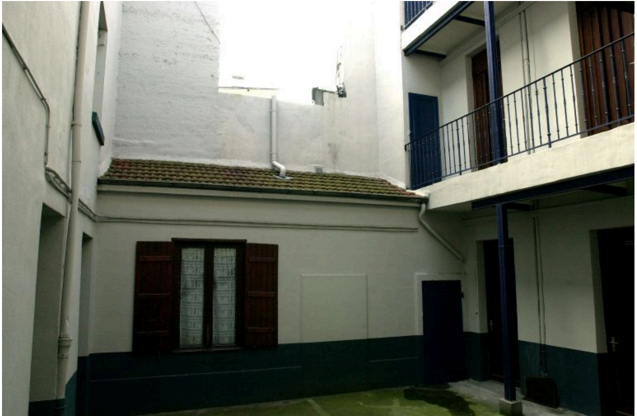
corps de bâtiment latéral de la 1ère cour