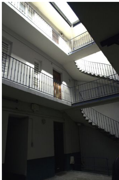
L'escalier de la 2e cour et la coursière du corps de bâtiment occidental IVR82_20016901808NUCA