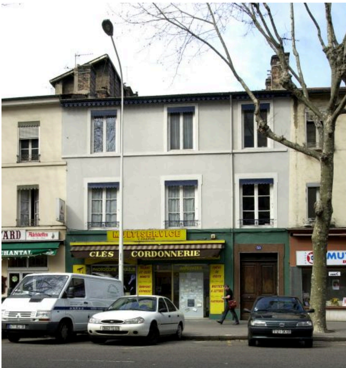
Elévation cours Charlemagne