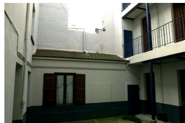
corps de bâtiment latéral de la 1ère cour IVR82_20016901807NUCA