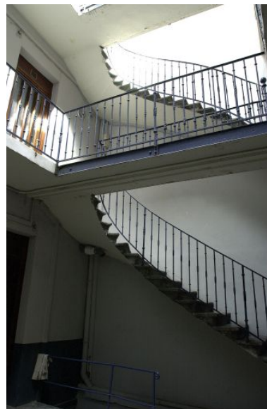
Le système de coursières et de passerelles de la 2e cour IVR82_20016901811NUCA