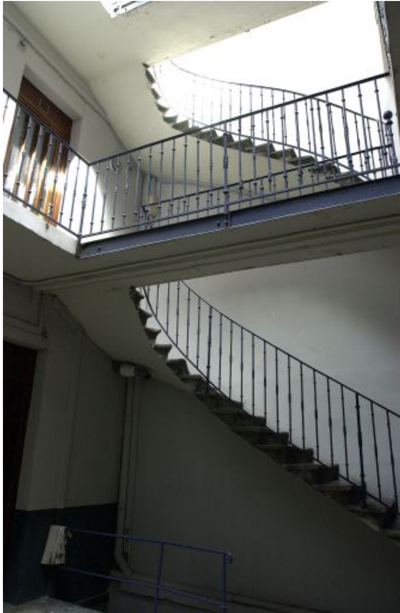
Le système de coursières et de passerelles de la 2e cour