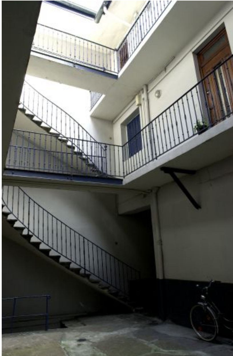
L'escalier de la 2e cour et la coursière du corps de bâtiment central