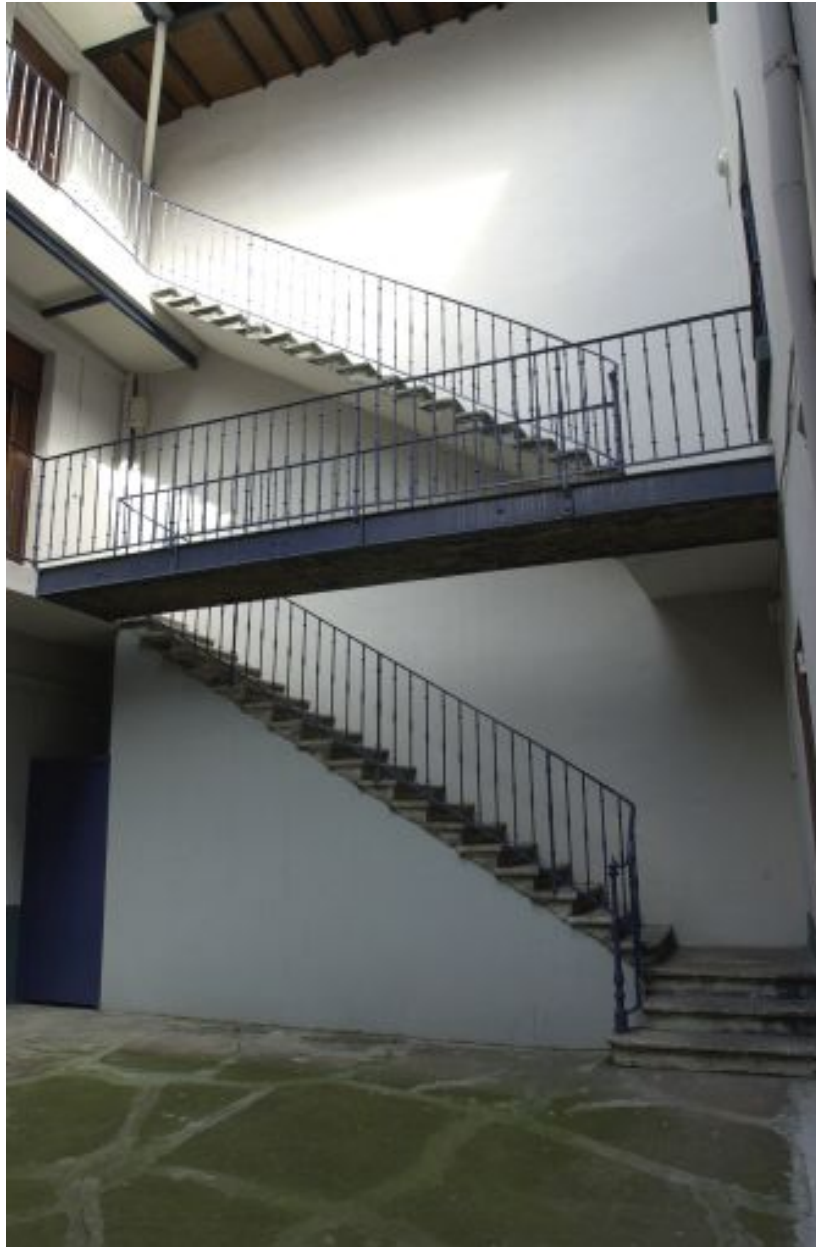
L'escalier de la 1ère cour