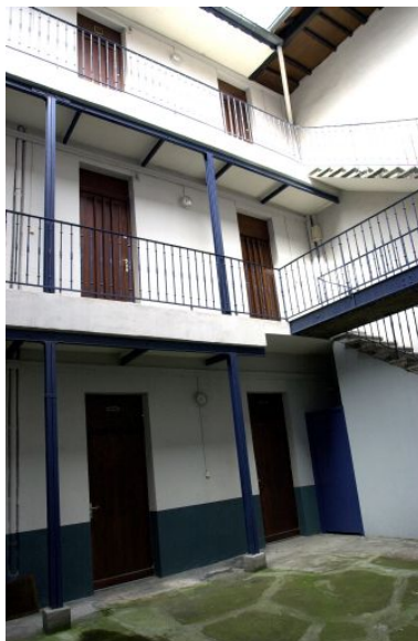
La coursière de l'immeuble de la cour, élévation est IVR82_20016901806NUCA