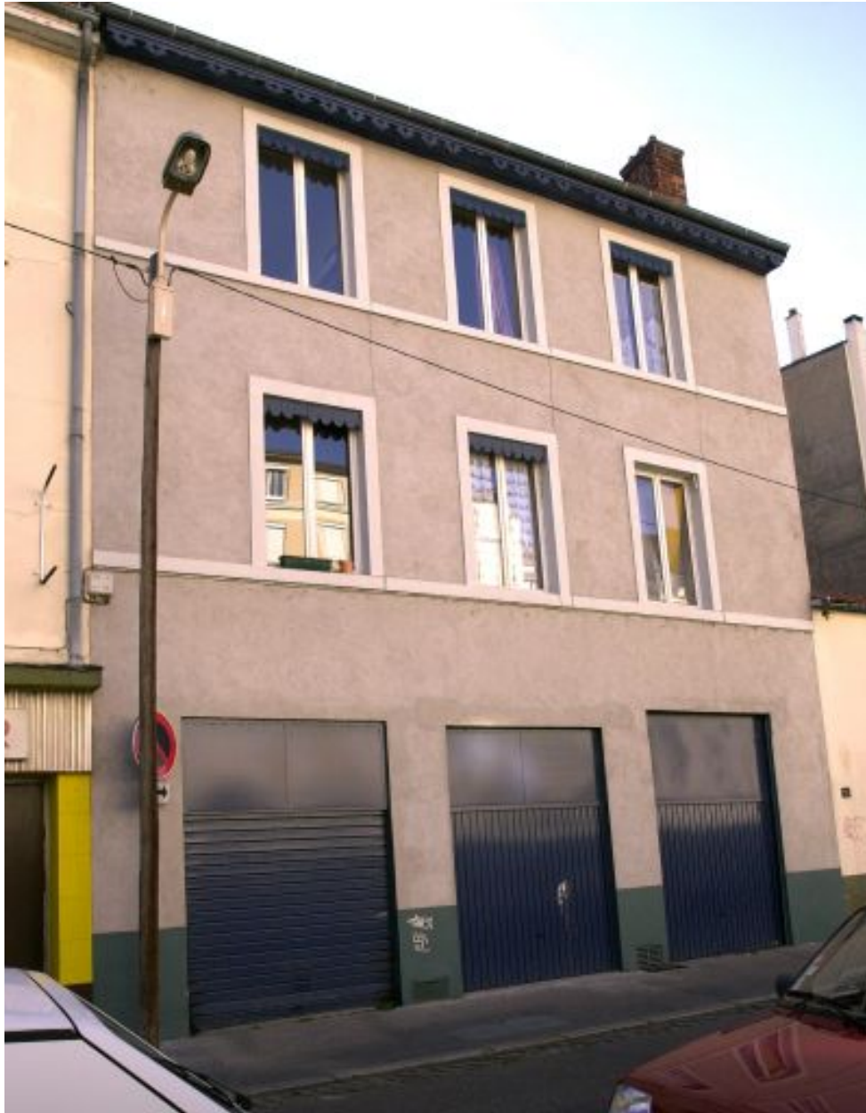
Elévation rue Seguin