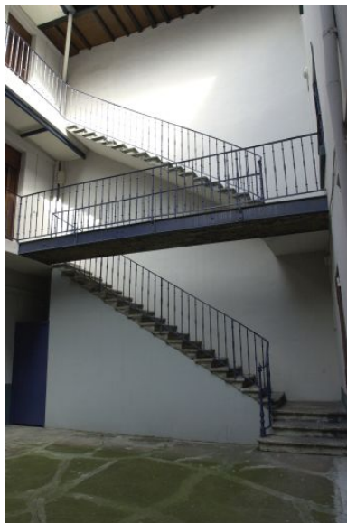
L'escalier de la 1ère cour IVR82_20016901805NUCA