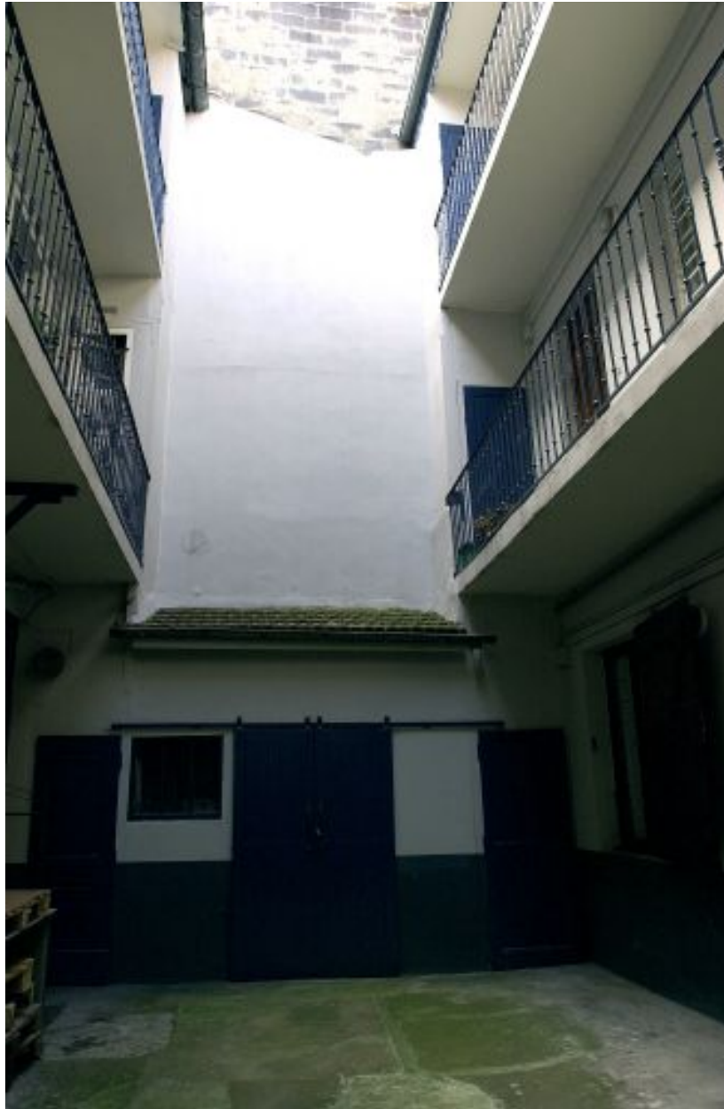
Le corps de bâtiment latéral de la 2e cour et le double jeu de coursières