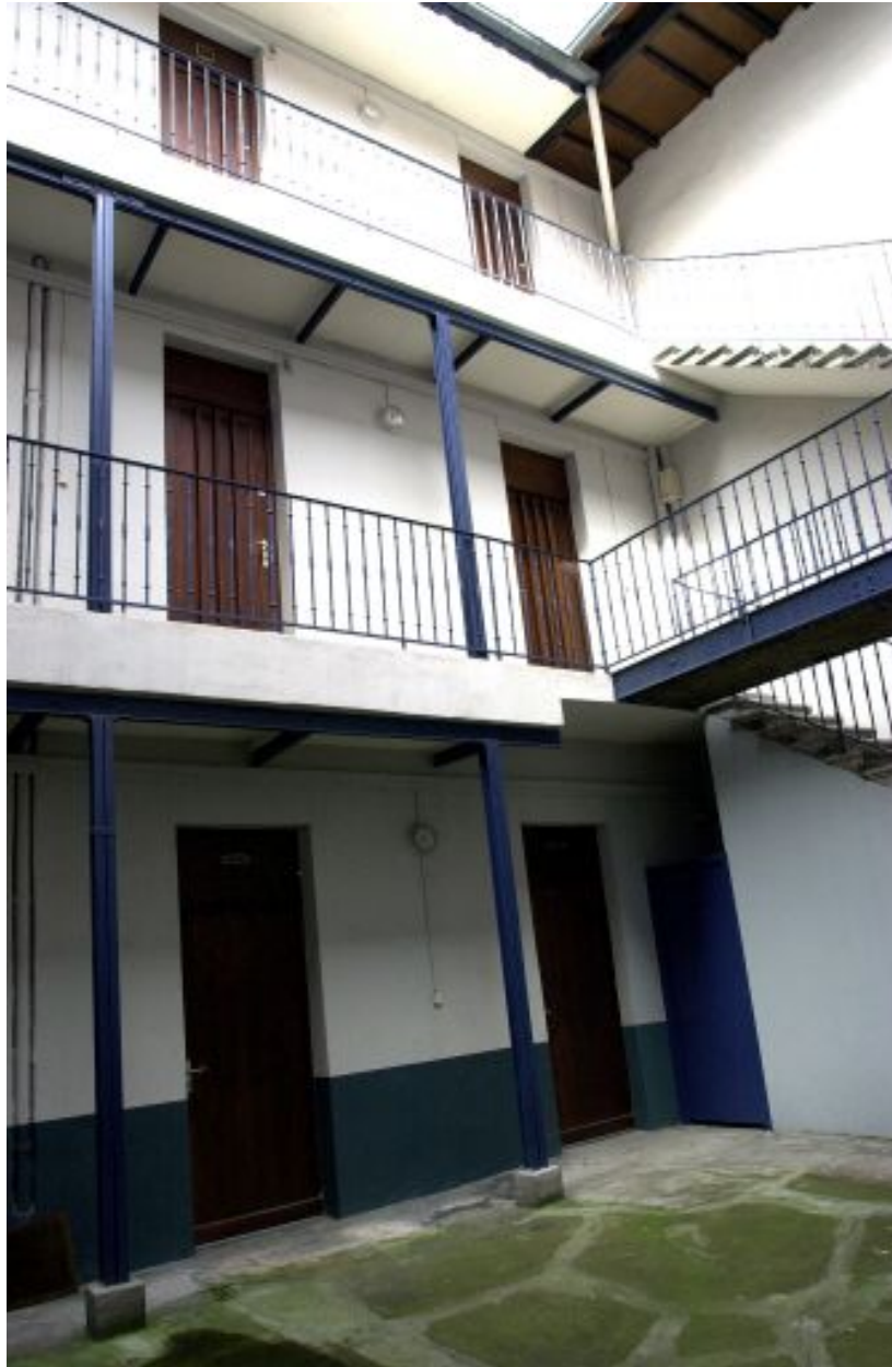
La coursière de l'immeuble de la cour, élévation est