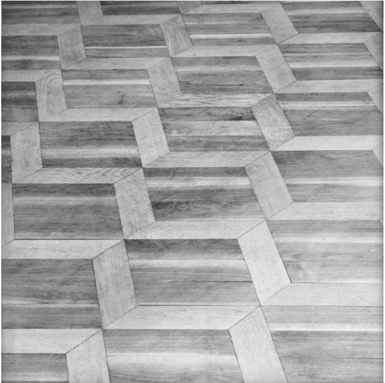
Détail du parquet en noyer : effet en trompe l'oeil de cubes étagés.