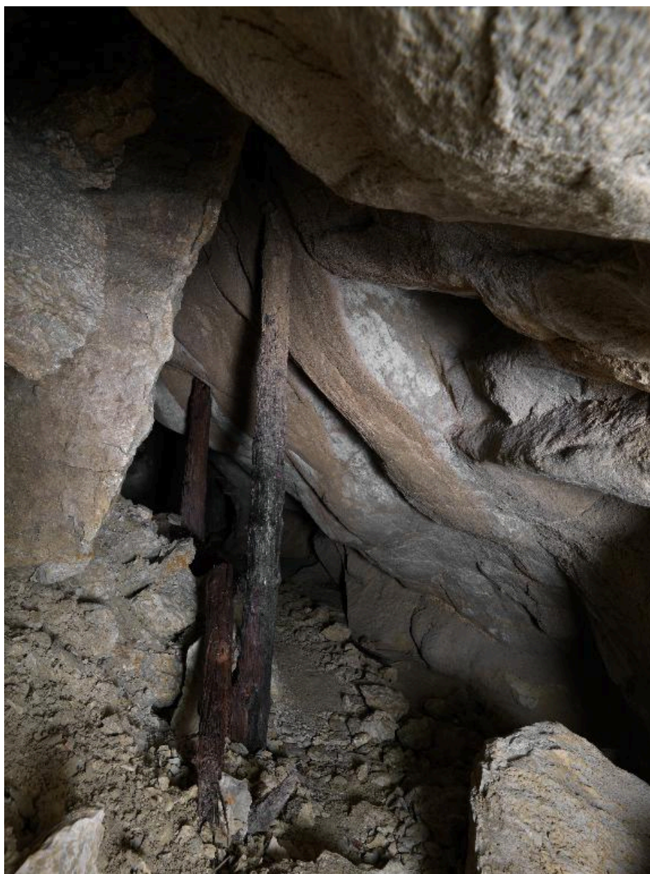
Vue intérieure de la grotte des Mineurs, sur l'alpage du Lac (montagne du Colombier).