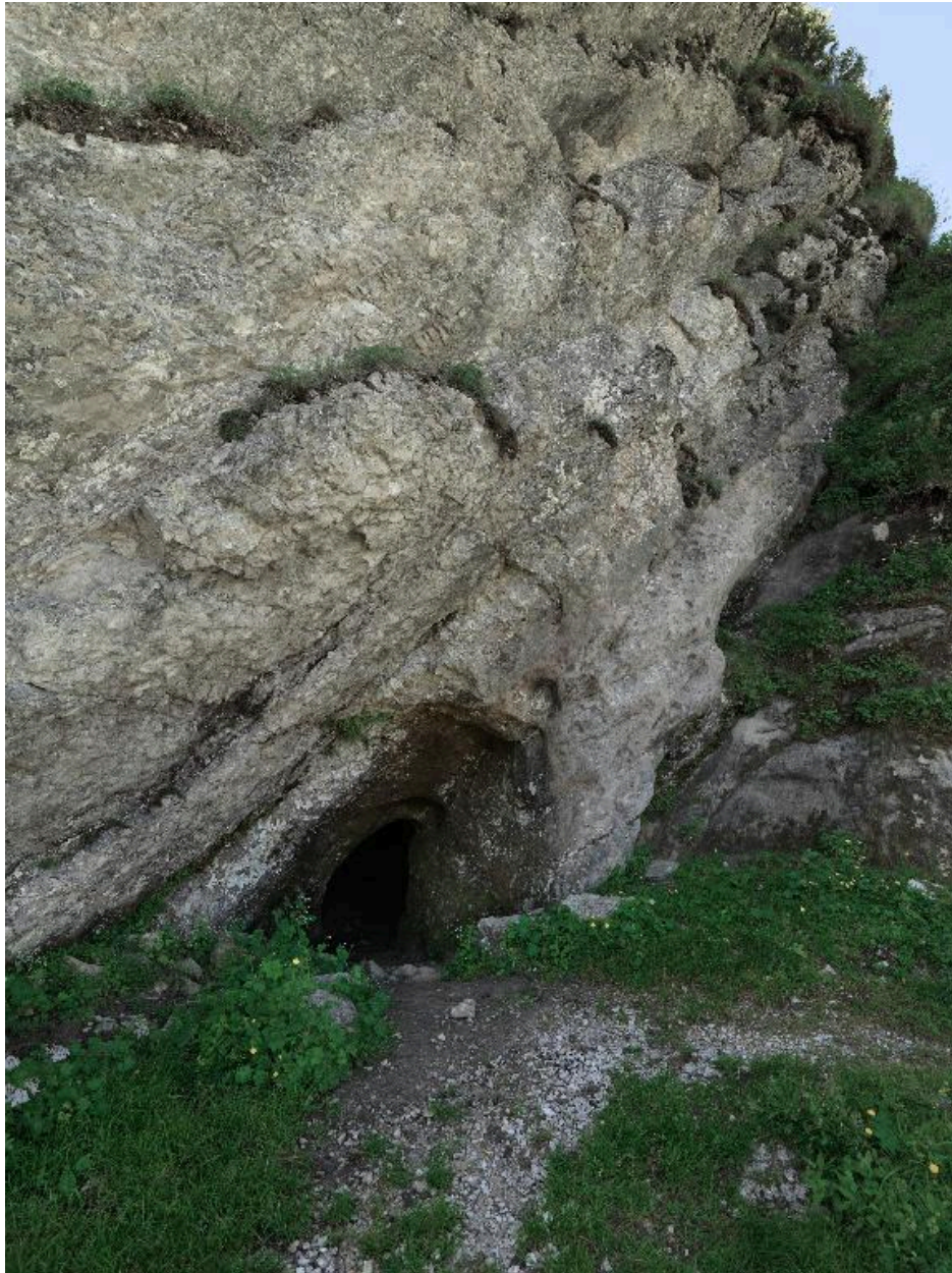
Vue de l'entrée de la grotte des Mineurs, sur l'alpage du Lac (montagne du Colombier).