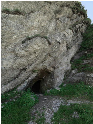
Vue de l'entrée de la grotte des Mineurs, sur l'alpage du Lac (montagne du Colombier).