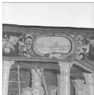
Détail de la bordure ornée d'un cartouche avec paysage. IVR82_20024202114X