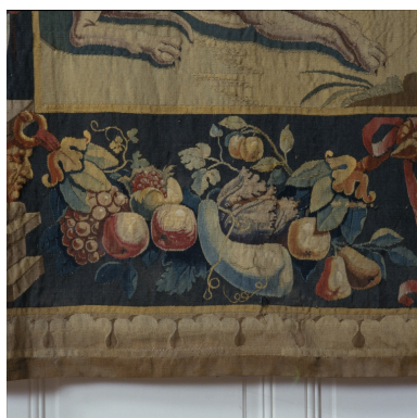
Détail de la bordure ornée de fruits et de légumes. IVR82_20024202111XA