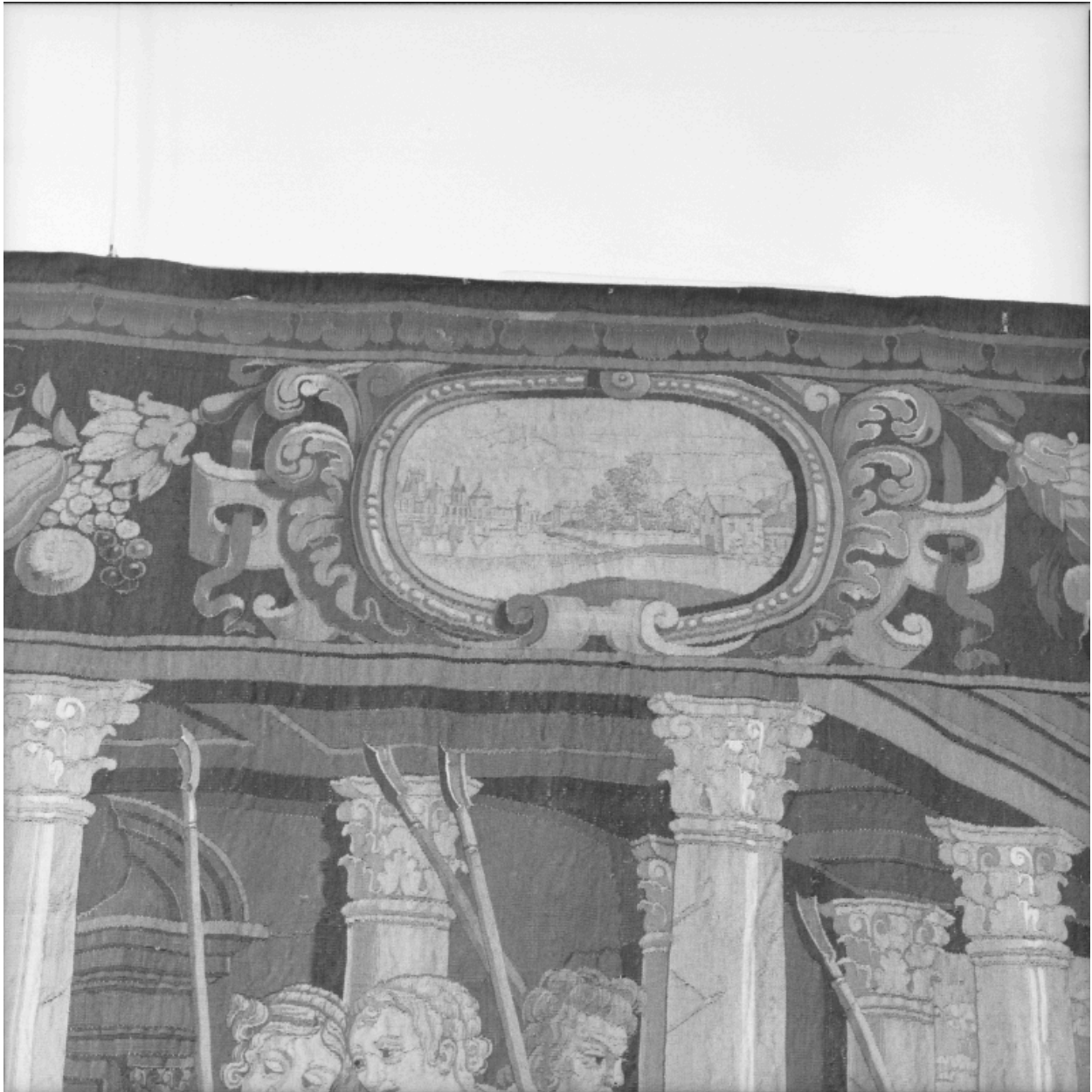
Détail de la bordure ornée d'un cartouche avec paysage.