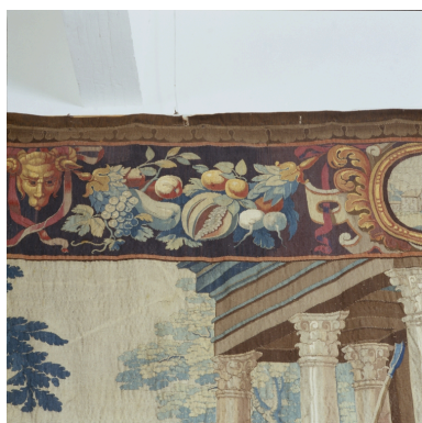
Détail de la bordure ornée de fruits et de légumes.