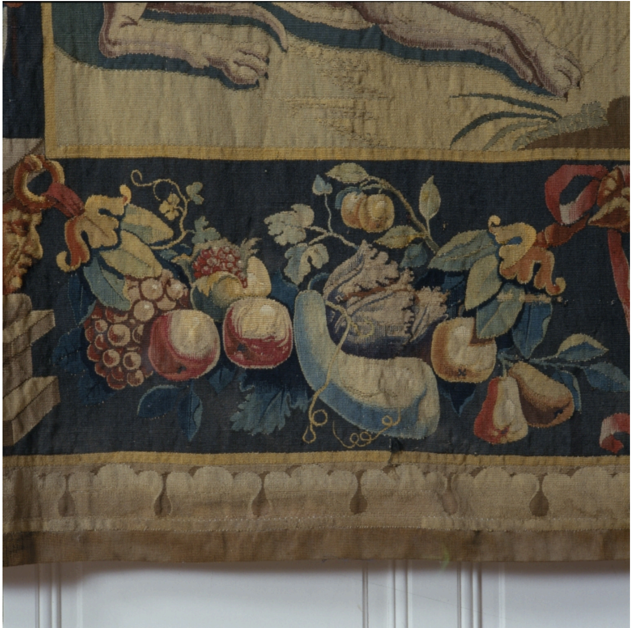
Détail de la bordure ornée de fruits et de légumes.