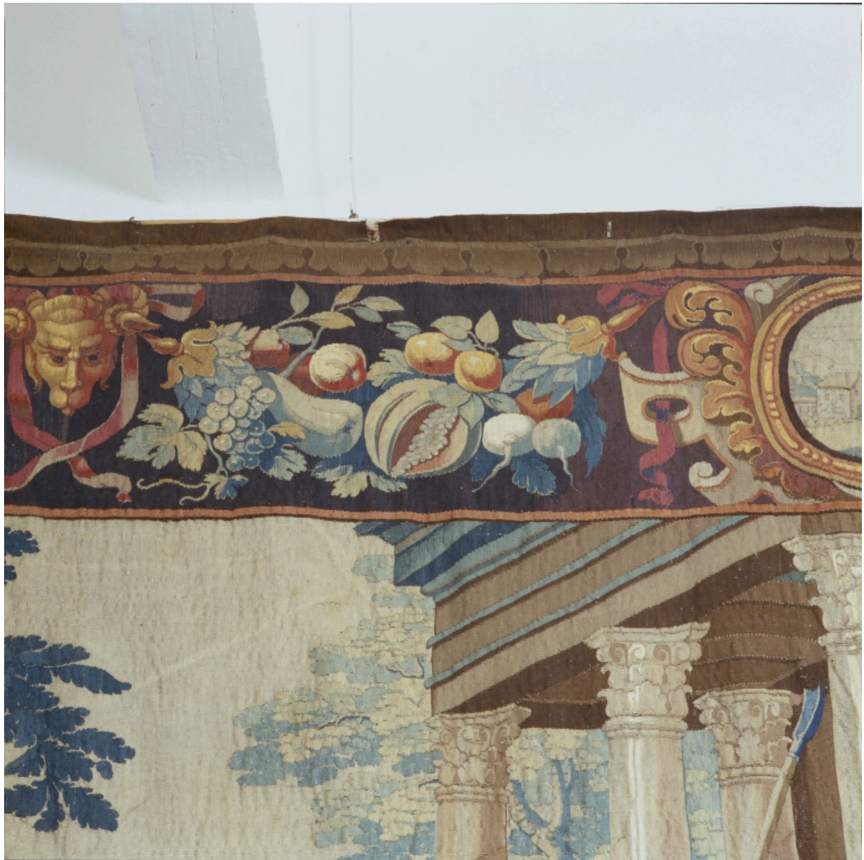
Détail de la bordure ornée de fruits et de légumes.