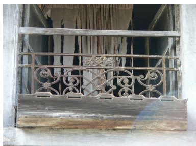
Garde corps IVR82_20093800366NUCA