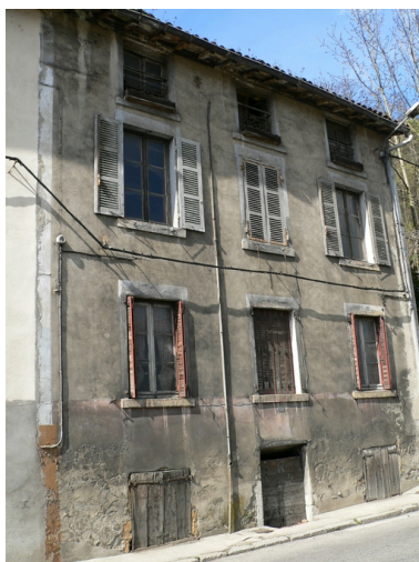
Façade sur rue IVR82_20093800367NUCA