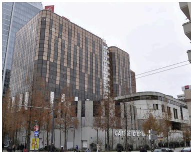
Vue générale depuis le nord-est IVR82_20156902715NUCA