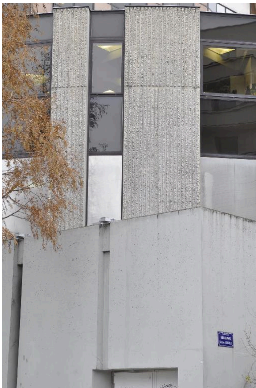
Détail des deux niveaux du socle en béton