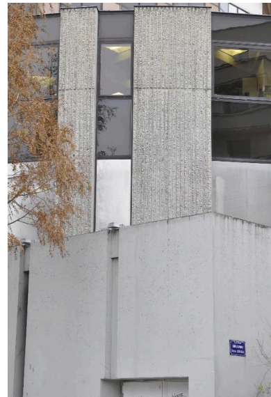
Détail des deux niveaux du socle en béton IVR82_20156902697NUCA