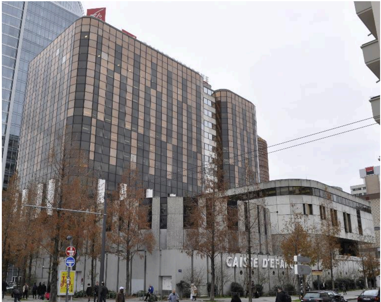
Vue générale depuis le nord-est