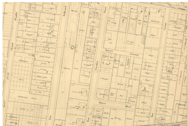
Plan parcellaire de Lyon 1938 (4S/222) IVR84_20256902133NUCA