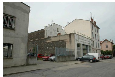
Façade nord impasse Morel