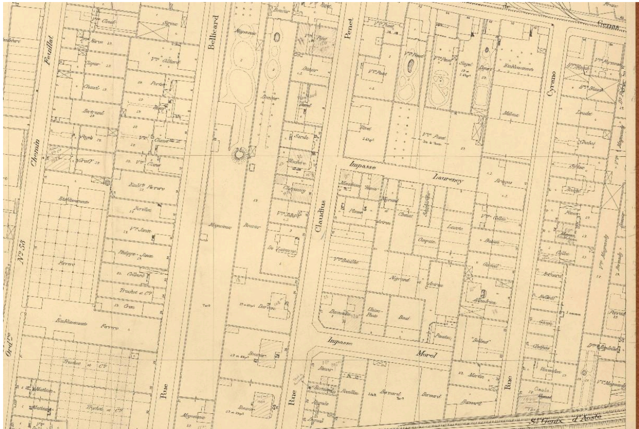
Plan parcellaire de Lyon 1938 (4S/222)