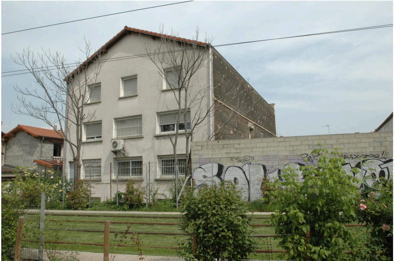
Vue principale du site en alignement sur l'ancienne voie ferrée de l'Est