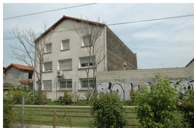
Vue principale du site en alignement sur l'ancienne voie ferrée de l'Est IVR84_20186901430NUCA