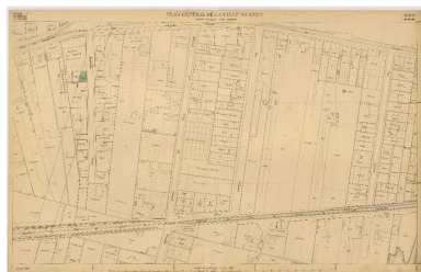
Plan parcellaire de Lyon 1913 (4S/222) IVR84_20256902135NUCA