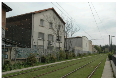
Vue ouest