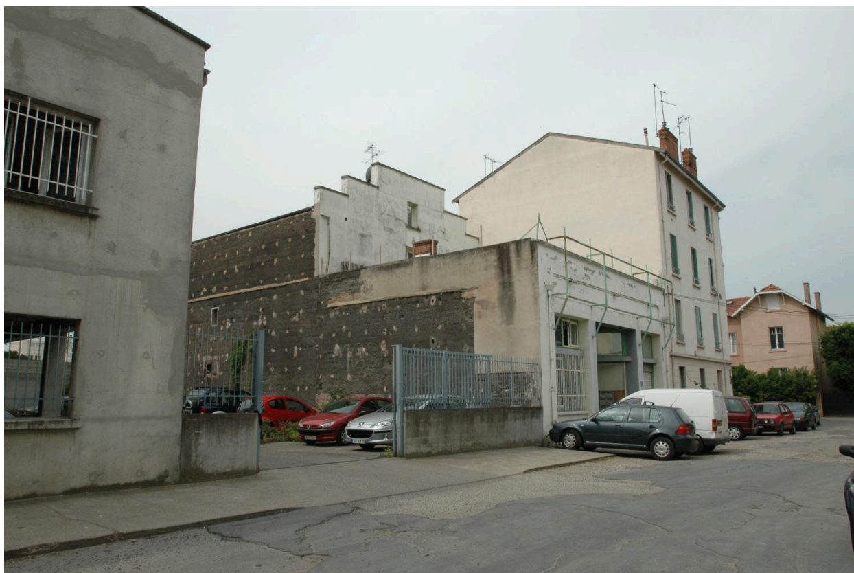
Façade nord impasse Morel