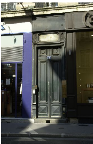
Façade, porte IVR82_20046905809NUCA