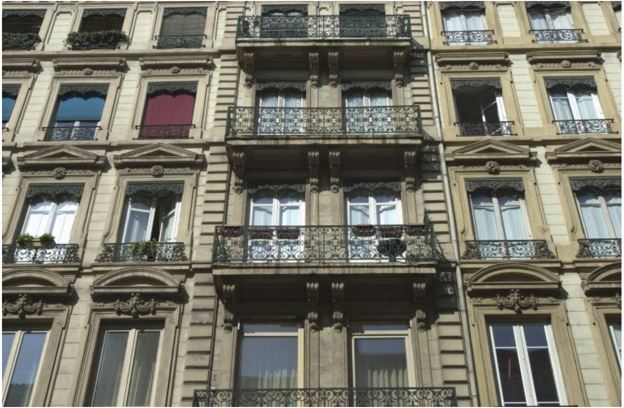
Façade, détail des travées de droite