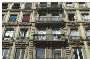
Façade, détail des travées de droite