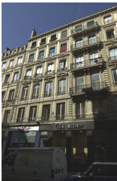
Façade