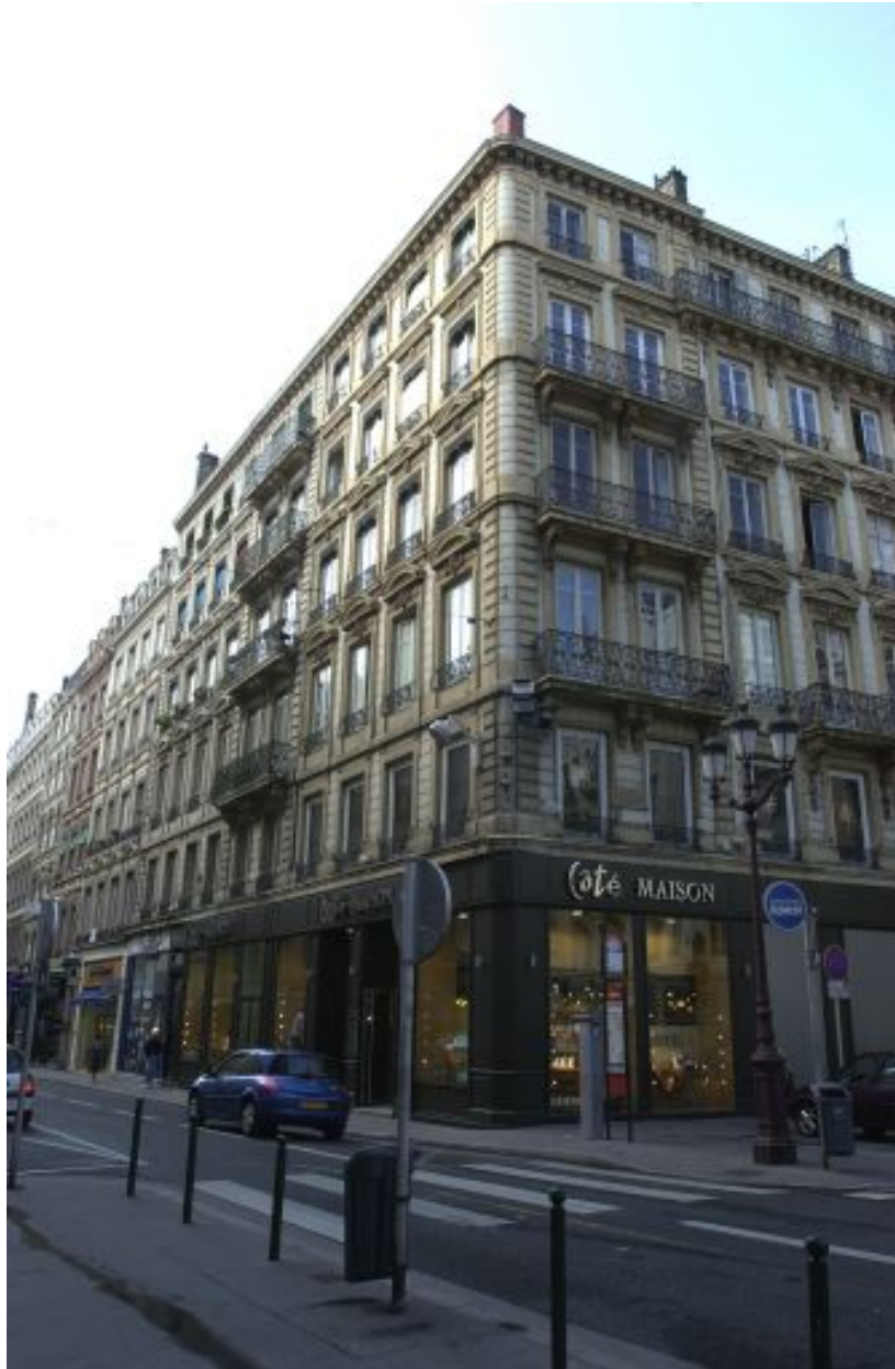
Vue générale avec la façade en rapport