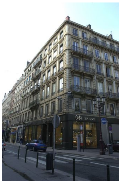
Vue générale avec la façade en rapport