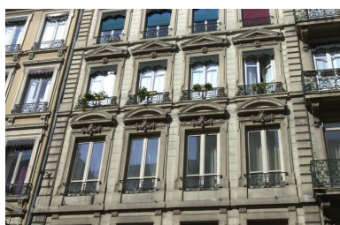
Façade, travées de gauche, 3e et 4e niveaux IVR82_20046905808NUCA