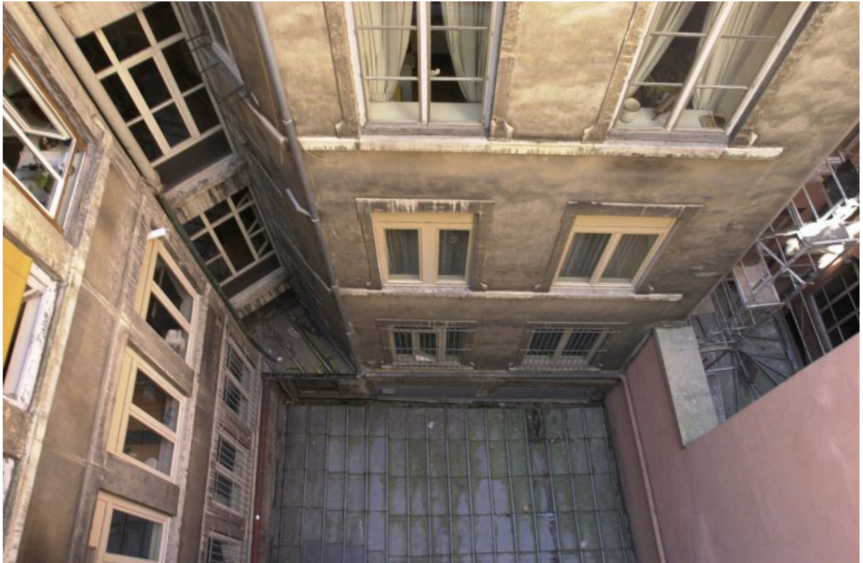
Cour vue depuis l'immeuble mitoyen