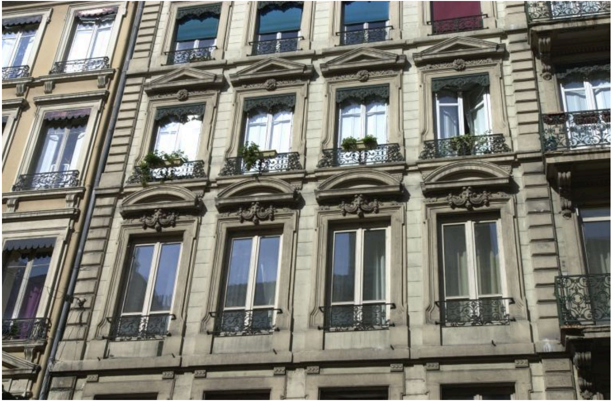
Façade, travées de gauche, 3e et 4e niveaux