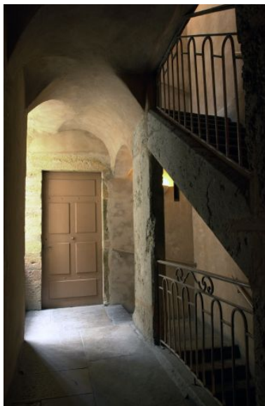
Escalier, palier du 3e étage IVR82_20046900357NUCA