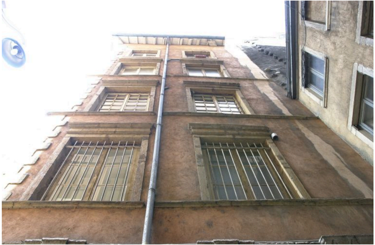
Façade principale sur la cour commune