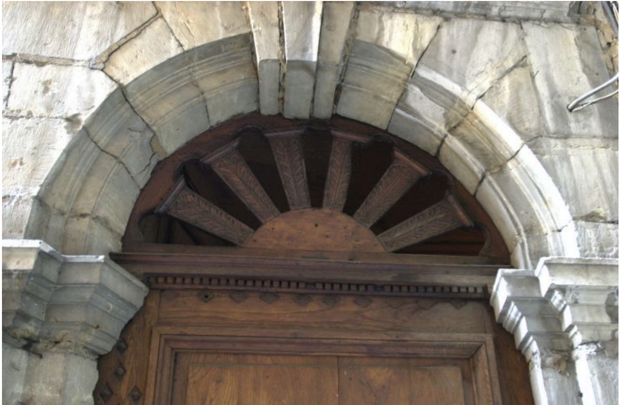
Façade principale, porte, détail du tympan de menuiserie