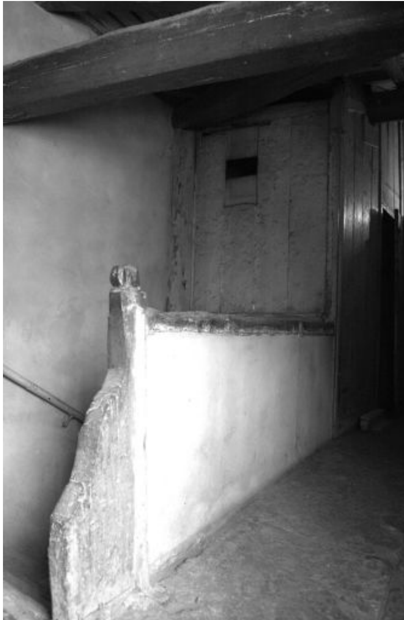
Escalier, palier du dernier étage