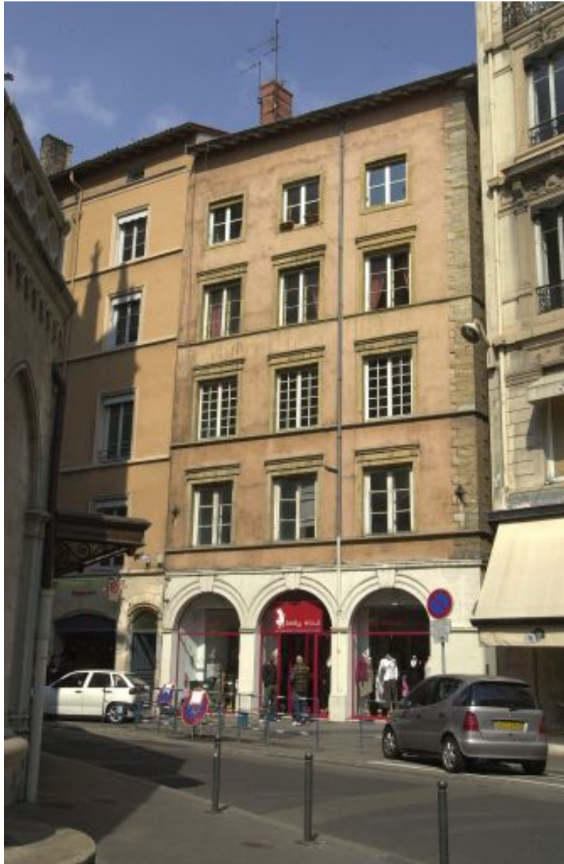
Vue générale de la façade sur la rue de la Fromagerie