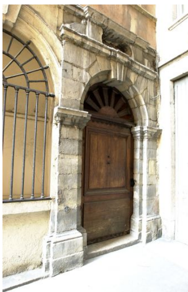
Façade principale, porte IVR82_20046900354NUCA