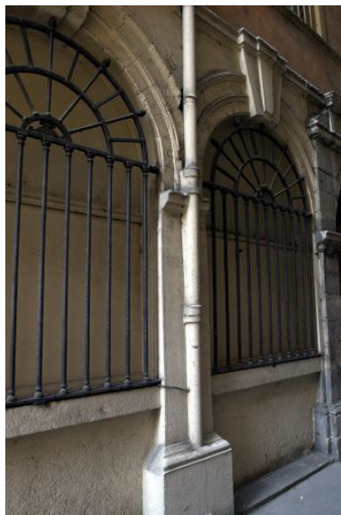
Façade principale, anciennes ouvertures de boutique IVR82_20046900356NUCA