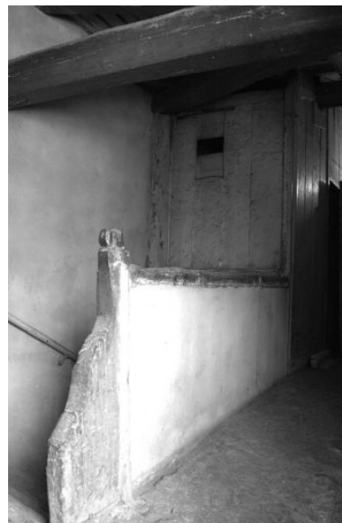
Escalier, palier du dernier étage IVR82_20046900358NUC