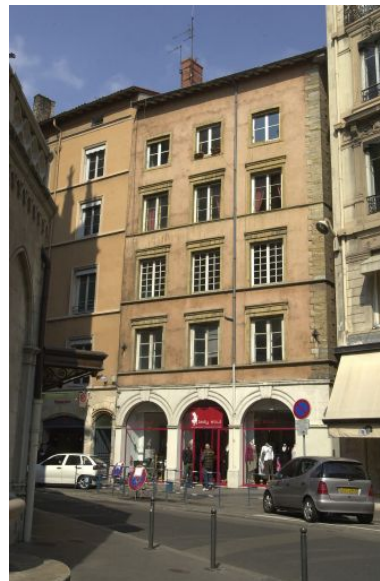
Vue générale de la façade sur la rue de la Fromagerie IVR82_20046900352NUCA