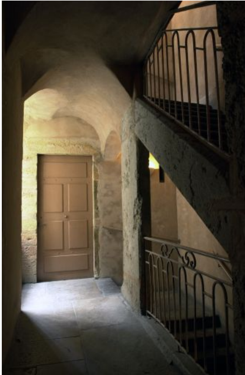
Escalier, palier du 3e étage