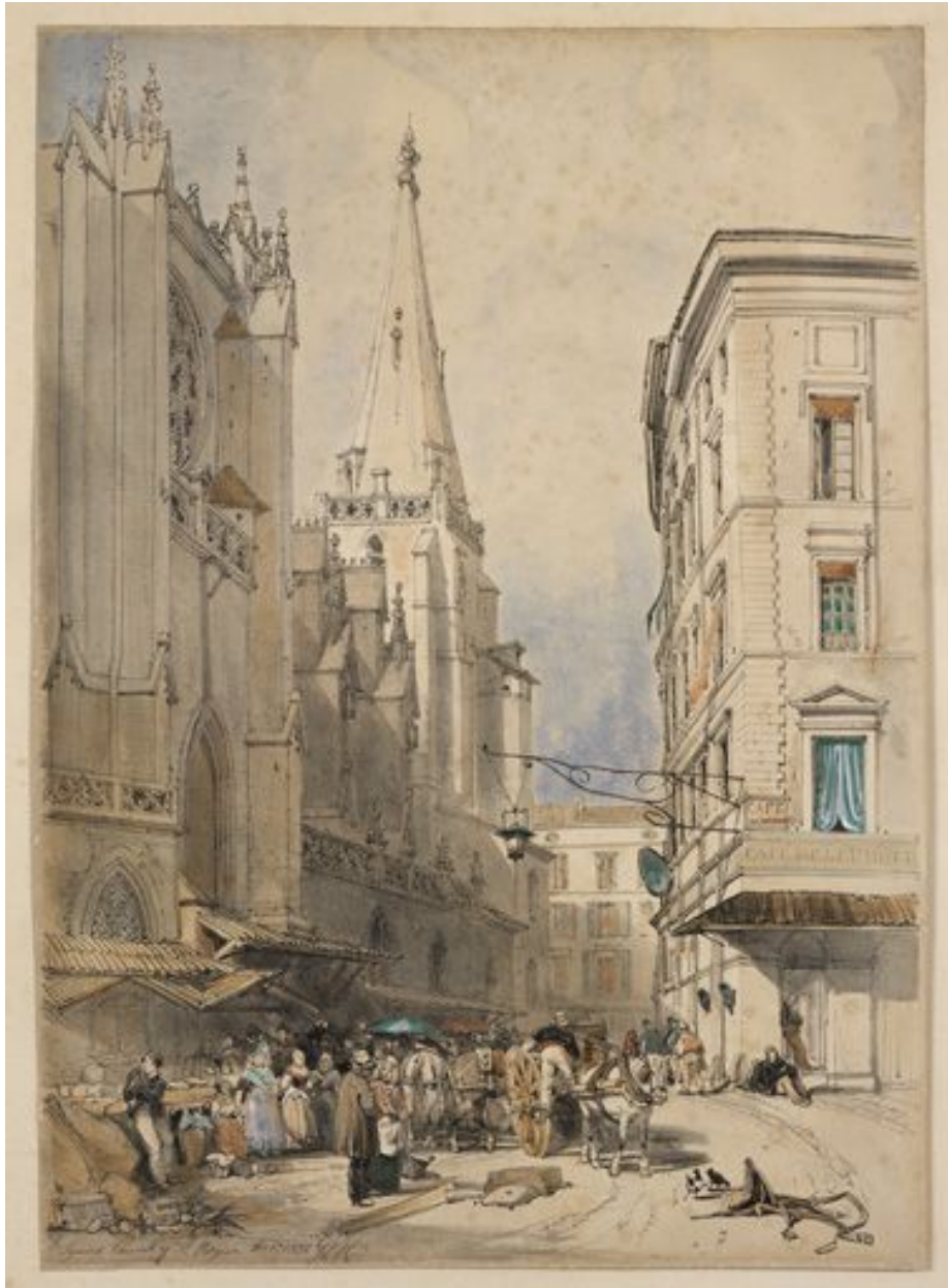
Lyons Church of St Nizier [vue générale de l'immeuble à droite], lithographie par James Duffield Harding, 1832