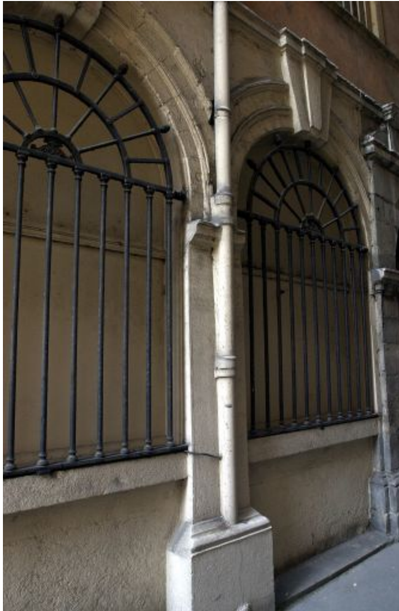
Façade principale, anciennes ouvertures de boutique