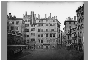
Ouverture de la rue de l'Impératrice (...) vue avant travaux (à gauche, immeuble 9, rue de la Fromagerie), ca 1860