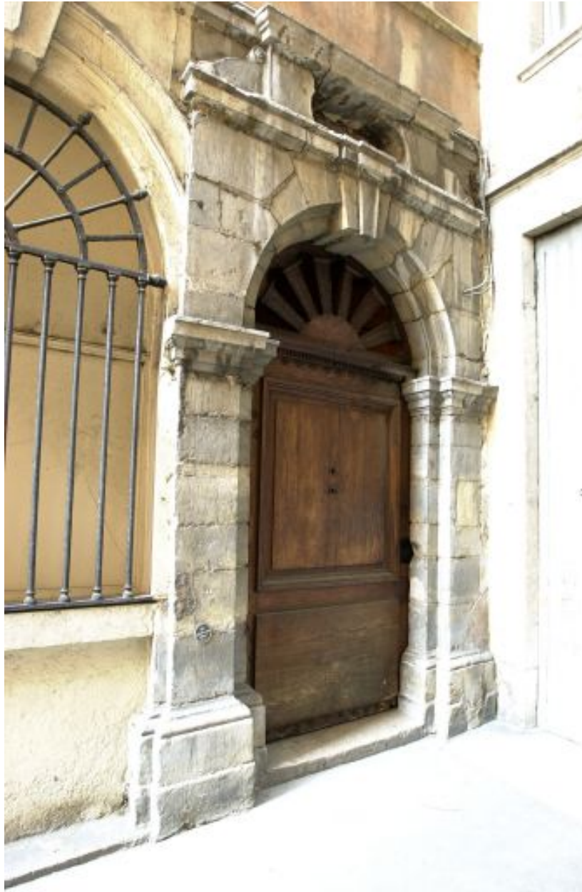
Façade principale, porte