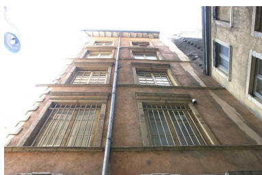
Façade principale sur la cour commune IVR82_20046900353NUCA