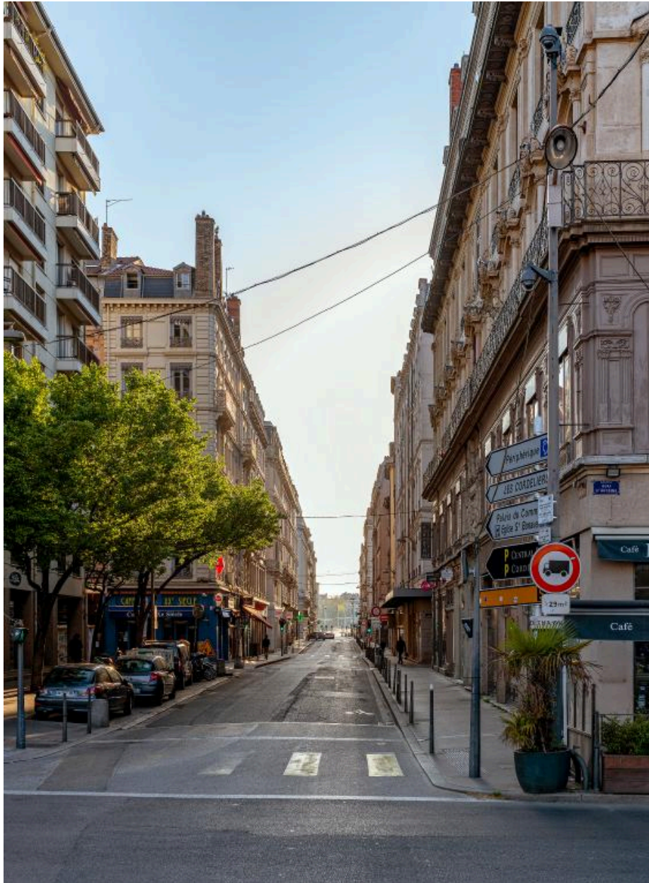
Vue générale depuis l'ouest et le quai Saint-Antoine