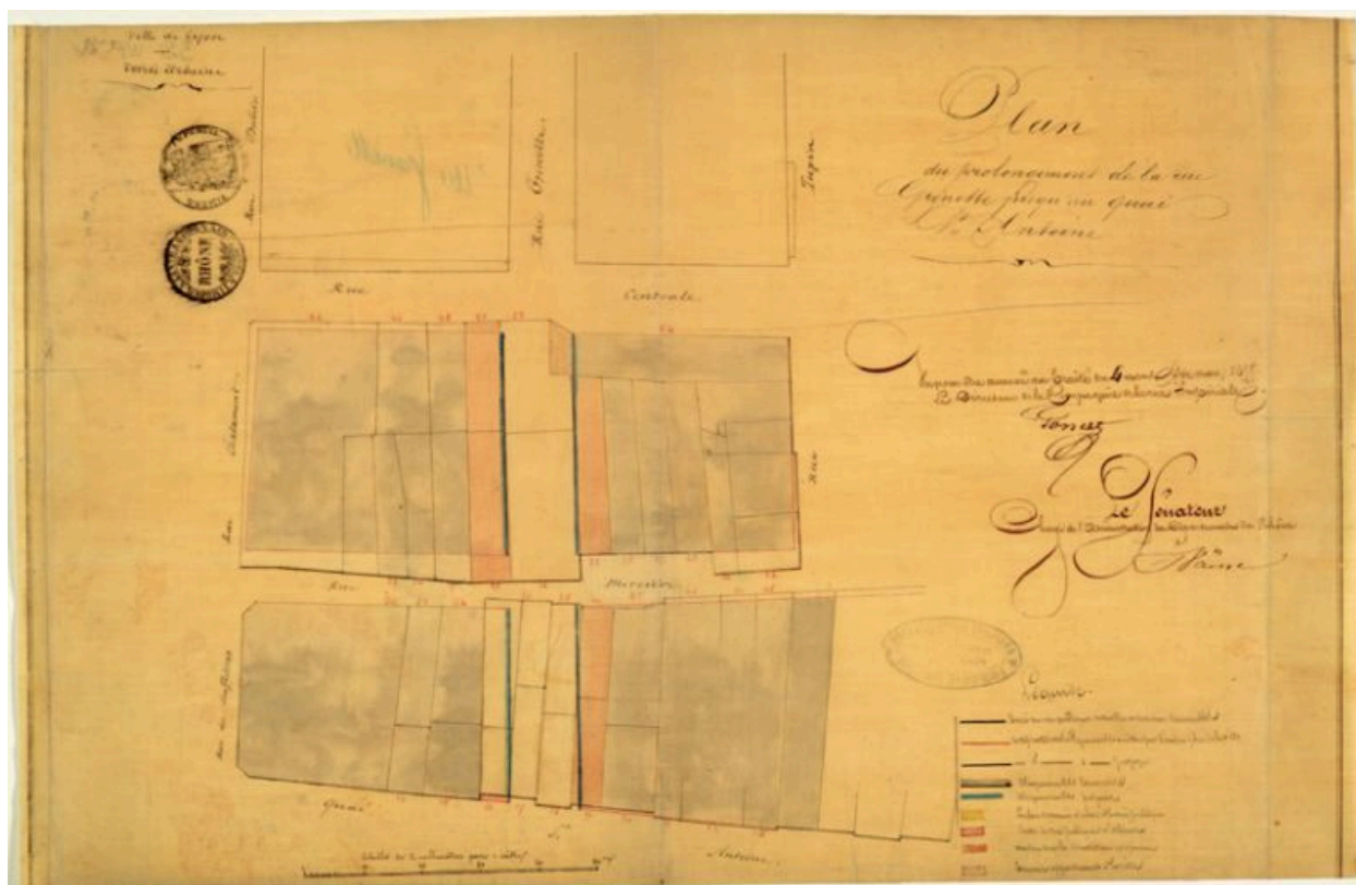
Plan du prolongement de la rue Grenette jusqu'au quai Saint-Antoine, 1855