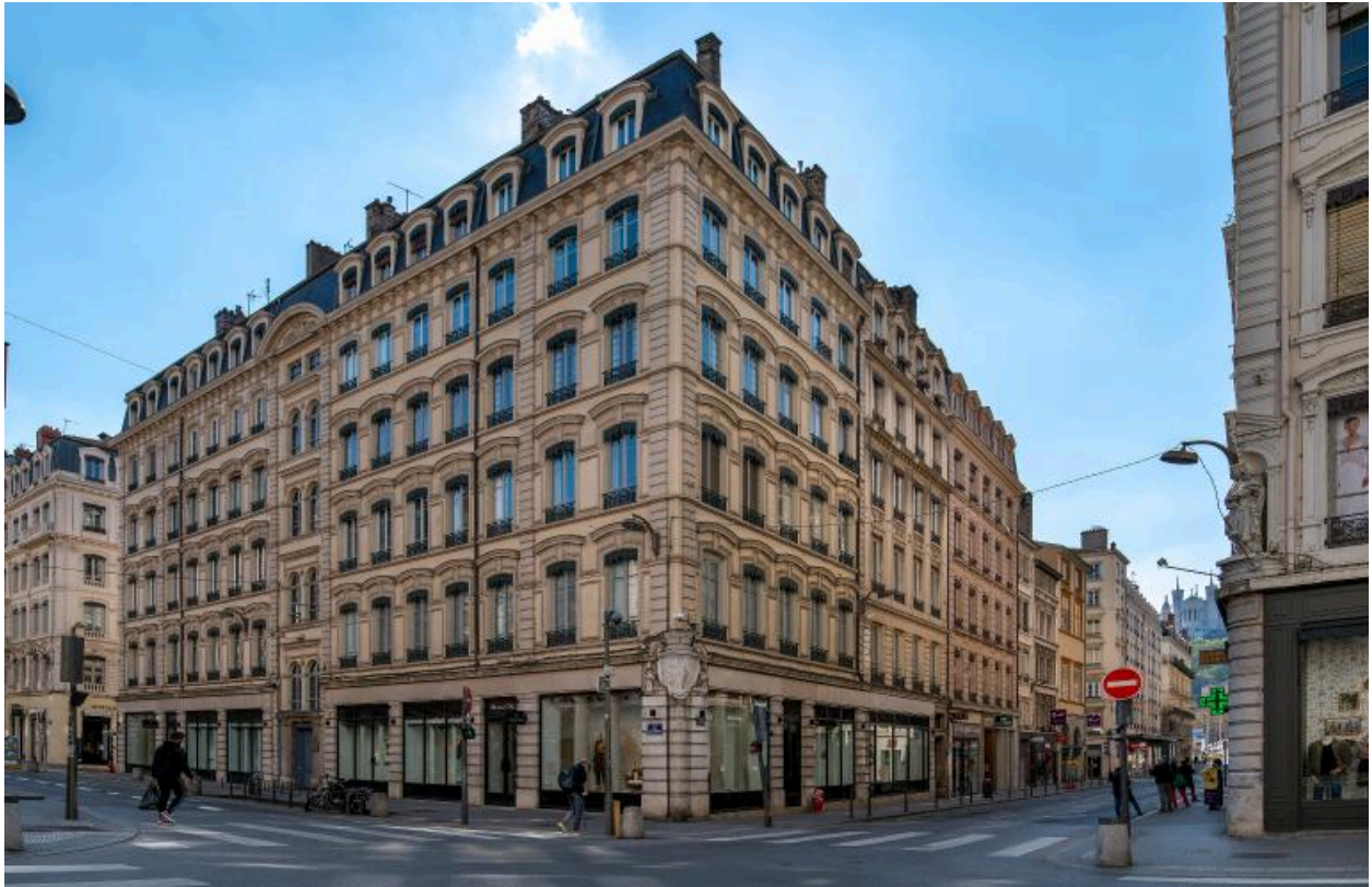
Vue vers l'ouest depuis la rue du Président-Edouard-Herriot