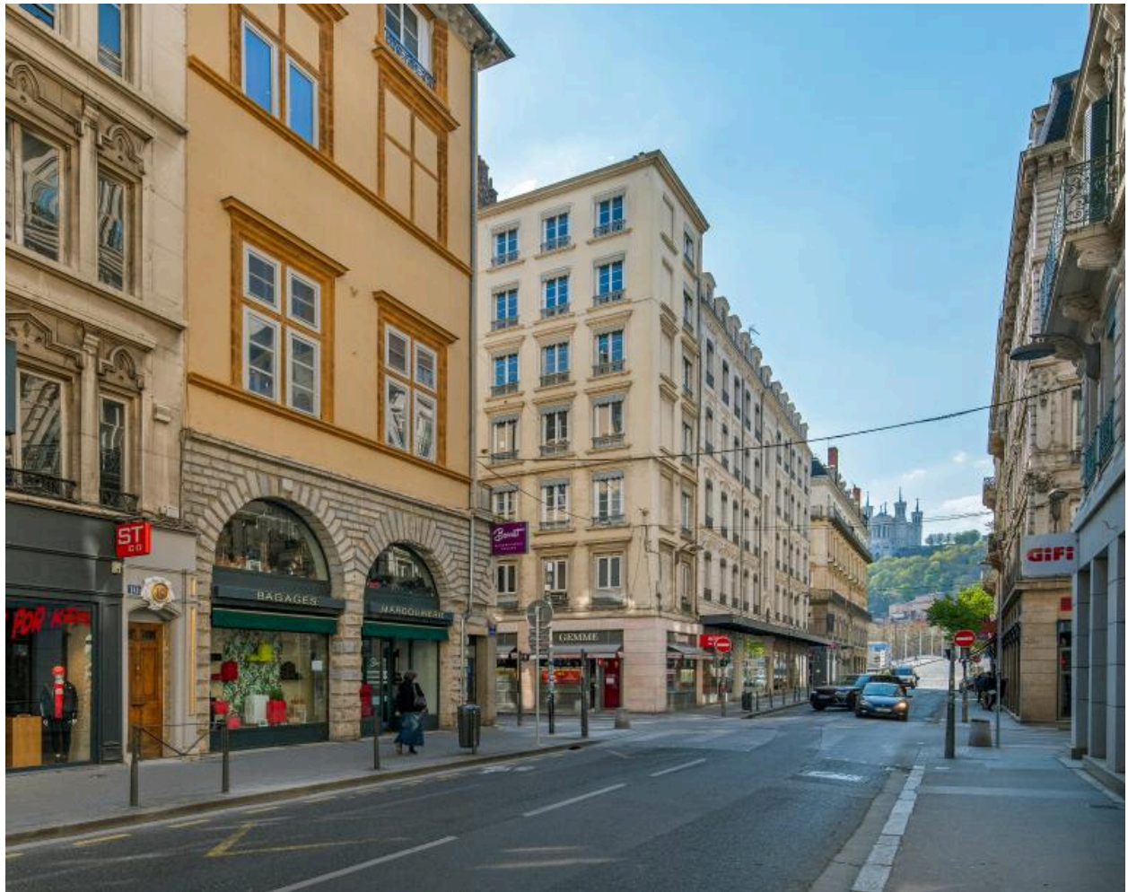
Vue depuis le n° 11 vers l'ouest