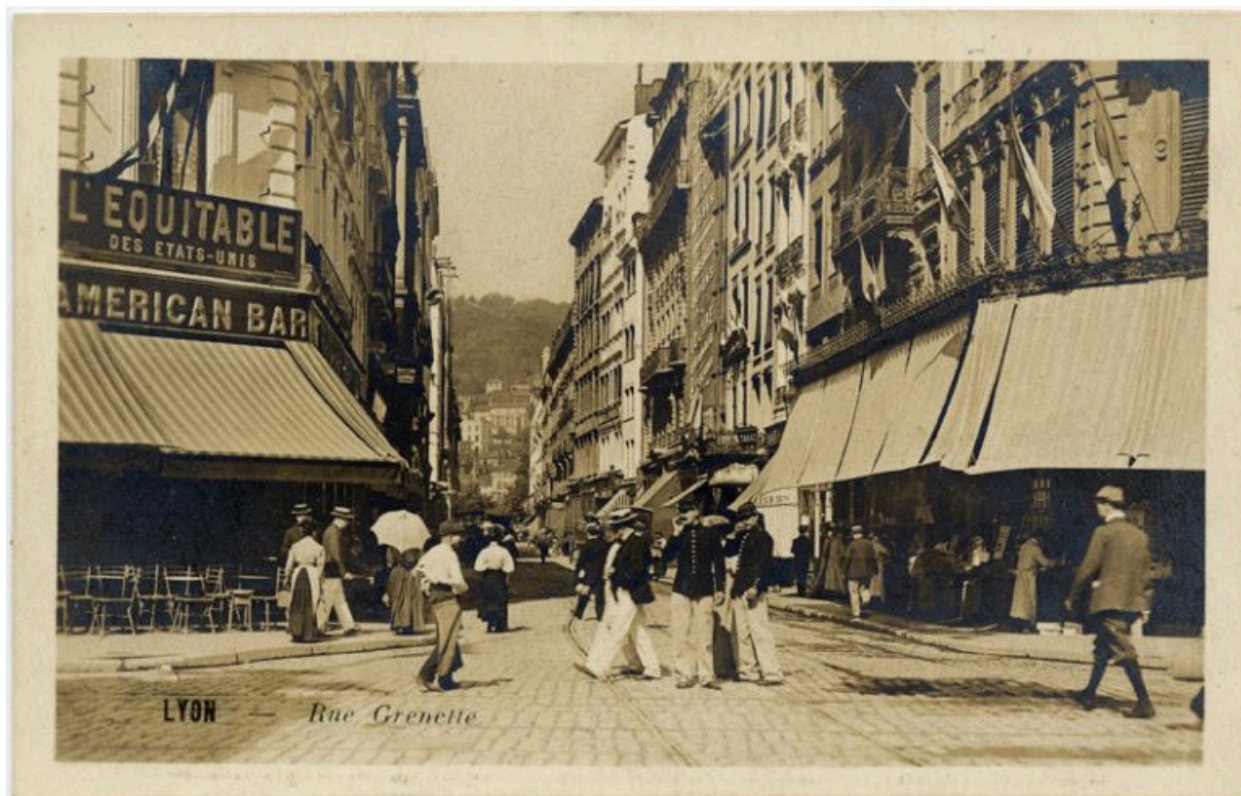
Lyon. Rue Grenette [vue depuis la rue de la République en direction de la Saône], carte postale, ca 1900