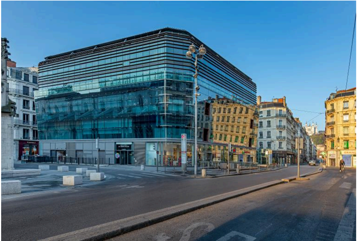
Vue générale depuis l'est et la place des Cordeliers