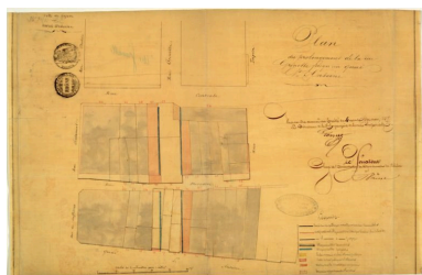
Plan du prolongement de la rue Grenette jusqu'au quai Saint-Antoine, 1855 IVR82_20056900432NUCA