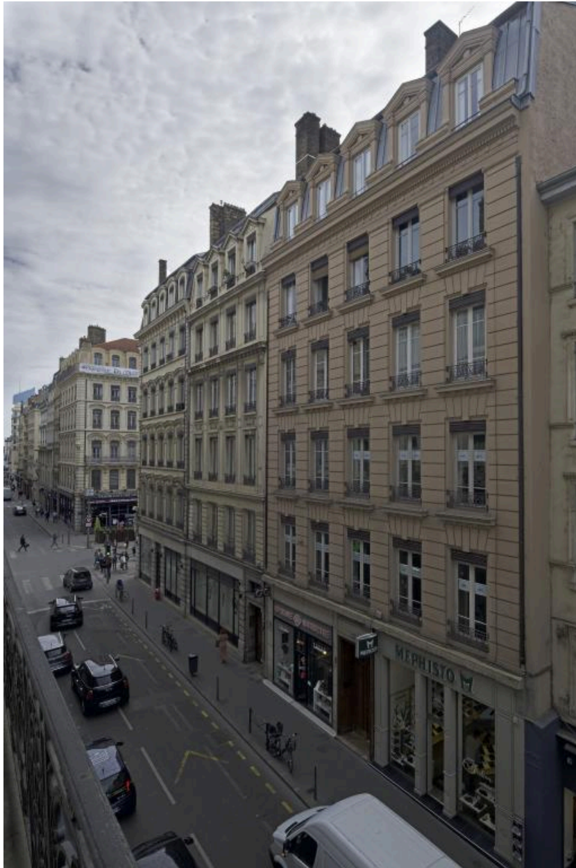
Vue de la rive sud vers l'est à partir du numéro 14