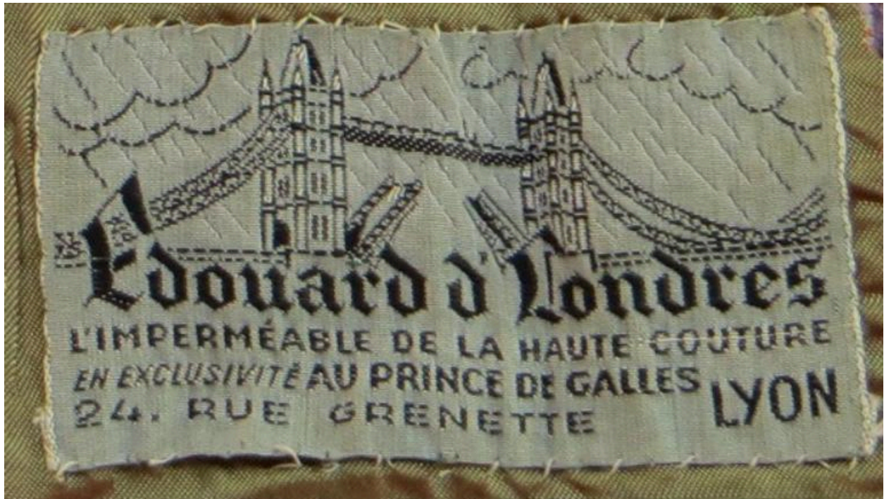
Etiquette d'un magasin de vêtements de luxe, 24 rue Grenette, milieu du XXe siècle