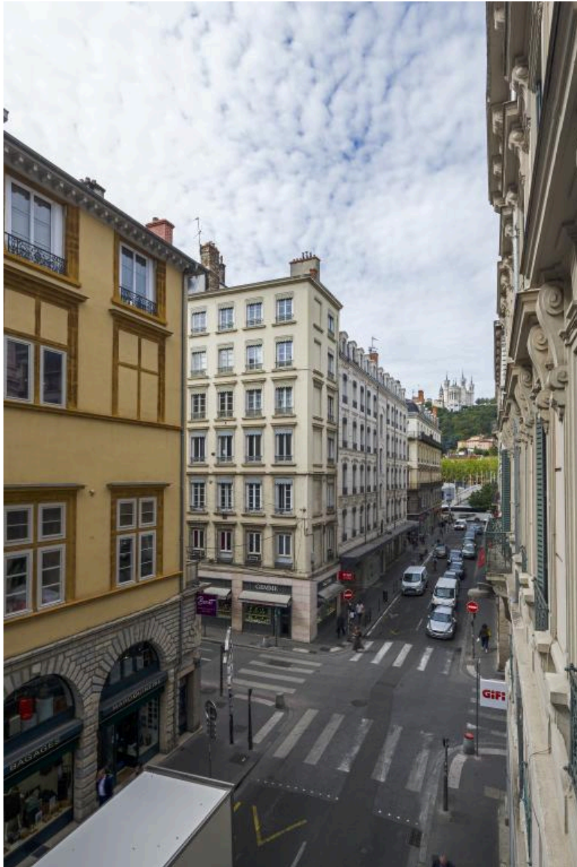
Vue vers l'ouest depuis l'intersection avec la rue de Brest. A gauche, au premier plan, la halle de la Grenette. Au fond, la basilique Notre-Dame de Fourvière