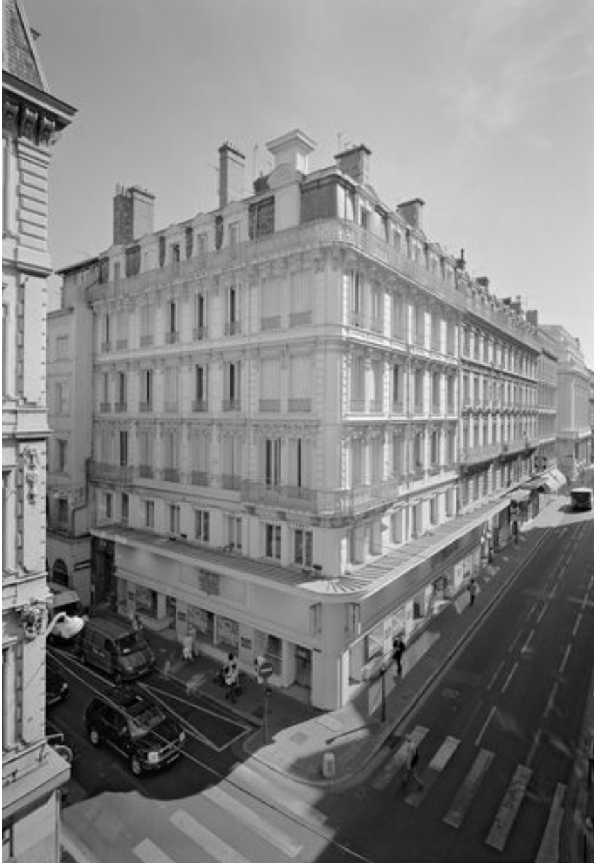
Vue de la portion entre la rue de Brest (au premier plan) et celle du Président-Edouard-Herriot