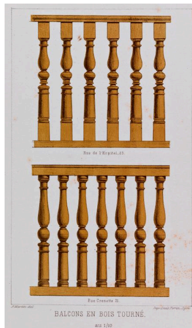
BALCONS EN BOIS TOURNÉ. au 1/50