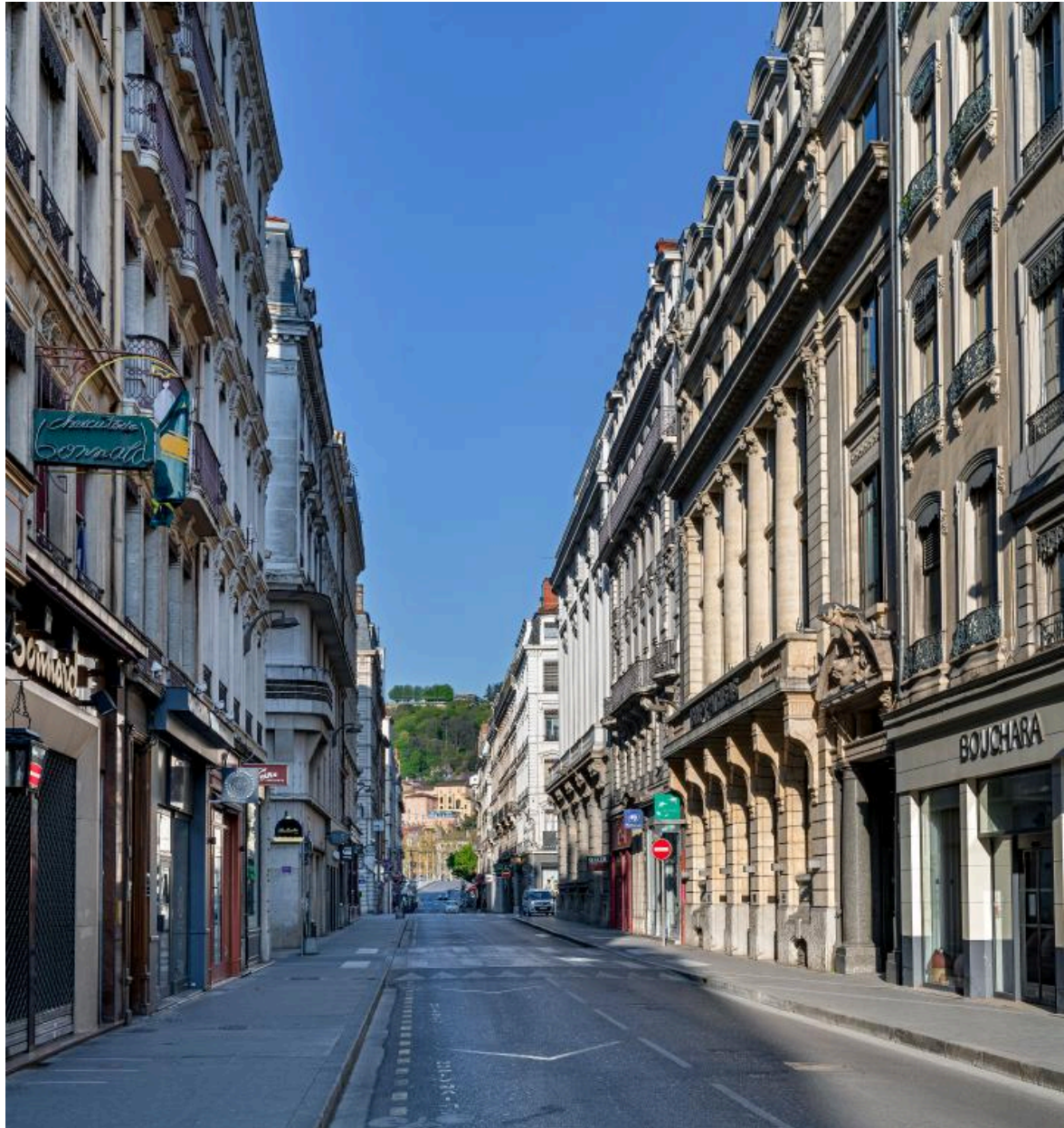
Vue depuis l'est, depuis le n° 43 rue Grenette