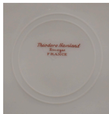
Détail - marque Haviland IVR84_20226302692NUC4A