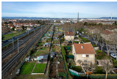
Jardins ouvriers RVI, à proximité de la cité ouvrière Berliet, Saint-Priest