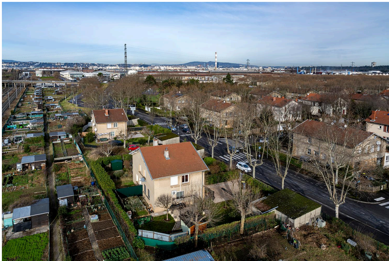
Jardins ouvriers RVI à proximité de la cité ouvrière Berliet, Saint-Priest