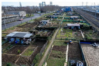
Vue d'ensemble des Jardins ouvriers RVI Saint-Priest