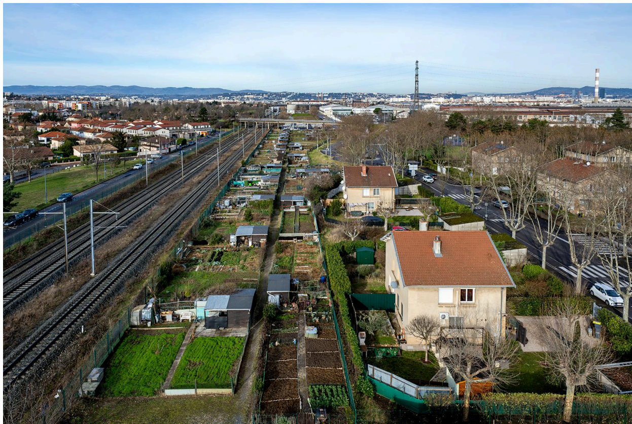
Jardins ouvriers RVI, à proximité de la cité ouvrière Berliet, Saint-Priest