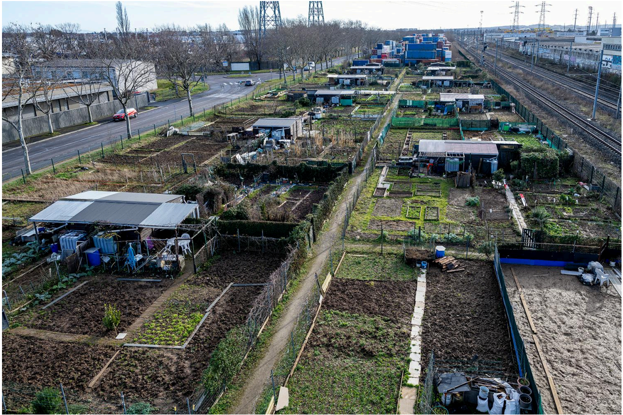
Vue d'ensemble des Jardins ouvriers RVI Saint-Priest