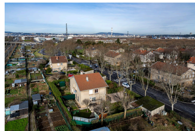
Jardins ouvriers RVI à proximité de la cité ouvrière Berliet, Saint-Priest