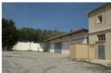
Entrepôts de la distillerie