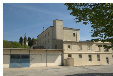
Vestiges de la chocolaterie et entrepôts IVR82_20102600494NUCA

Vue aérienne de l'abbaye. Sur la gauche, bâtiments industriels de la chocolaterie puis de la distillerie et entrepôts. IVR82_20002601283XE