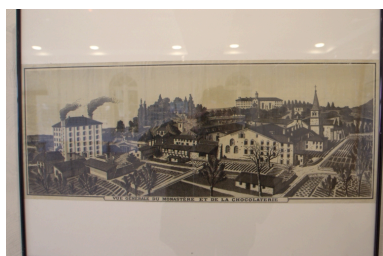
Vue générale du monastère et de la chocolaterie ; XIXe