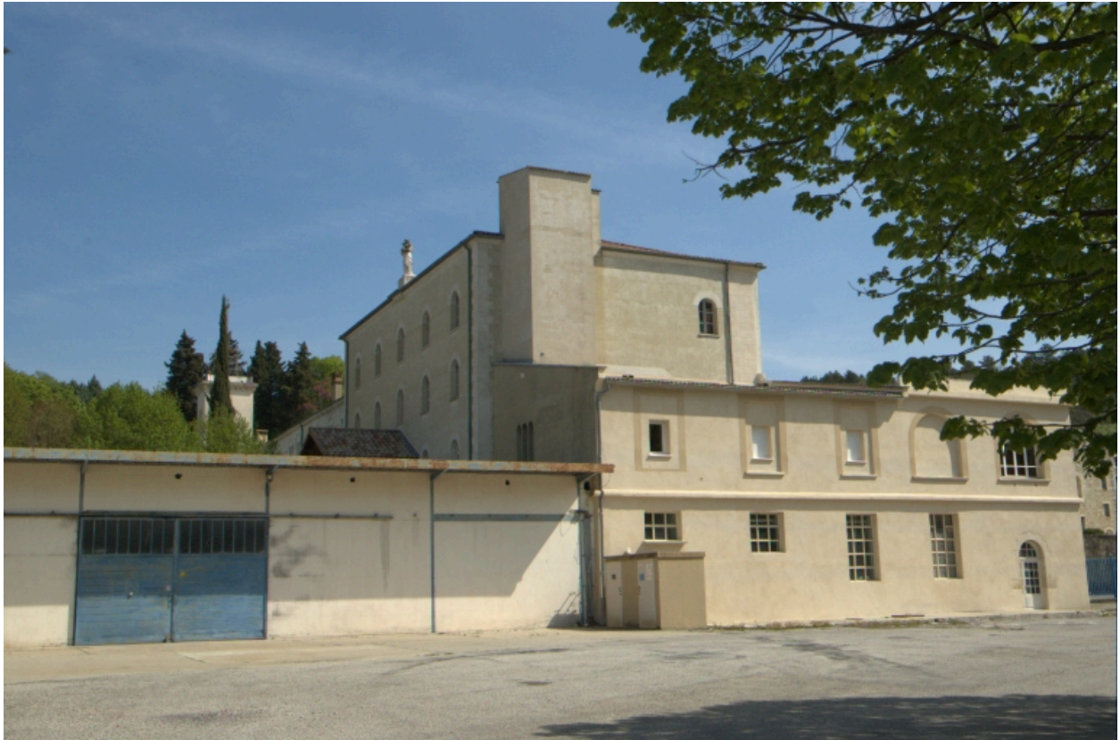
Vestiges de la chocolaterie et entrepôts