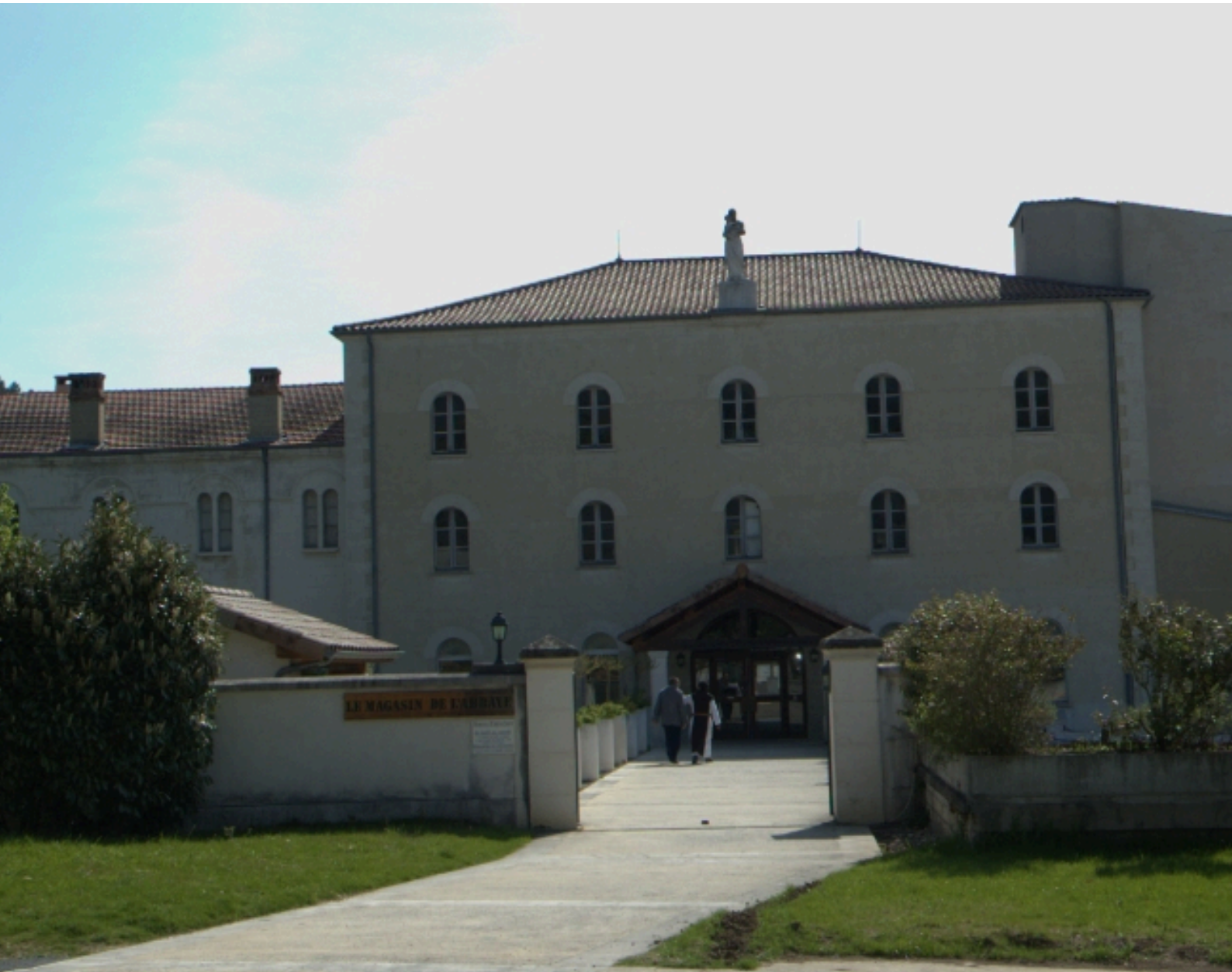
Vue depuis l'ouest de la chocolaterie.