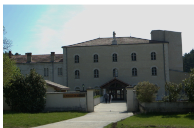
Vue depuis l'ouest de la chocolaterie.

siècle, Lithographie, (A.Privées Abbaye d'Aiguebelle) Phot. Geneviève Jourdan IVR82_20102600497NUCA