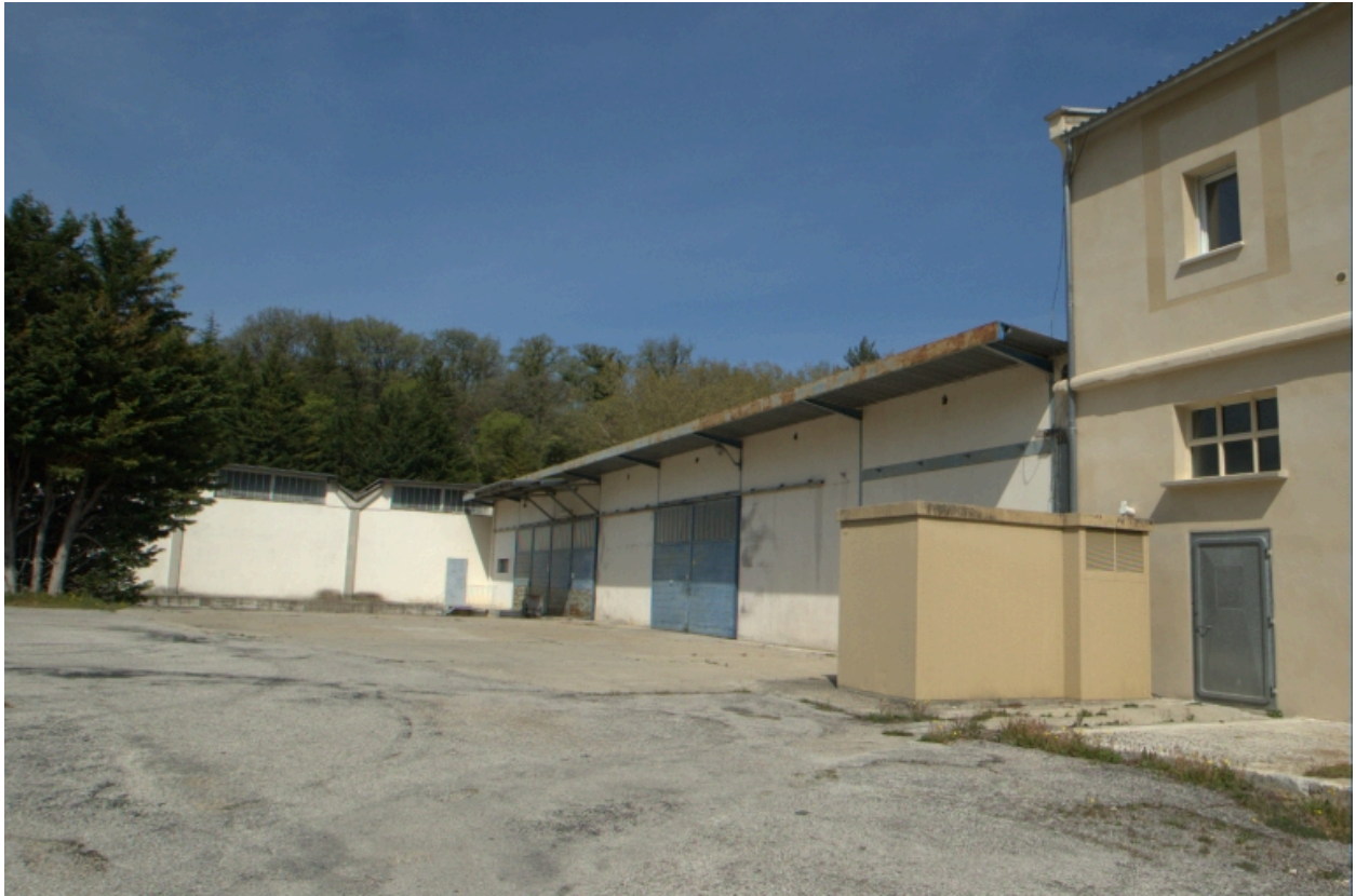
Entrepôts de la distillerie