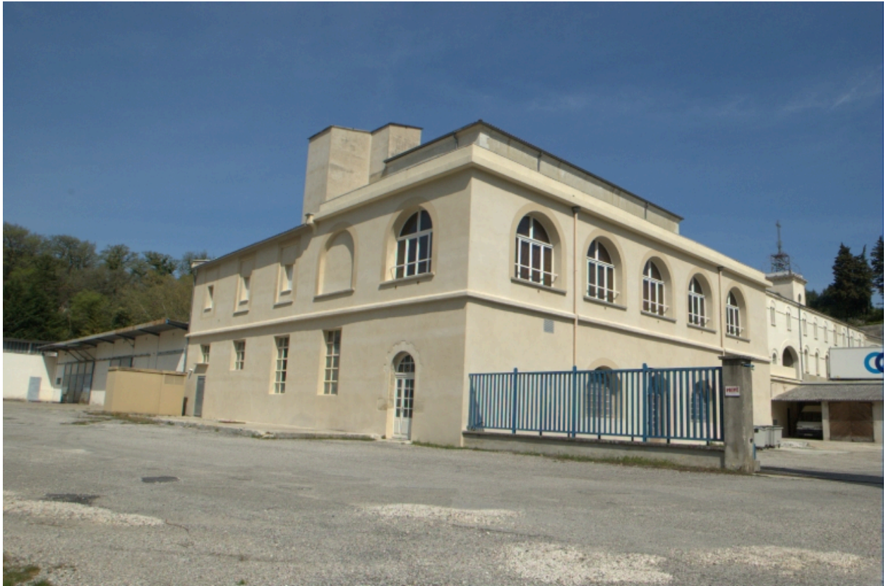
Vue depuis le sud de la chocolaterie.