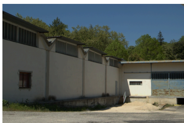
Quai de déchargement et entrepôts de la distillerie IVR82_20102600496NUCA