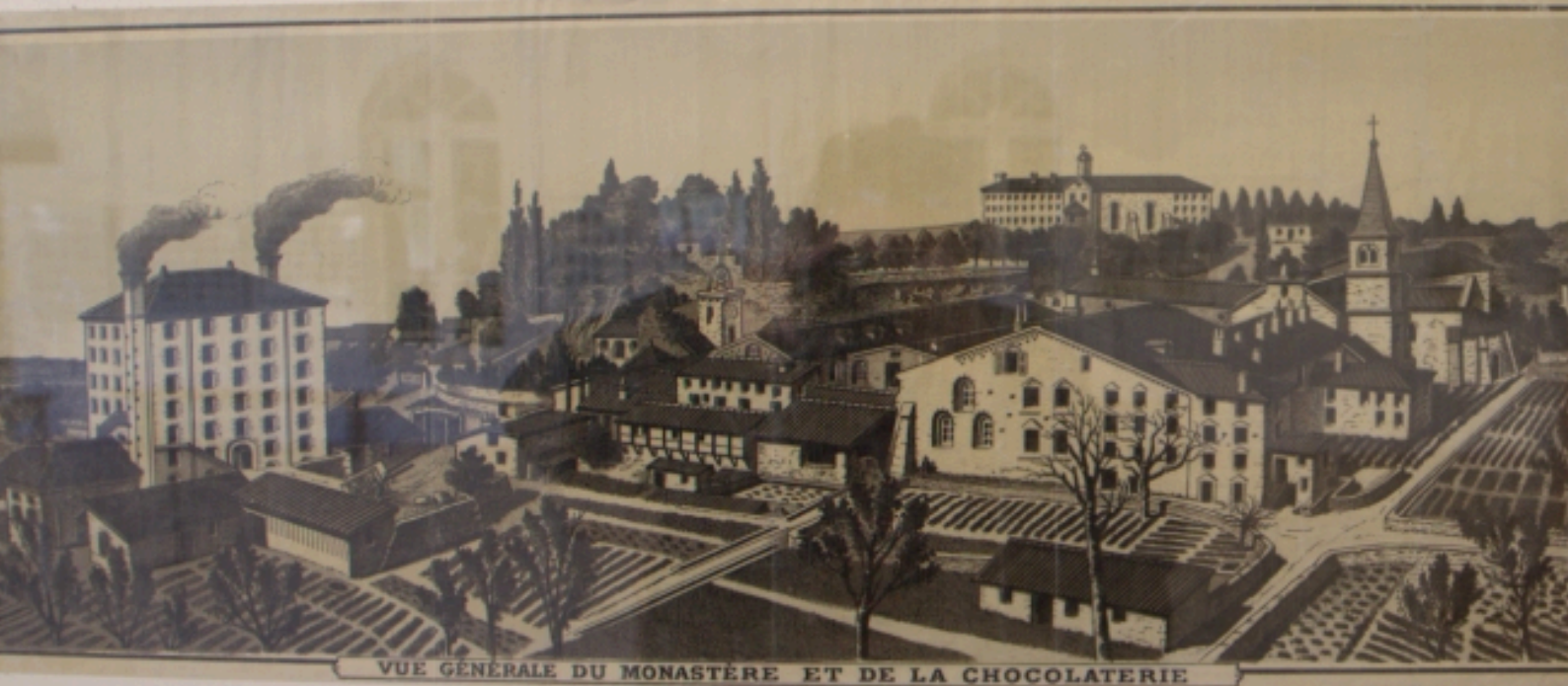
Vue générale du monastère et de la chocolaterie ; XIXe siècle, Lithographie