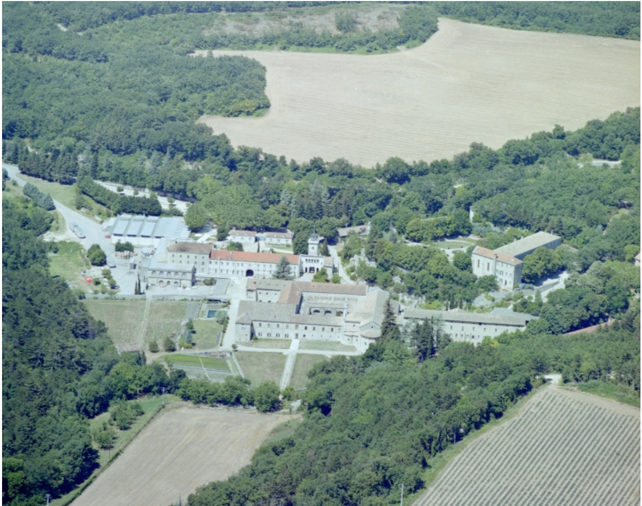
Vue aérienne de l'abbaye. Sur la gauche, bâtiments industriels de la chocolaterie puis de la distillerie et entrepôts.