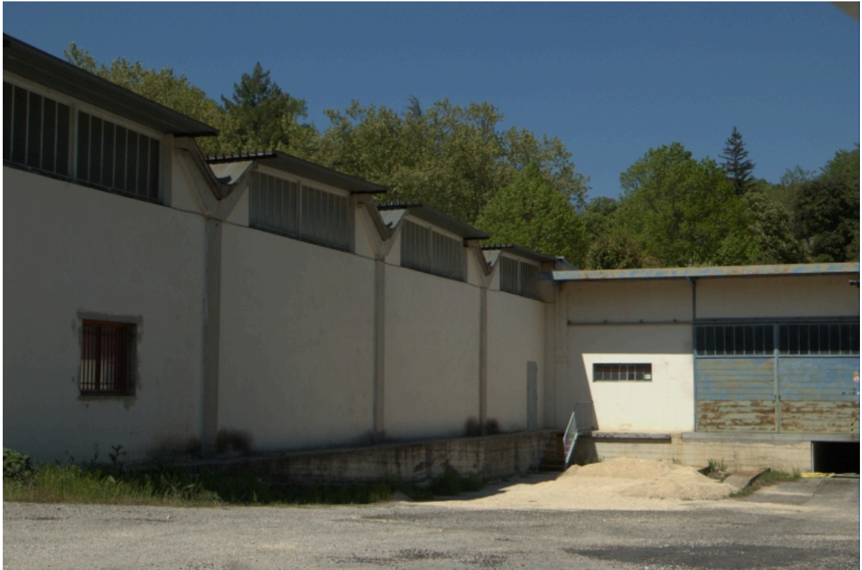
Quai de déchargement et entrepôts de la distillerie