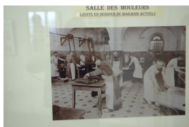
Fabrication du chocolat. Salle des mouleurs (à l'étage de soubassement).