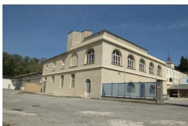
Vue depuis le sud de la chocolaterie.

Vue aérienne de l'abbaye. Sur la gauche, bâtiments industriels de la chocolaterie puis de la distillerie et entrepôts.