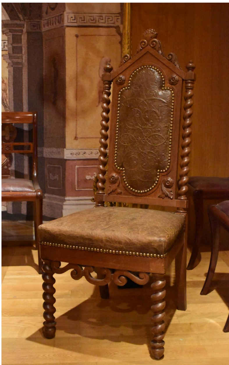
Vue d'une chaise de type n°2