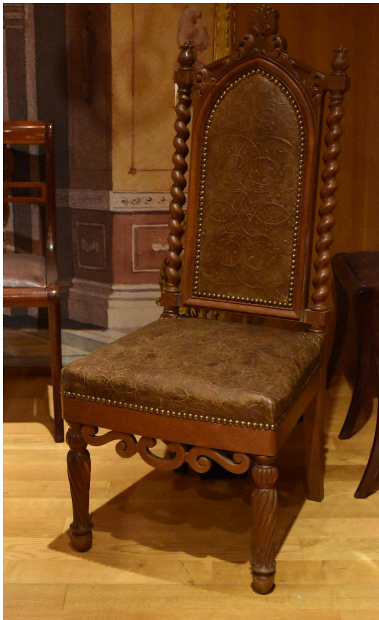
Vue générale de la chaise de type 1