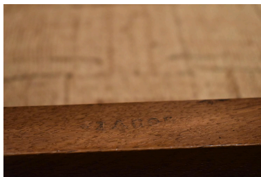
Estampille sur une chaise de type 1 IVR84_20216301423NUC4A