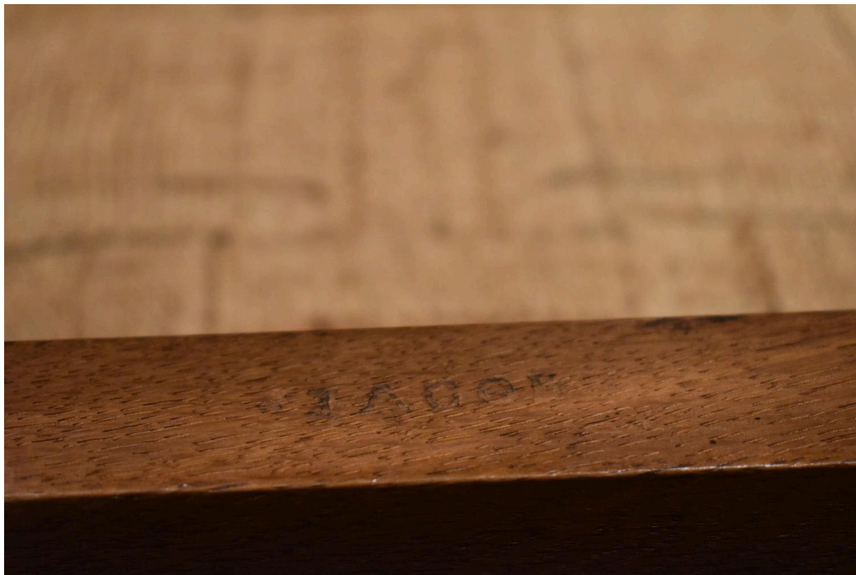
Estampille sur une chaise de type 1