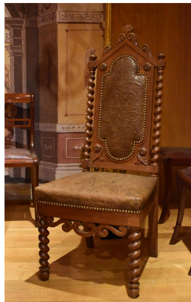
Vue d'une chaise de type n°2 IVR84_20216301419NUC4A