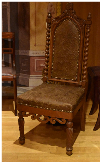
Vue générale de la chaise de type 1