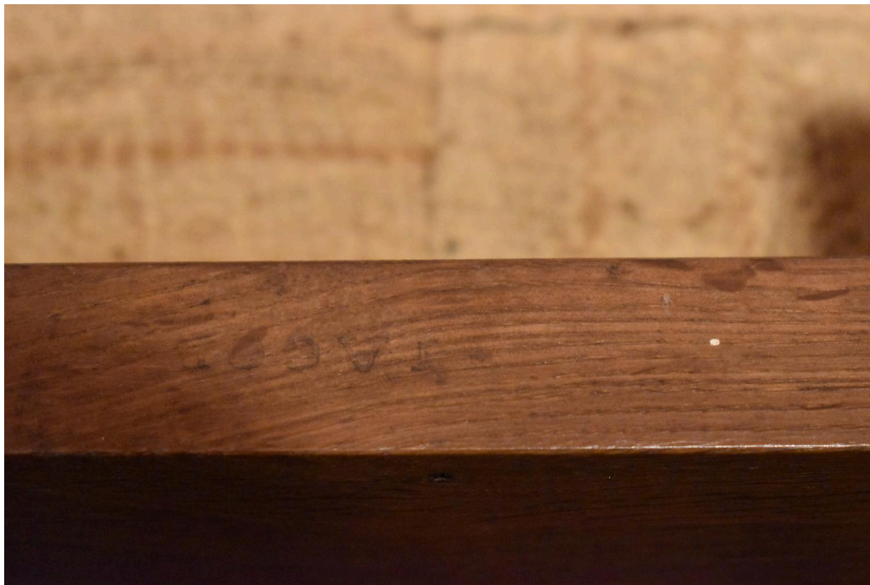
Vue de l'estampille de la chaise de type n°2