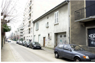
Vue générale IVR82_20016902884NUCA