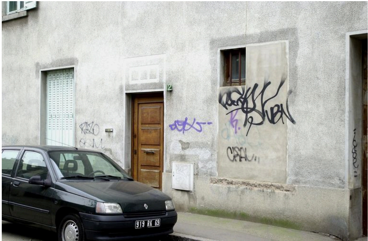
Détail de l'élévation antérieure