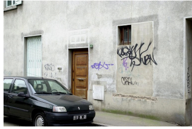
Détail de l'élévation antérieure IVR82_20016902885NUCA