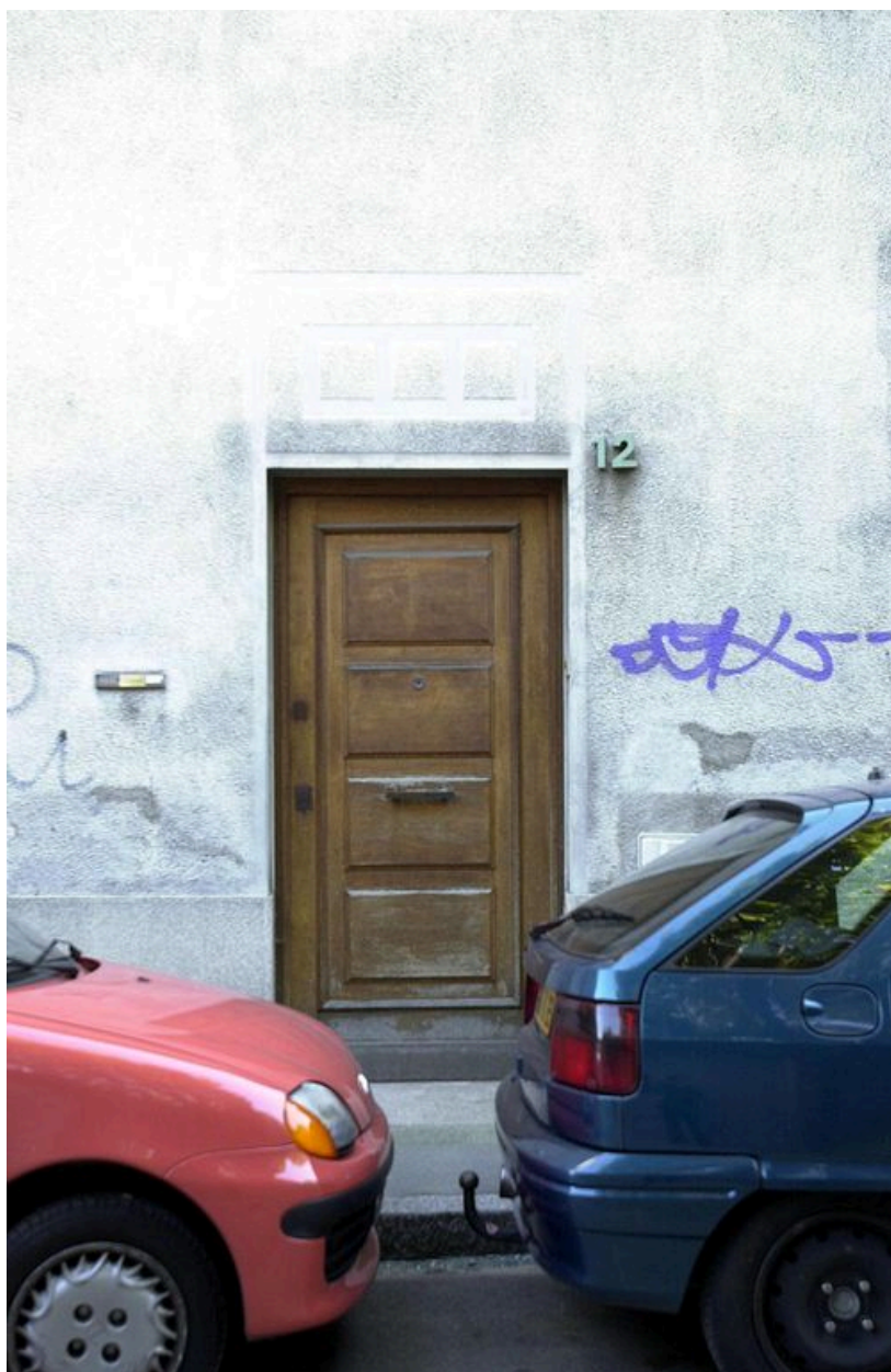
Détail de la porte