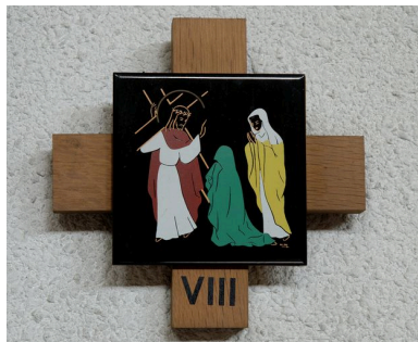
Chemin de croix, détail de la station 8 IVR82_20096903376NUCA