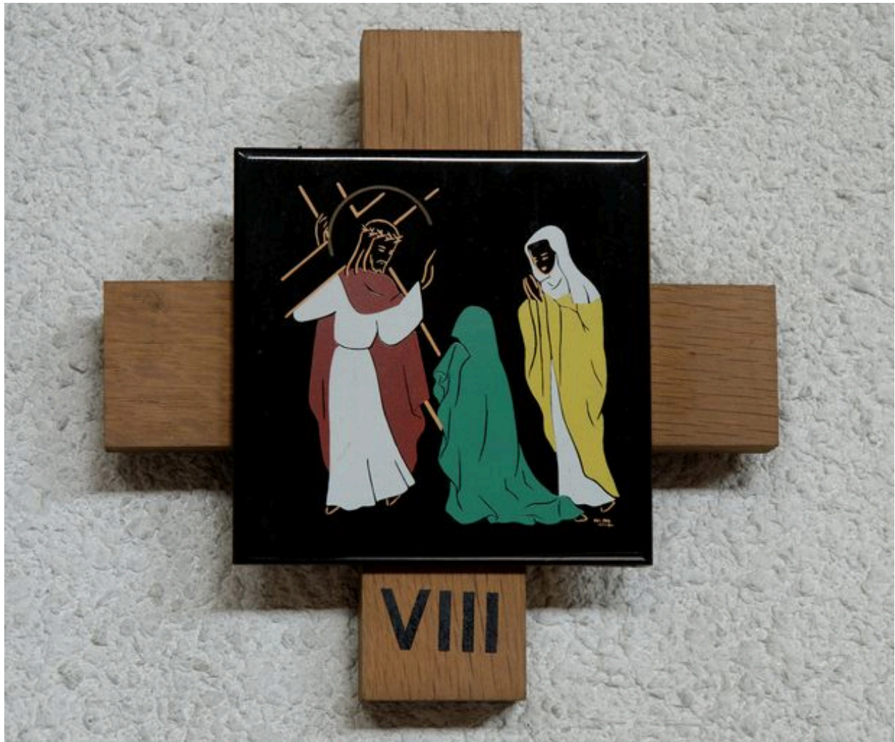
Chemin de croix, détail de la station 8