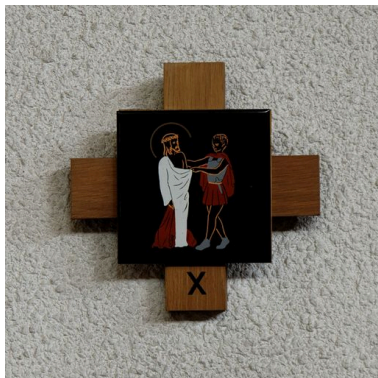
Chemin de croix, détail de la station 10 IVR82_20096903377NUCA