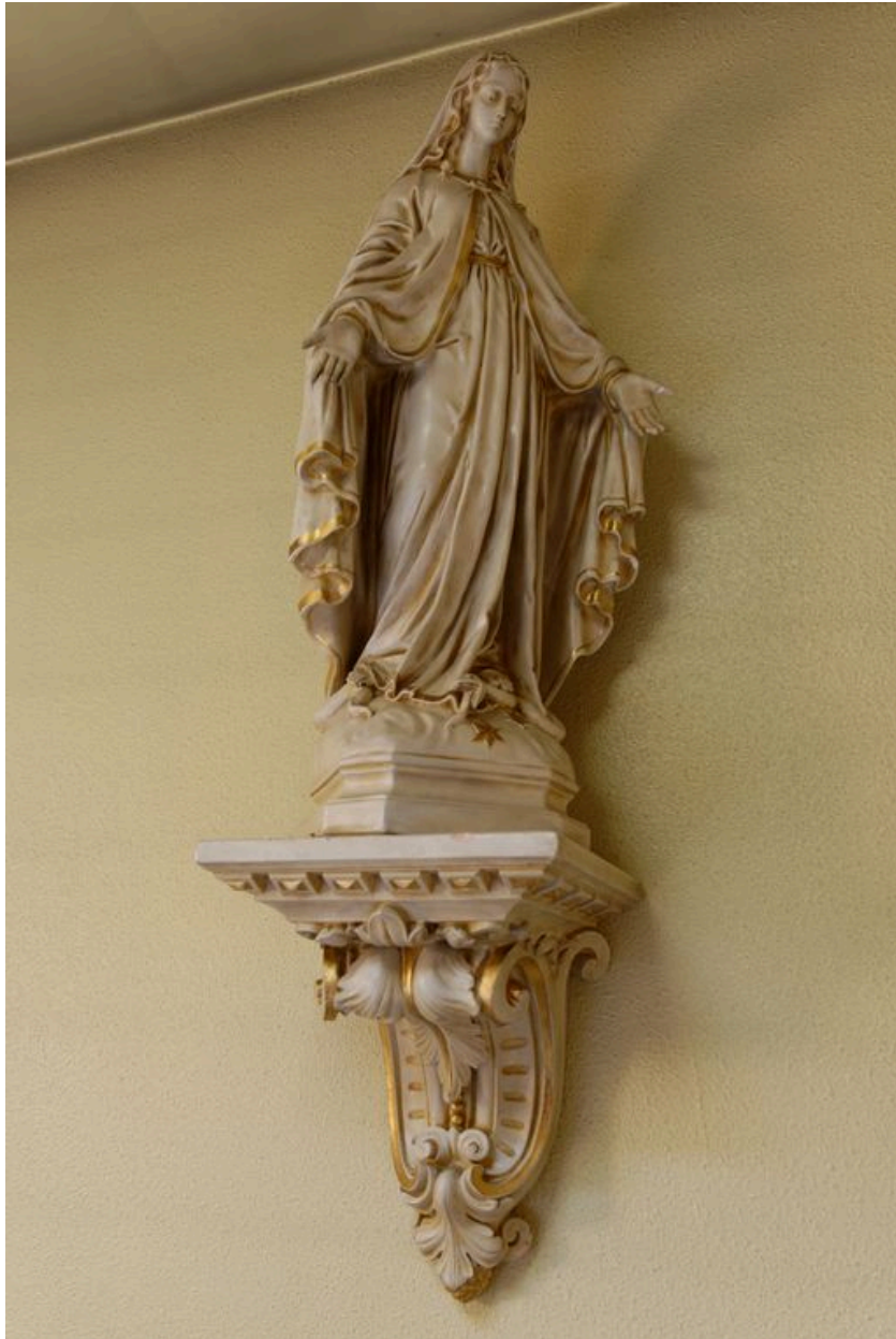
Vue générale de la statue de la Vierge de l'Immaculée Conception, située dans l'oratoire