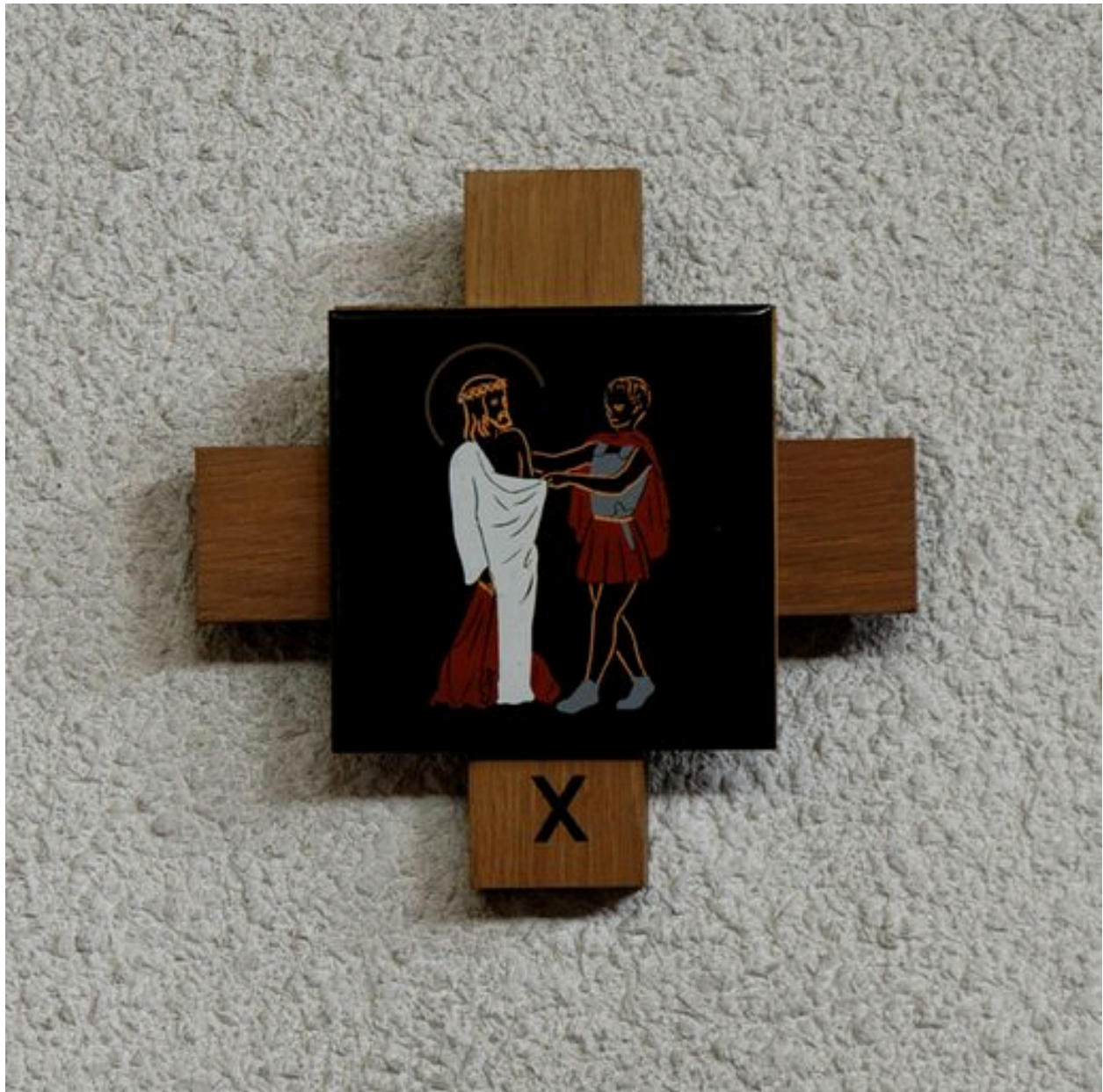
Chemin de croix, détail de la station 10