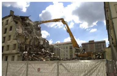
Vue de l'immeuble en cours de destruction IVR82_20016901995NUCA