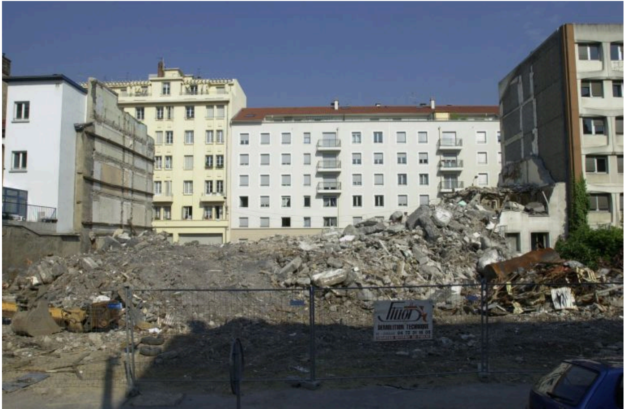
Vue de l'immeuble détruit depuis la rue Quivogne