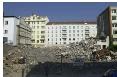
Vue de l'immeuble détruit depuis la rue Quivogne