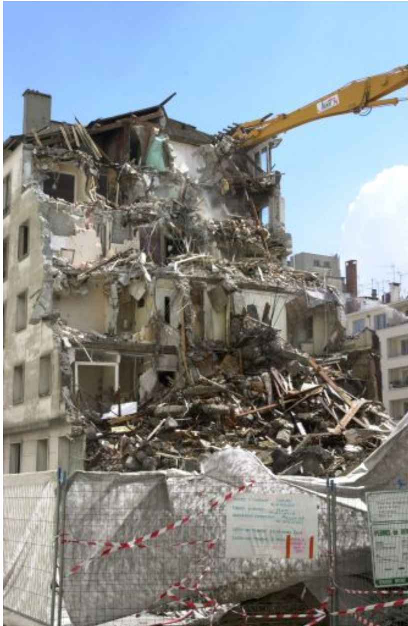
Détail de l'immeuble en cours de destruction