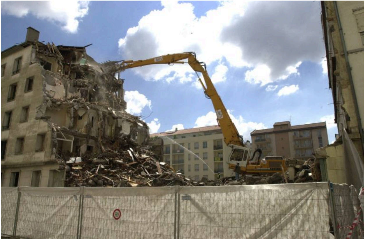
Vue de l'immeuble en cours de destruction