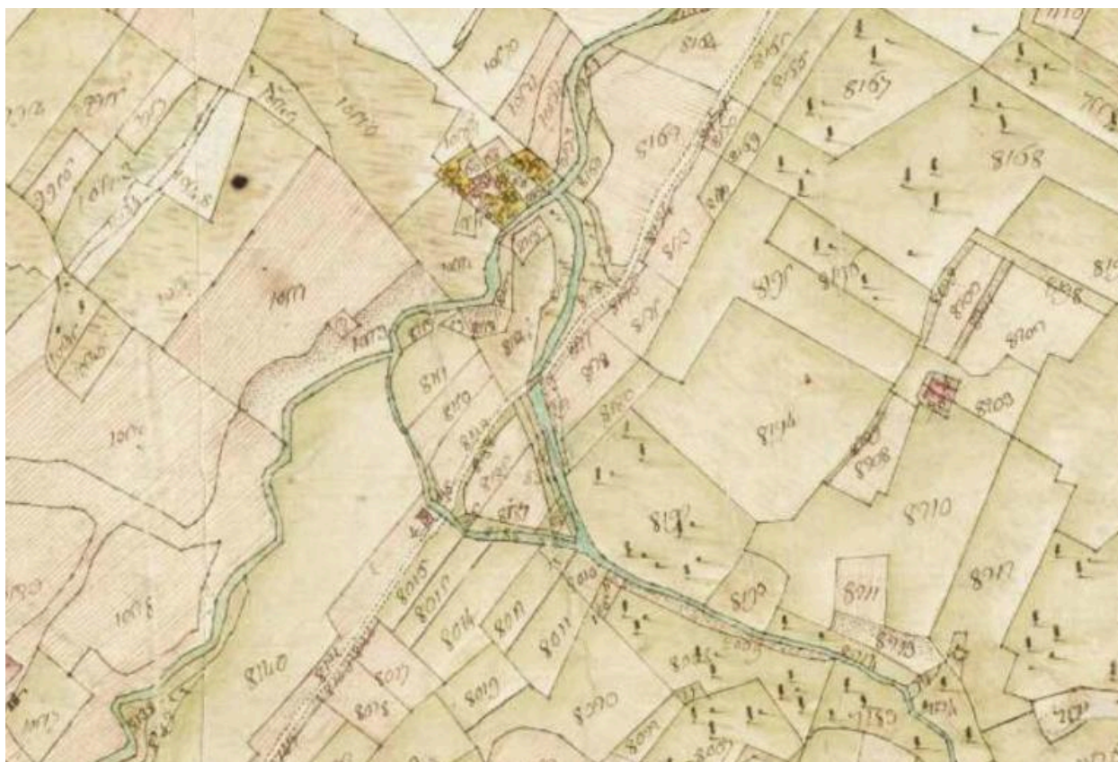
Pont du petit Nant, extrait mappe sarde 1726-1736