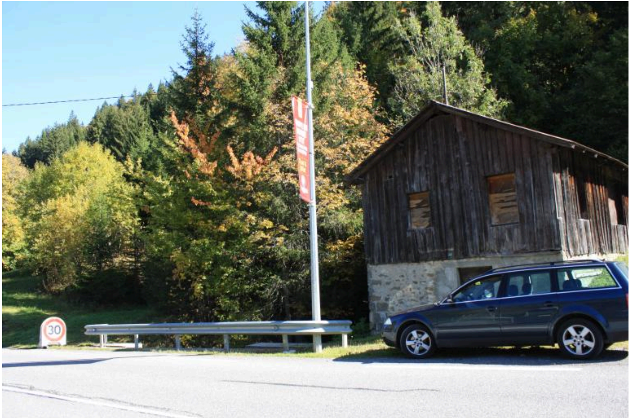
Pont du petit Nant, Contexte