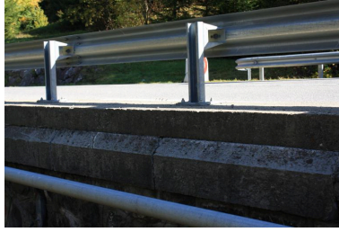
Pont du petit Nant, détails plinthe, revêtement et glissière IVR84_20207401058NUCA