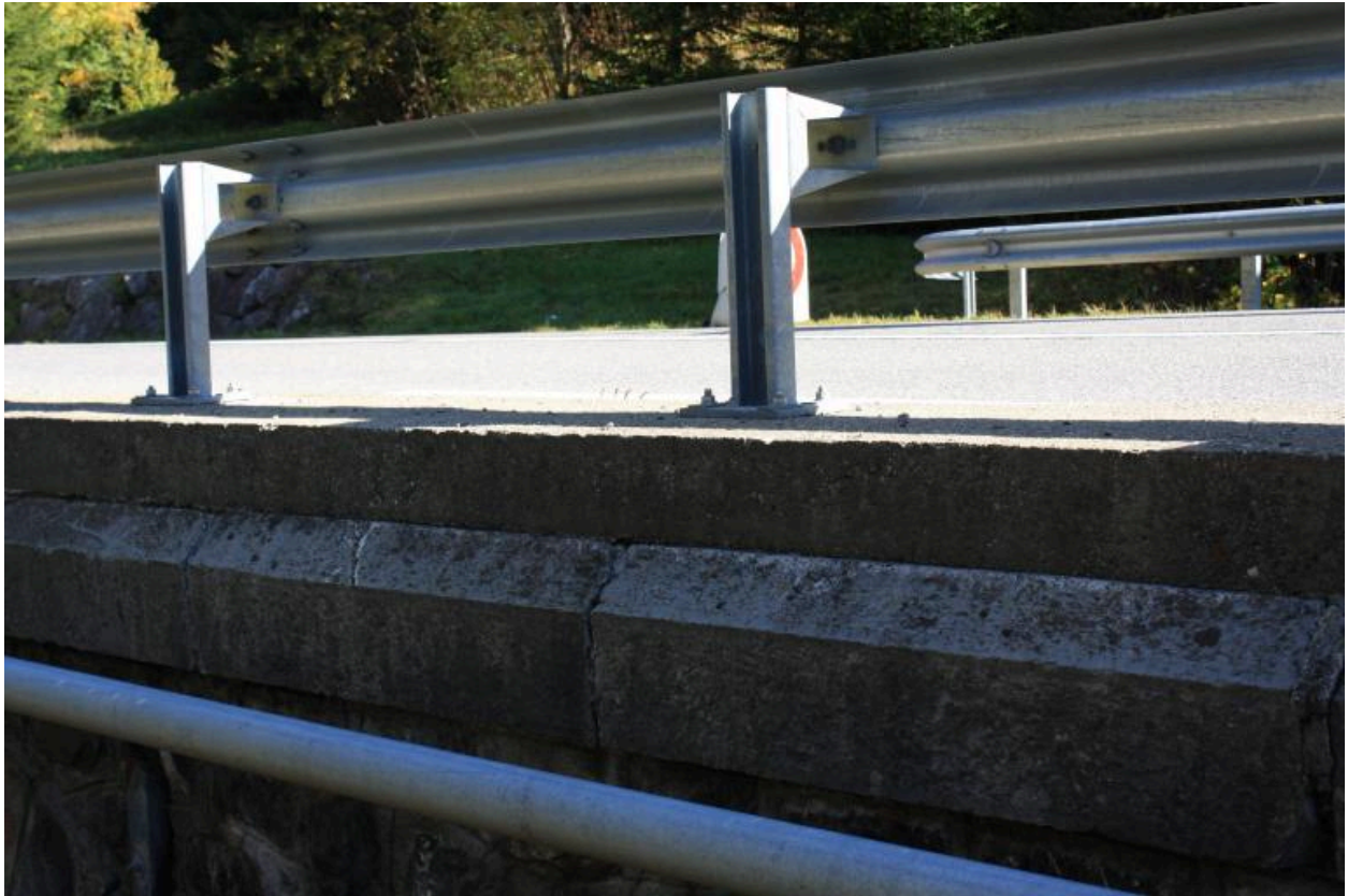
Pont du petit Nant, détails plinthe, revêtement et glissière