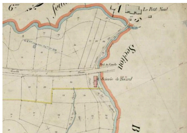
Pont du petit Nant, extrait cadastre français 1903 IVR84_20207401059NUCA