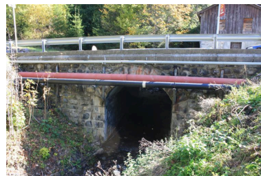
Pont du petit Nant, face aval IVR84_20197401268NUCA