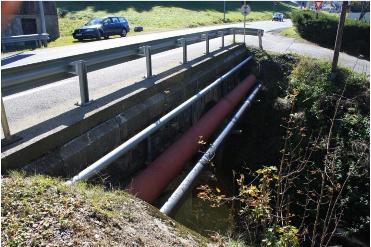
Pont du petit Nant, chaussée et gardes corps