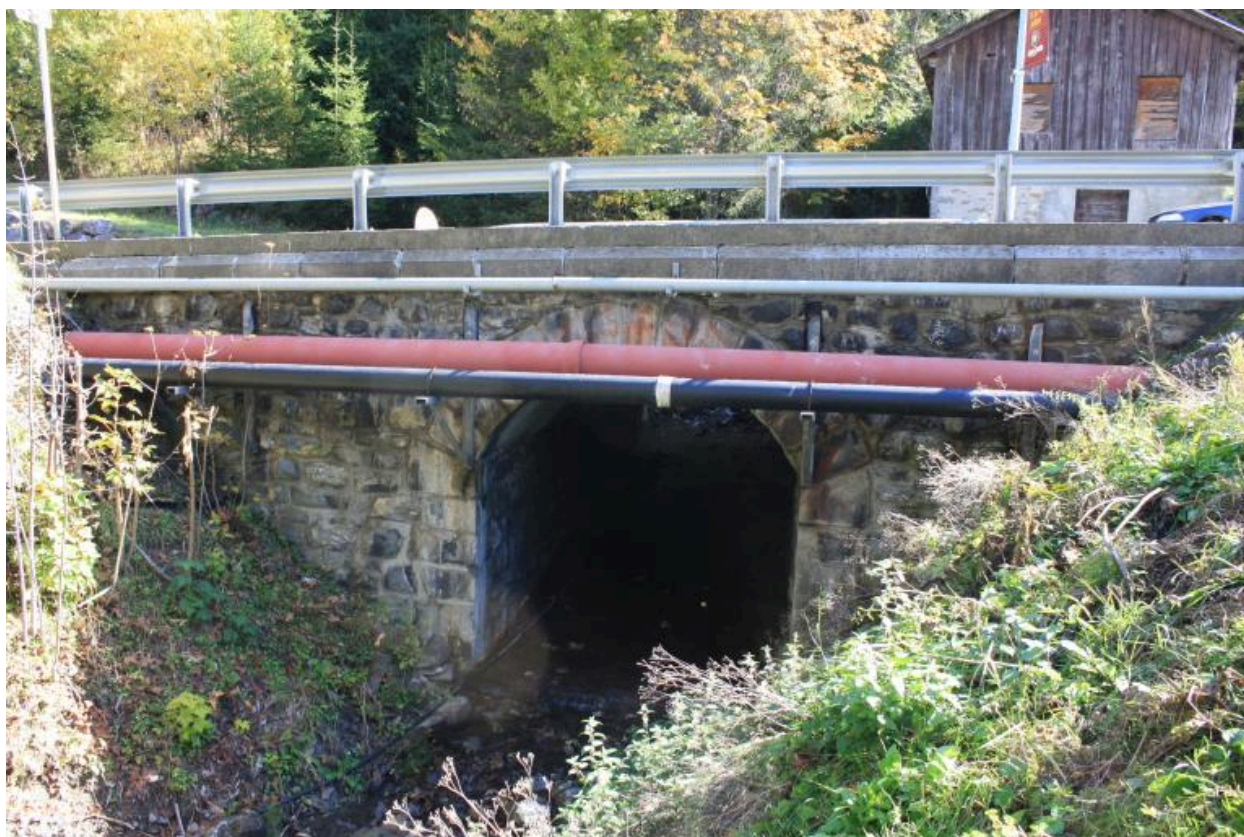
Pont du petit Nant, face aval