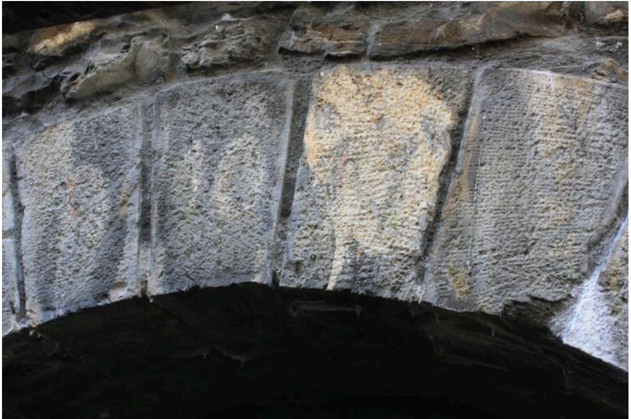
Pont du petit Nant, détail bandeau