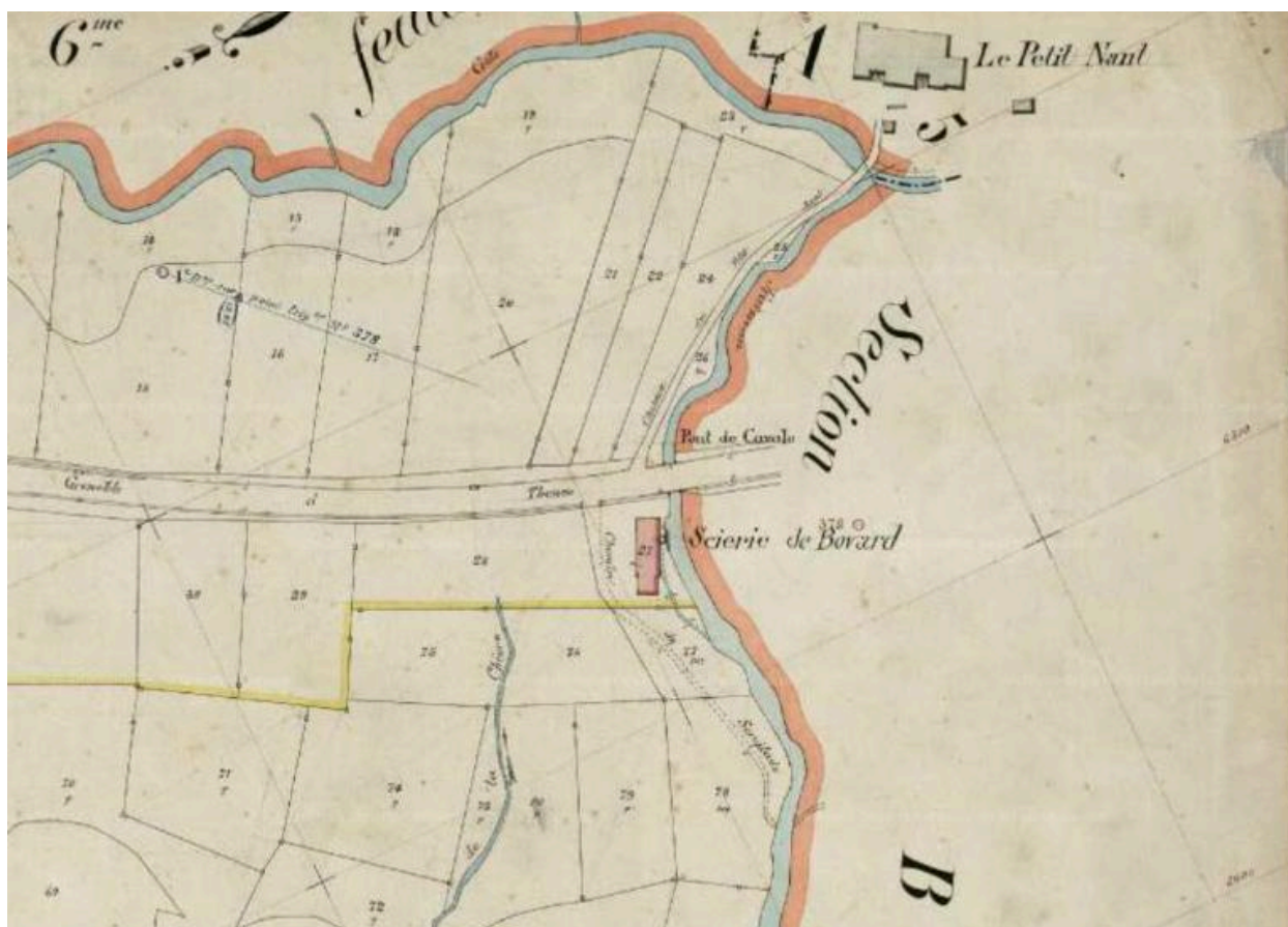
Pont du petit Nant, extrait cadastre français 1903