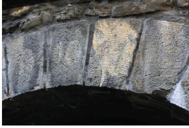
Pont du petit Nant, détail bandeau IVR84_20207401057NUCA