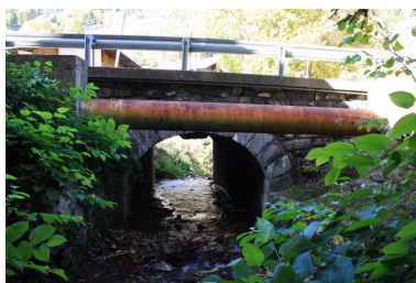
Pont du petit Nant, face amont IVR84_20207401055NUCA