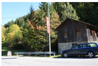
Pont du petit Nant, Contexte IVR84_20207401054NUCA