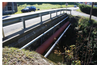
Pont du petit Nant, chaussée et garde corps IVR84_20207401056NUCA