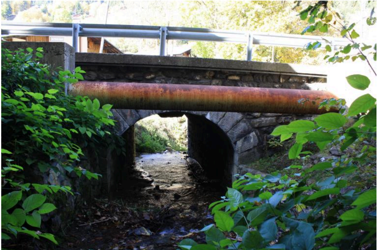
Pont du petit Nant, face amont