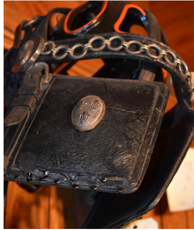
Détail des armoiries IVR84_20226303371NUC4A