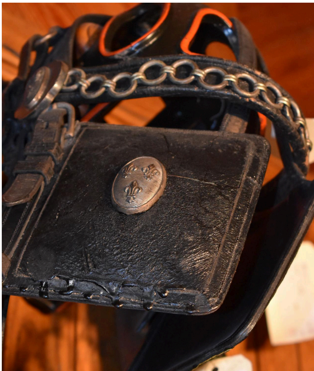
Détail des armoiries