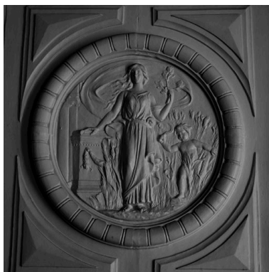
Détail du trumeau de cheminée