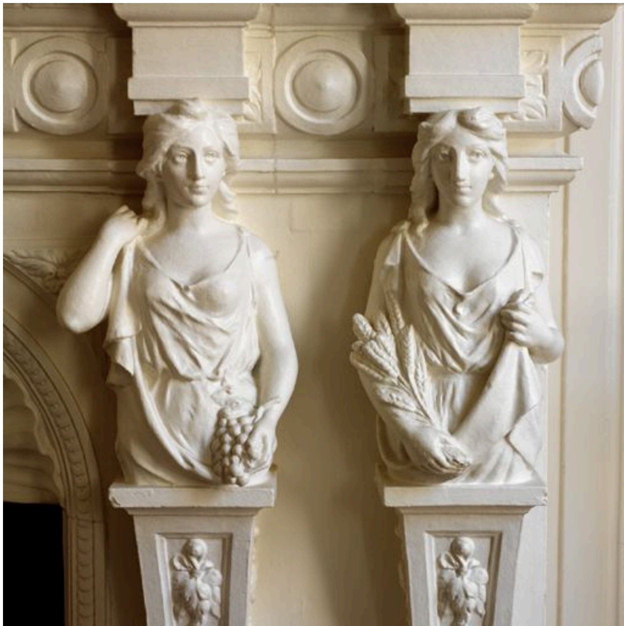
Détail du manteau de la cheminée