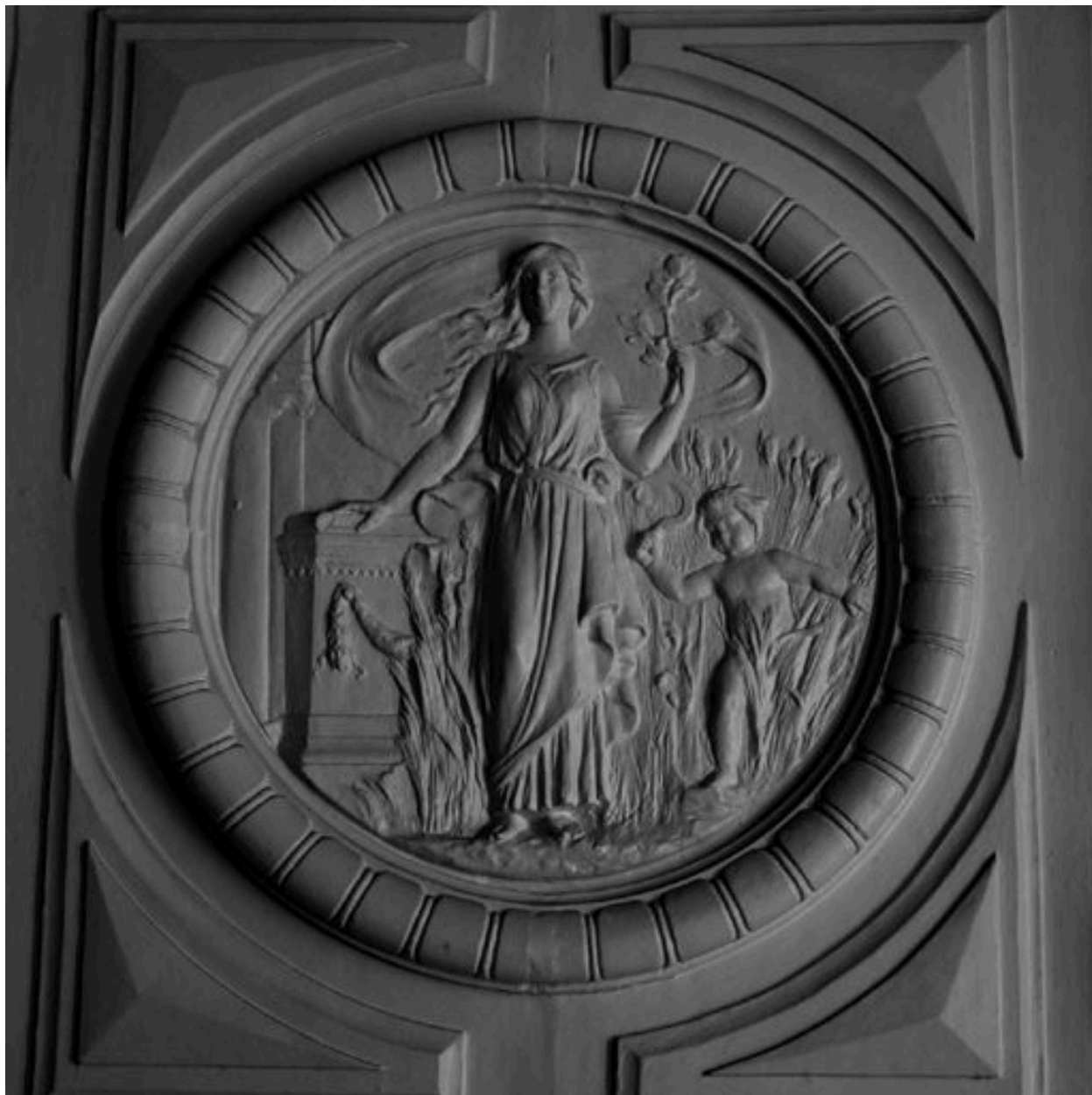
Détail du trumeau de cheminée