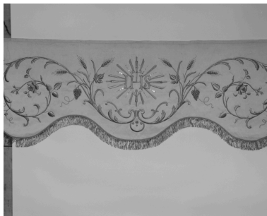
Vue partielle. IVR82_20002600723X