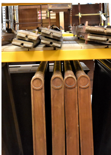
Vue générale - longs pans