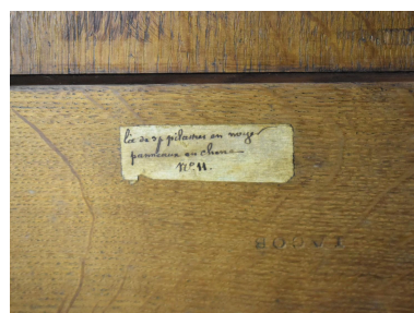
Détail - estampille et étiquette IVR84_20226301170NUC4A