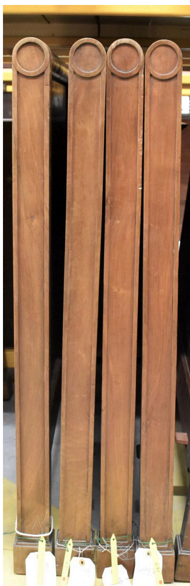
Vue générale - chevets IVR84_20226301169NUC4A