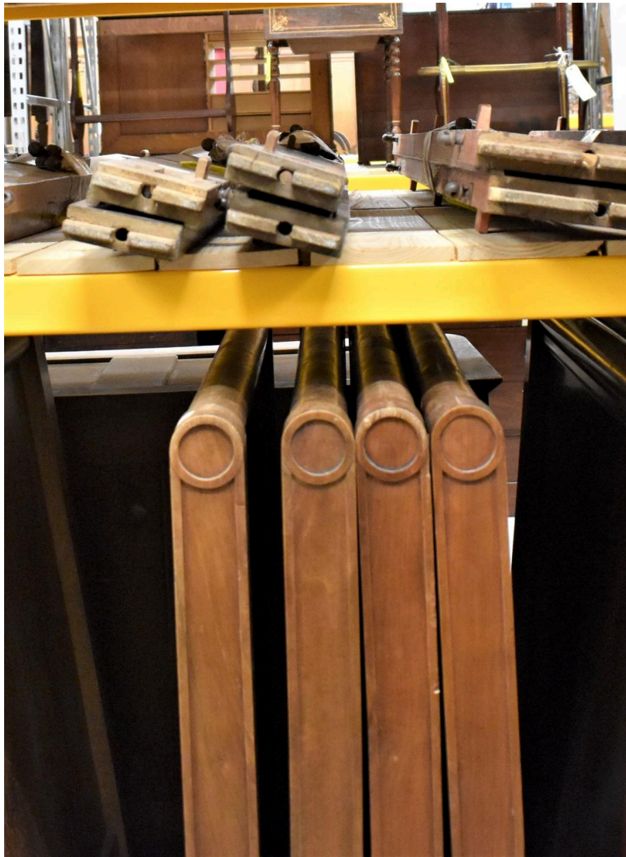
Vue générale - longs pans