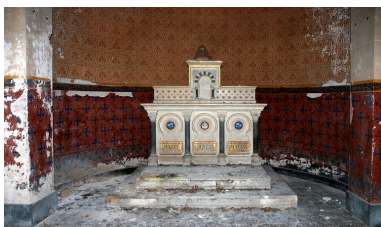
Abside et maître-autel