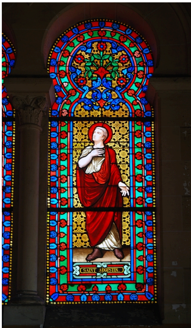
Saint Augustin, par Antoine Lusson fils (1866)