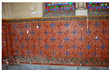
Bas-côté nord-est, détail du décor peint