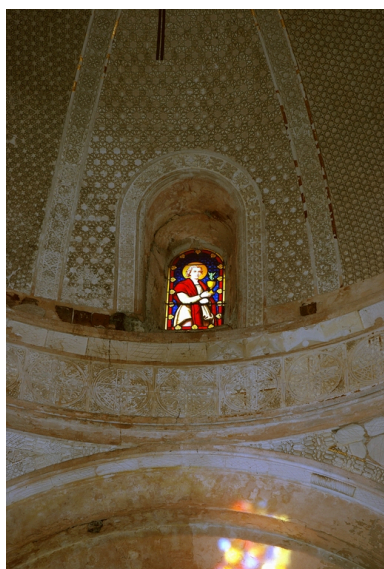
Coupole, détail de la lucarne avec le vitrail de saint Jean l'Evangeliste