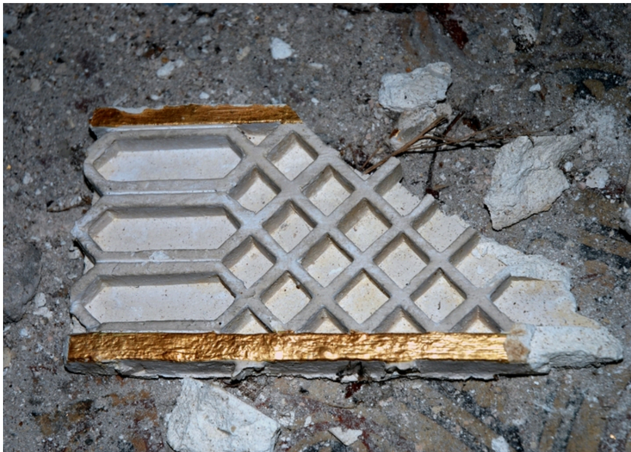
Plaque de stuc détachée de la coupole