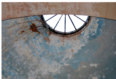
Abside, cul-de-four