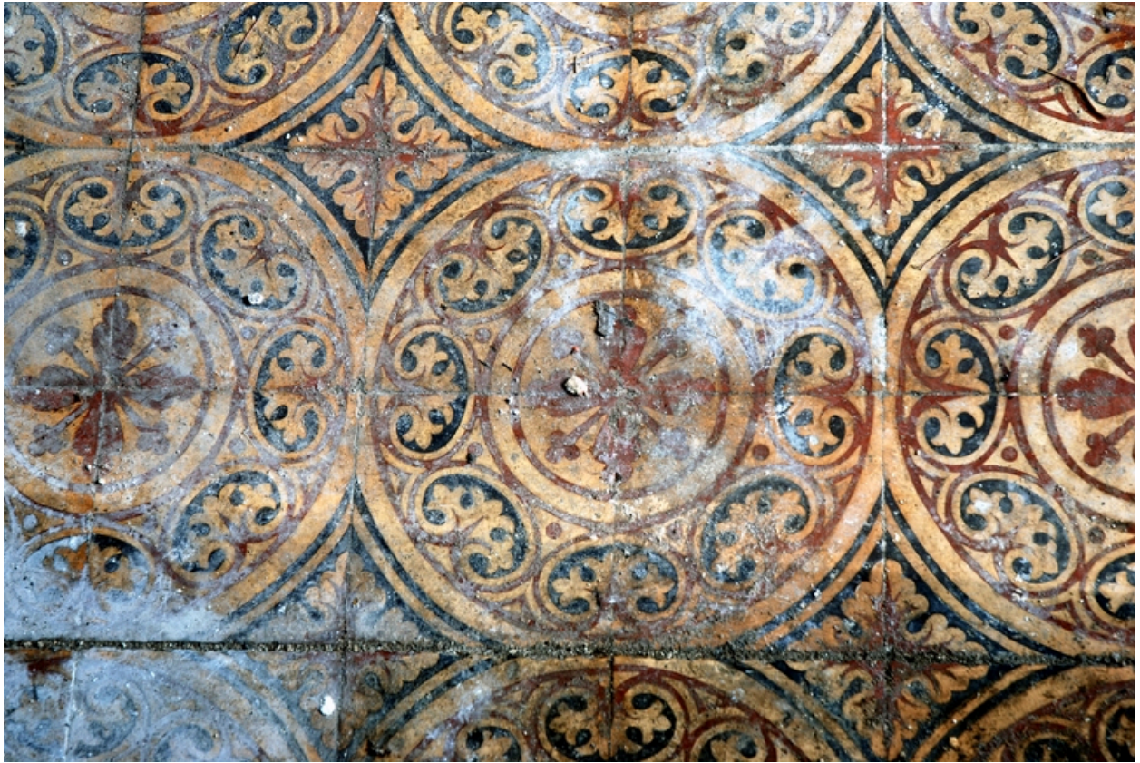
Détail du carrelage en carreaux de ciment