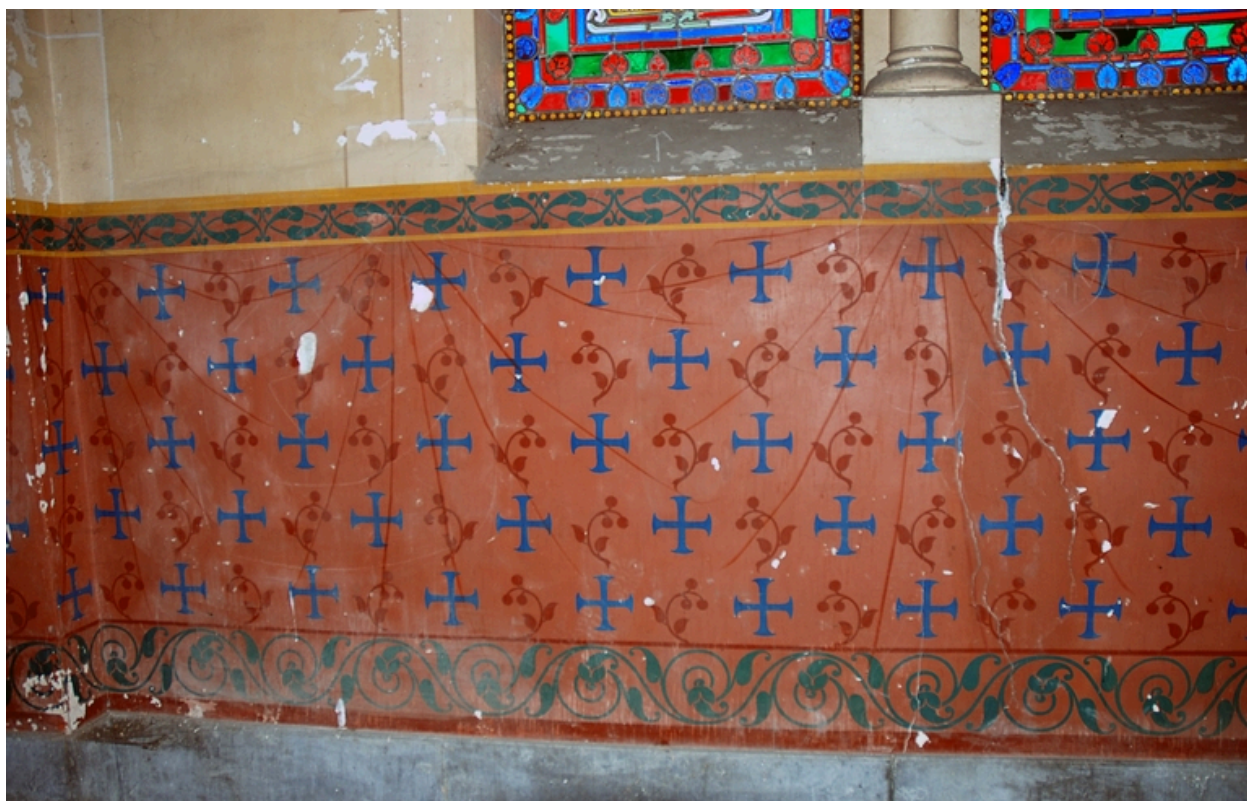
Bas-côté nord-est, détail du décor peint