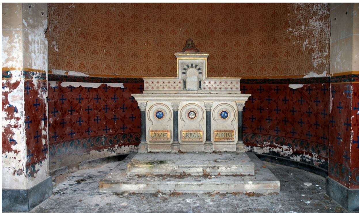
Abside et maître-autel