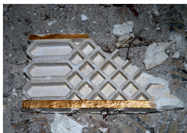
Plaque de stuc détachée de la coupole