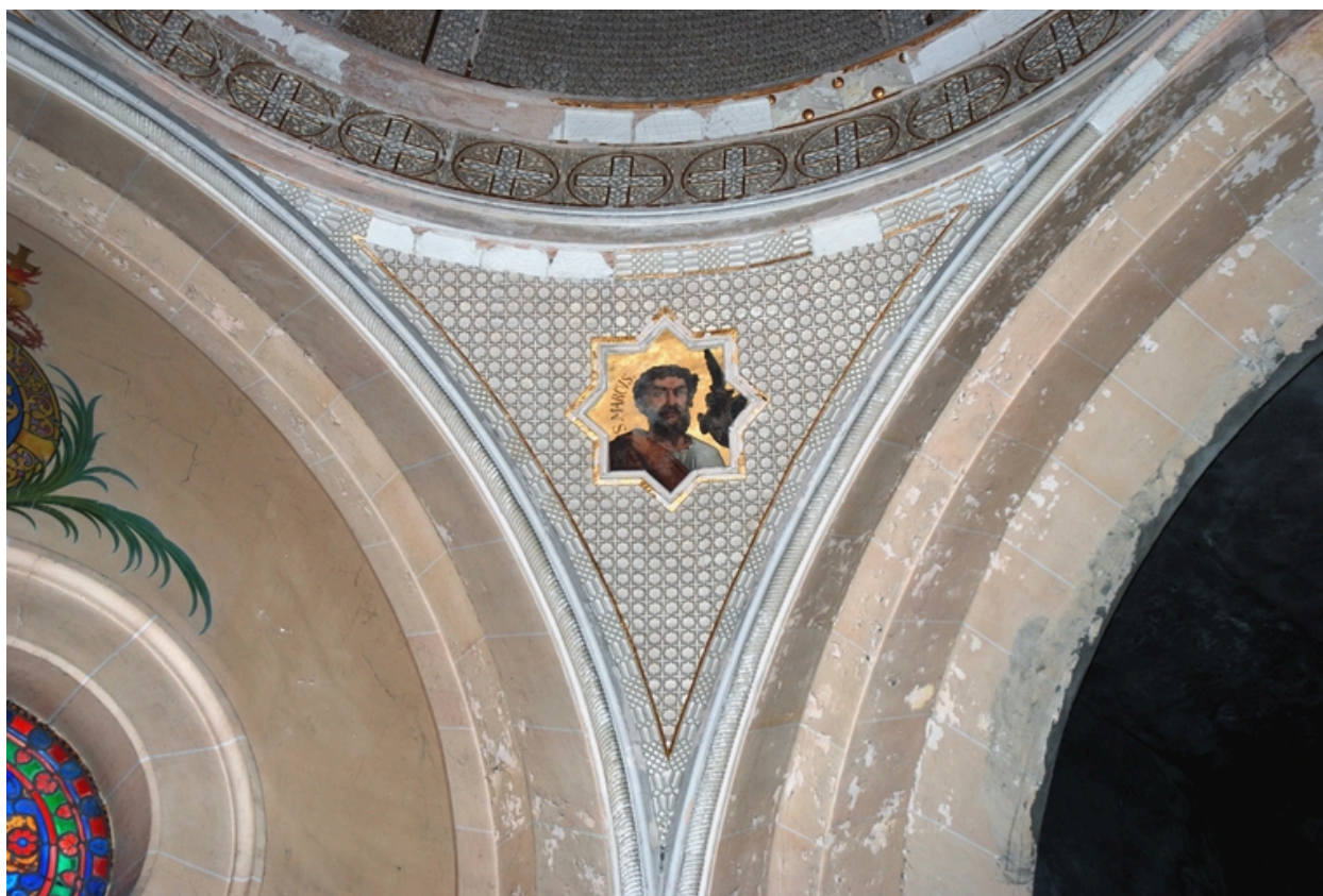
Pendentif avec le portrait de saint Marc