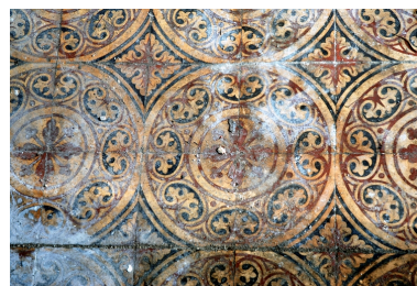
Détail du carrelage en carreaux de ciment IVR82_20123800154NUCA