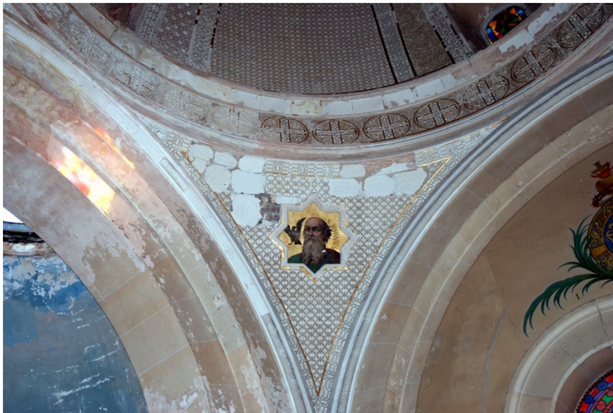
Pendentif avec portrait de saint Jean l'Évangéliste