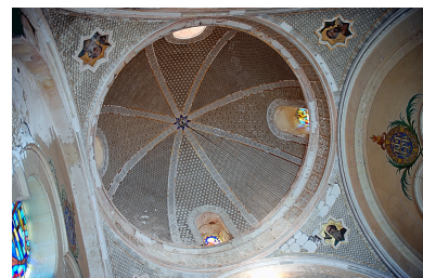
Coupole, vue d'ensemble IVR82_20123800145NUCA