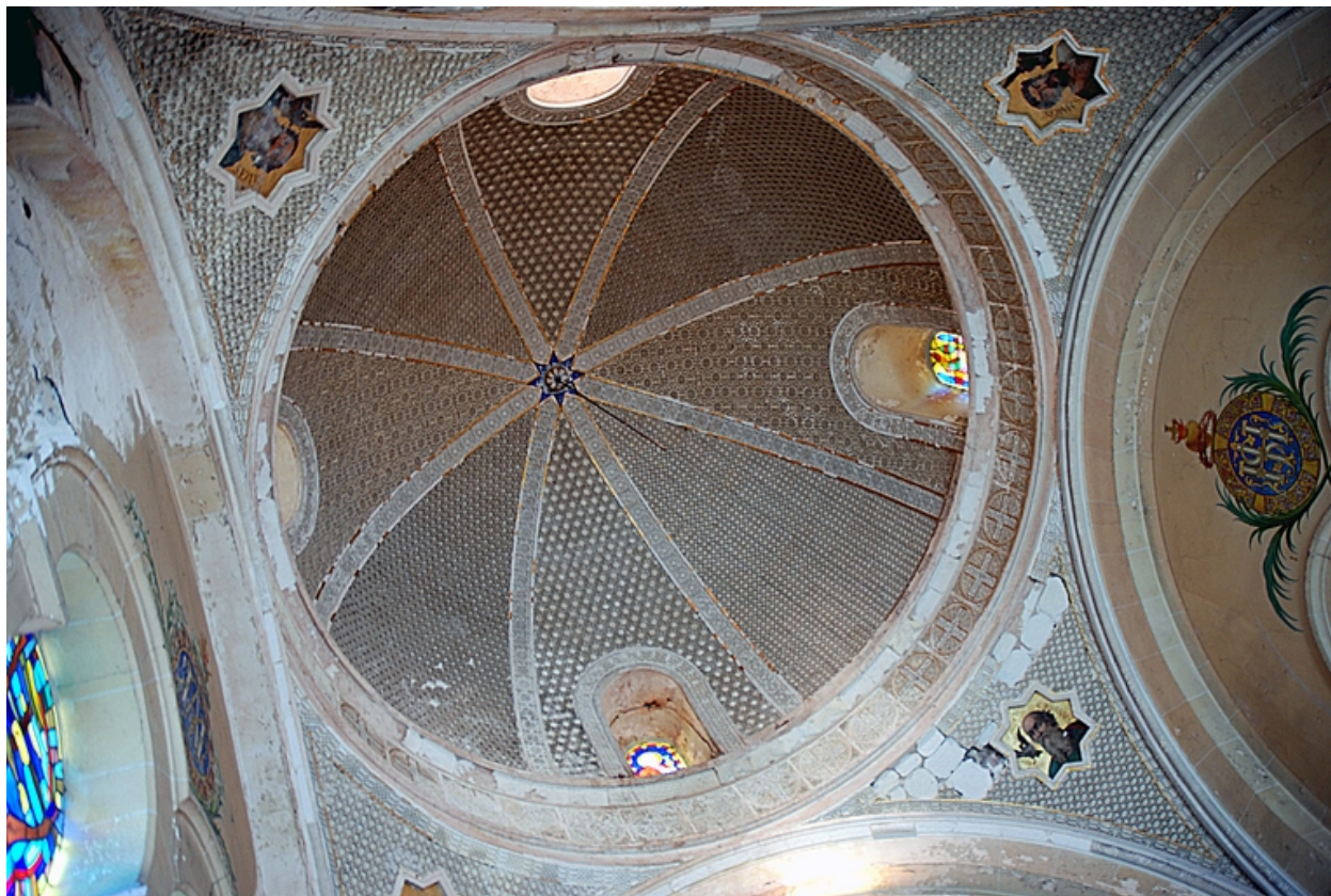
Coupole, vue d'ensemble