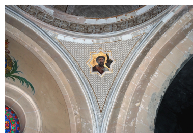
Pendentif avec le portrait de saint Marc