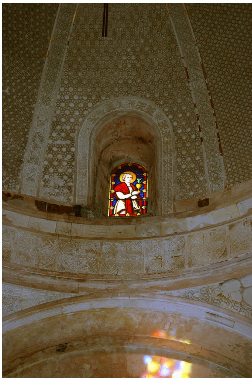
Coupole, détail de la lucarne avec le vitrail de saint Jean l'Evangeliste