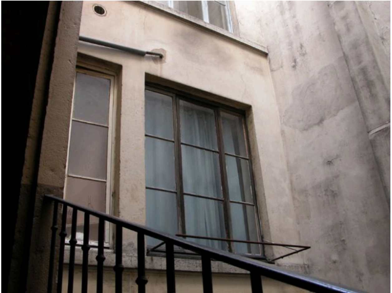
Elévation sur cour, 4e niveau vu depuis l'escalier