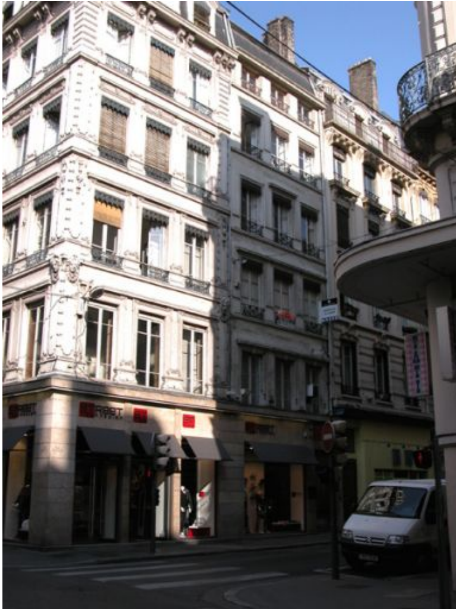
Façade, vue générale