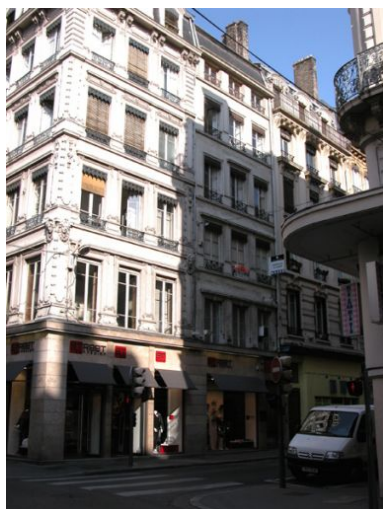
Façade, vue générale