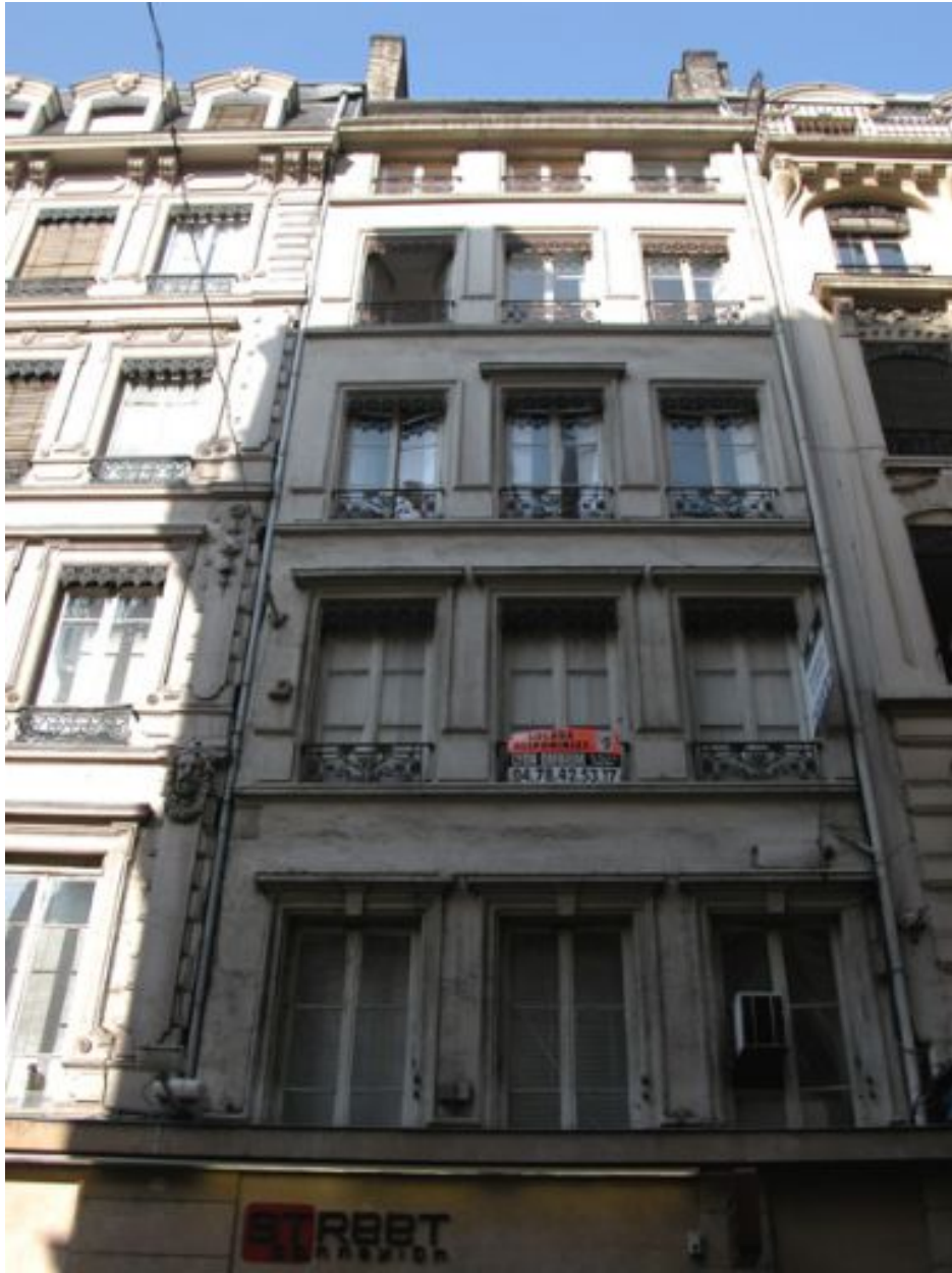
Façade, vue par-dessous