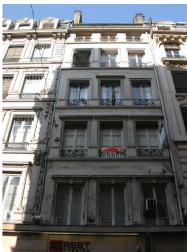
Façade, vue par-dessous IVR82_20046905715NUCA