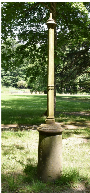
Vue générale IVR84_20226300799NUCA