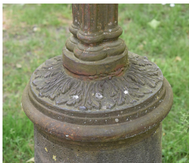
Détail base IVR84_20226300802NUCA