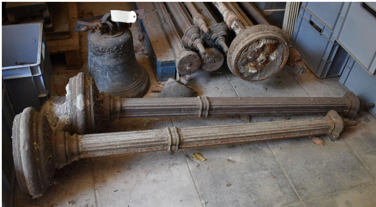
Colonnes déposées - réserve Grands Communs