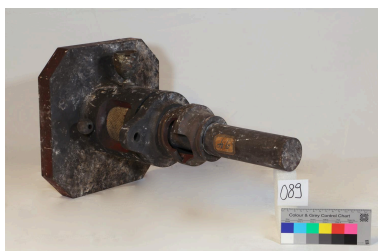
Presse étoupe, vue 2 (objet 089), IVR84_20256901142NUCA