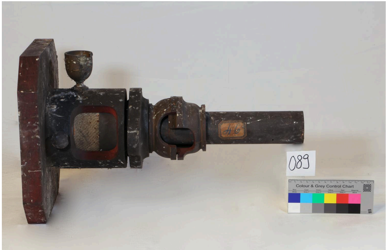
Presse étoupe, vue 1 (objet 089)