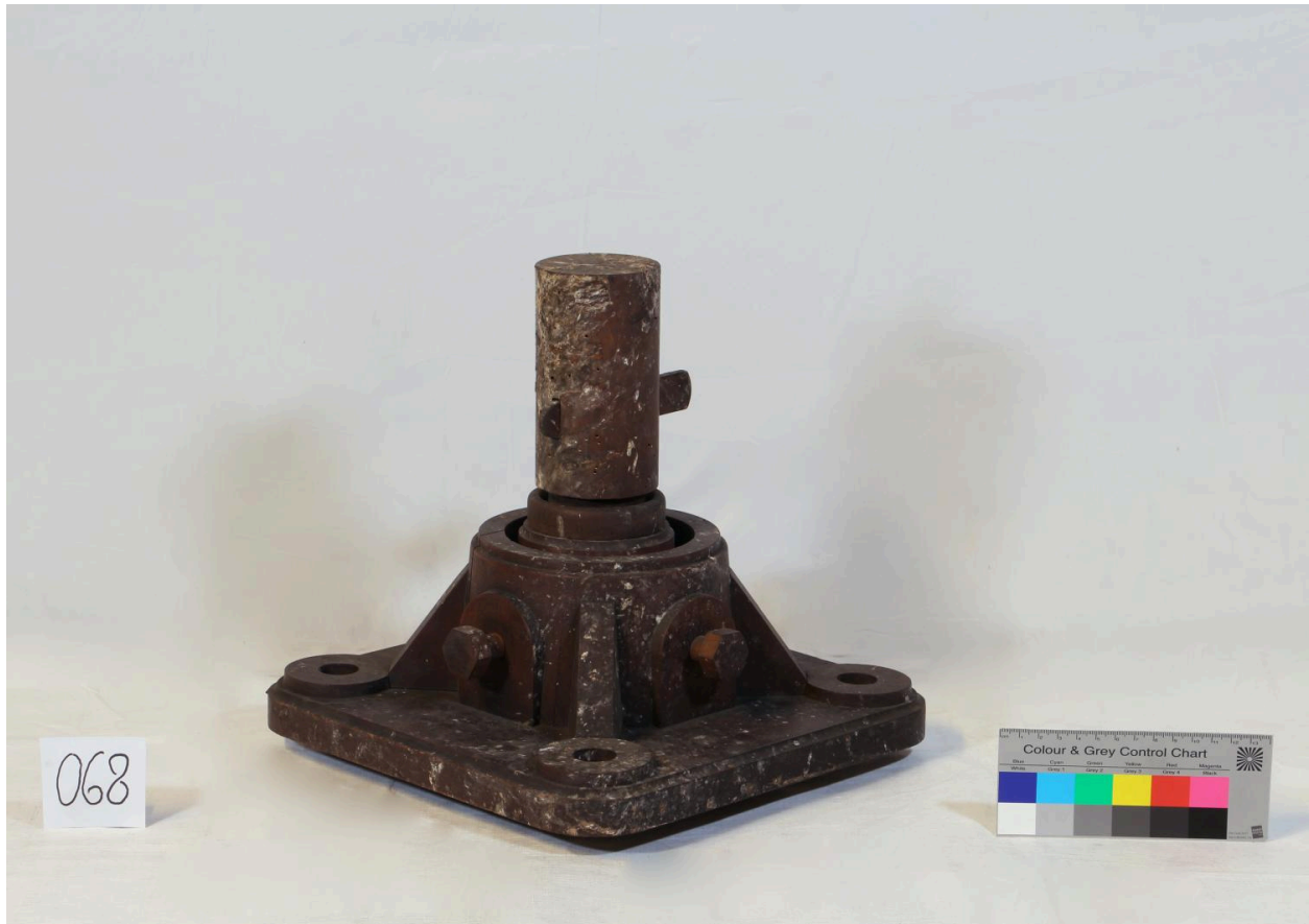
Support de réglage pour palier lisse, vue 2 (objet 068)