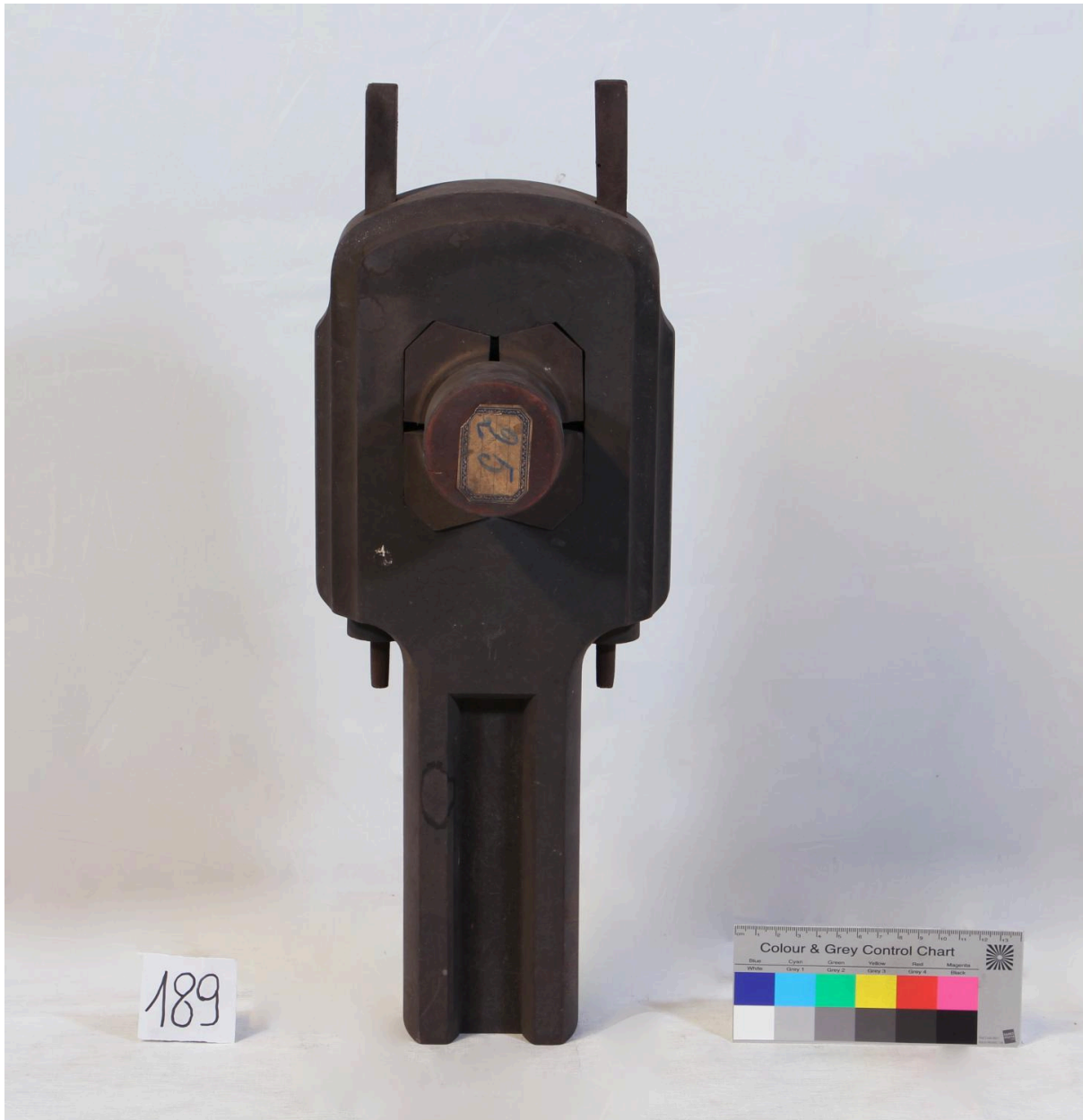
Tête de bielle (objet 189)