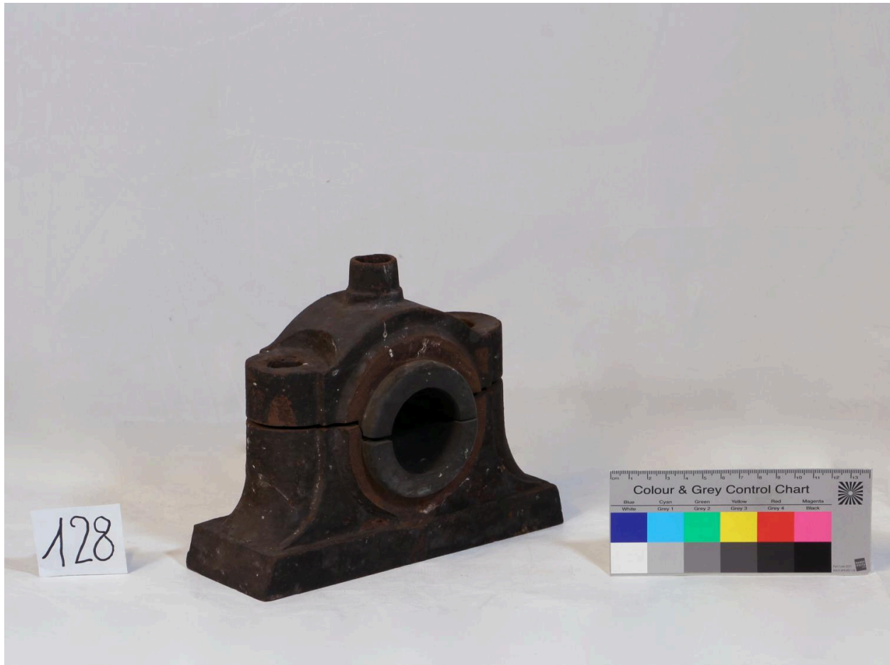
Palier, vue de côté (objet 128)