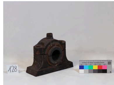
Palier, vue de côté (objet 128), IVR84_20256901202NUCA