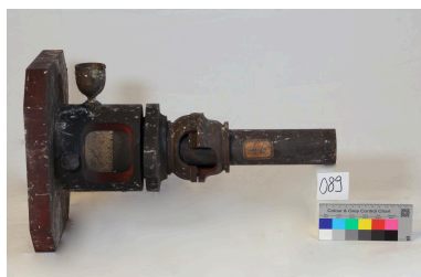
Presse étoupe, vue 1 (objet 089) IVR84_20256901141NUCA