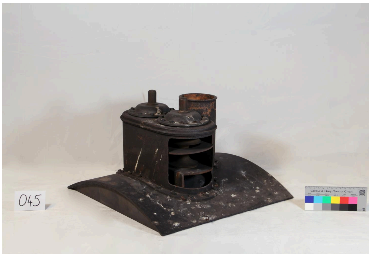
Modèle de valve haute pression, vue de côté (objet 045)