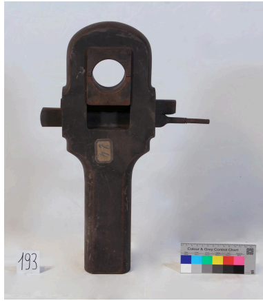
Tête de bielle (objet 193) IVR84_20256901295NUCA