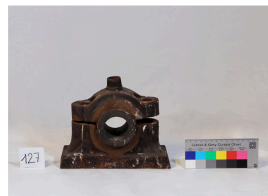
Palier (objet 127) IVR84_20256901199NUCA