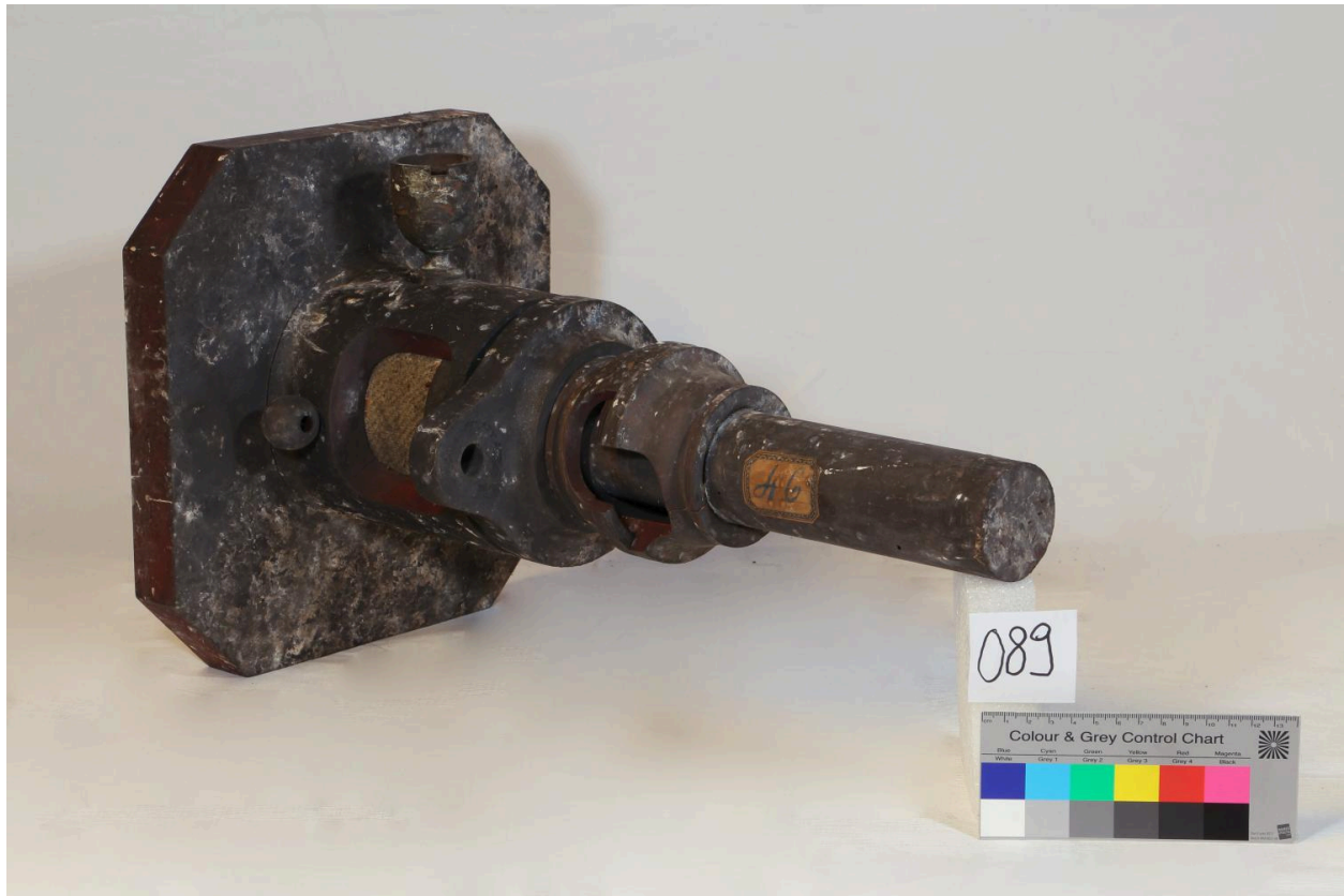
Presse étoupe, vue 2 (objet 089)