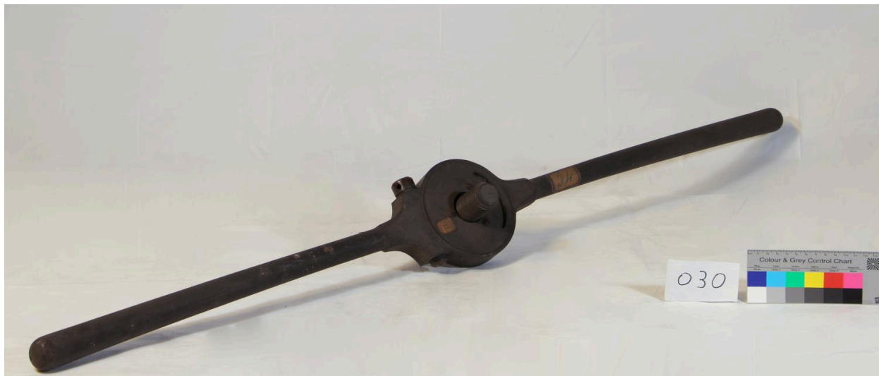
Clé de taraud, vue de côté (objet 030)