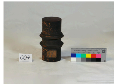
Tourillon avec bagues (objet 007)