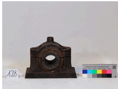
Palier (objet 128) IVR84_20256901201NUCA