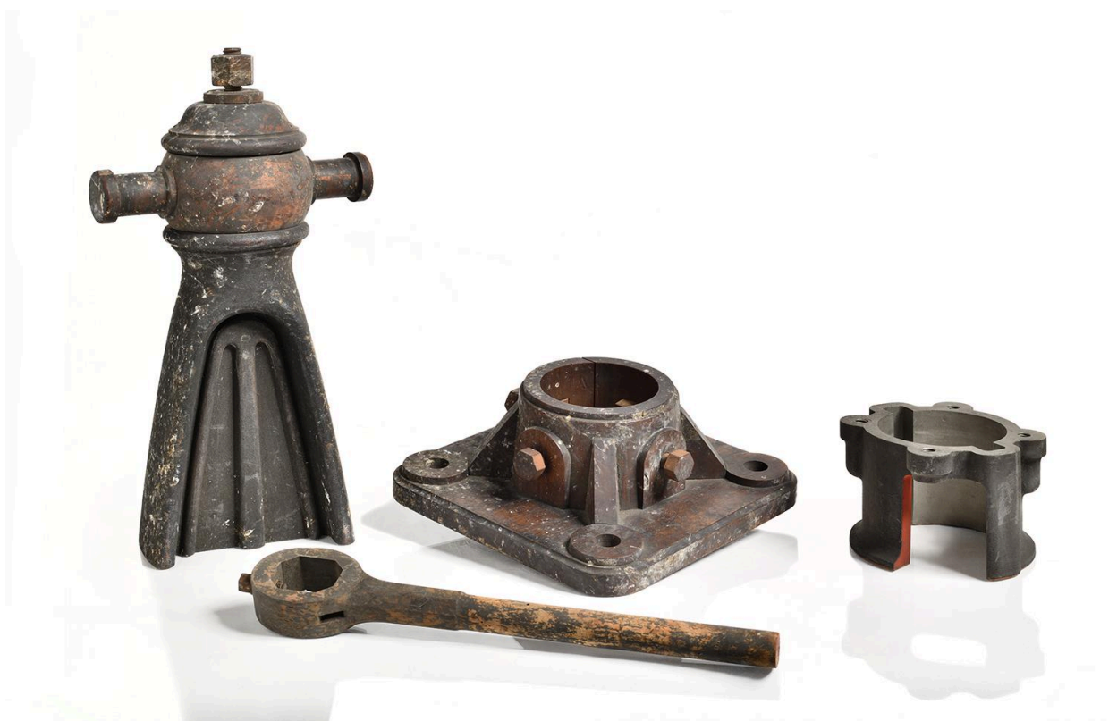
Modèles pour le dessin industriel (68, 176, 187, 203)