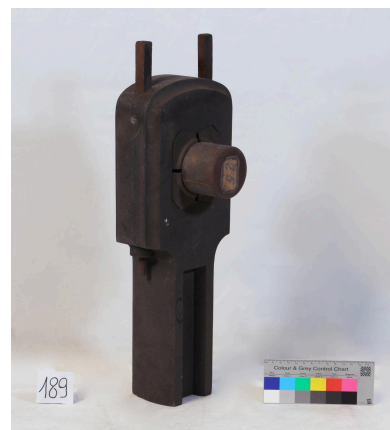
Tête de bielle, vue de côté (objet 189) IVR84_20256901290NUCA