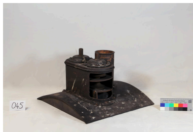
Modèle de valve haute pression, vue de côté (objet 045), IVR84_20256901042NUCA