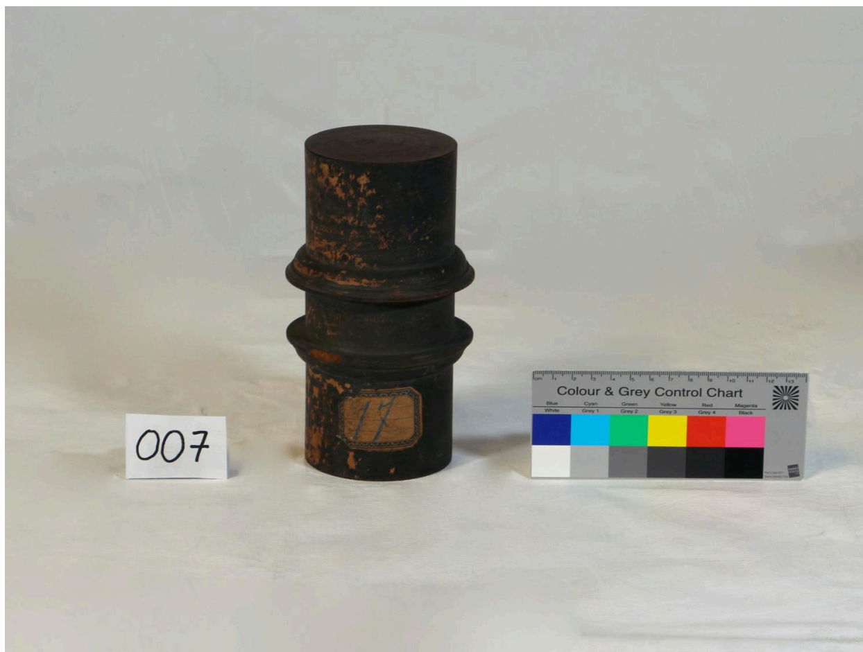
Tourillon avec bagues (objet 007)