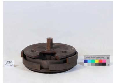
Embrayage (objet 179), IVR84_20256901273NUCA