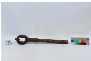
Bras de levier (objet 203) IVR84_20256901309NUCA