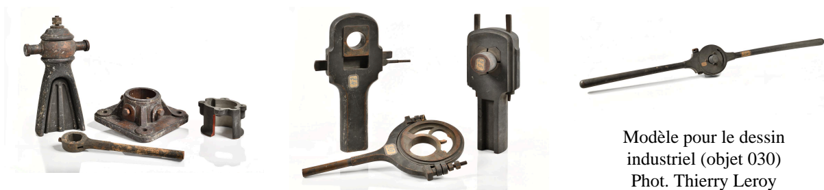
Modèle pour le dessin industriel (objet 030)