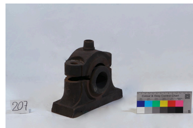
Palier (objet 207) IVR84_20256901314NUCA