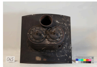
Modèle de valves haute pression (objet 045), IVR84_20256901041NUCA