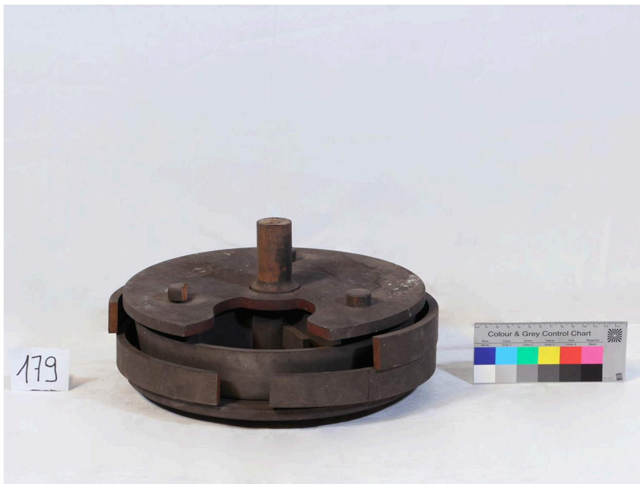
Embrayage (objet 179)