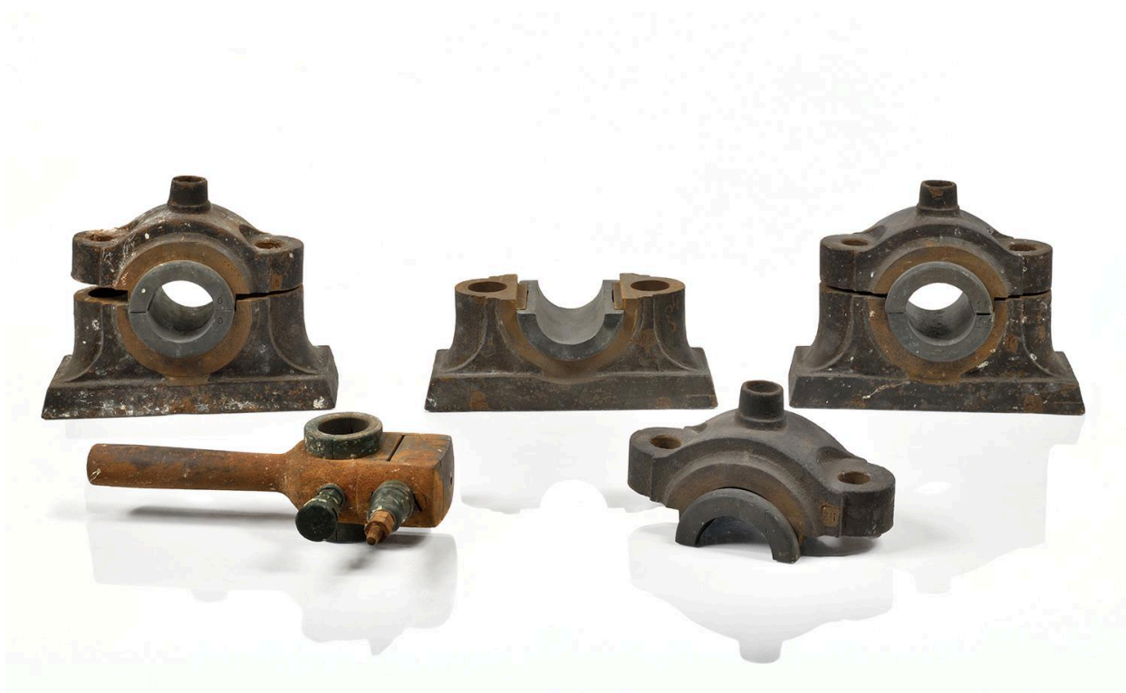
Modèles pour le dessin industriel (objets 127, 128, 199, 207)