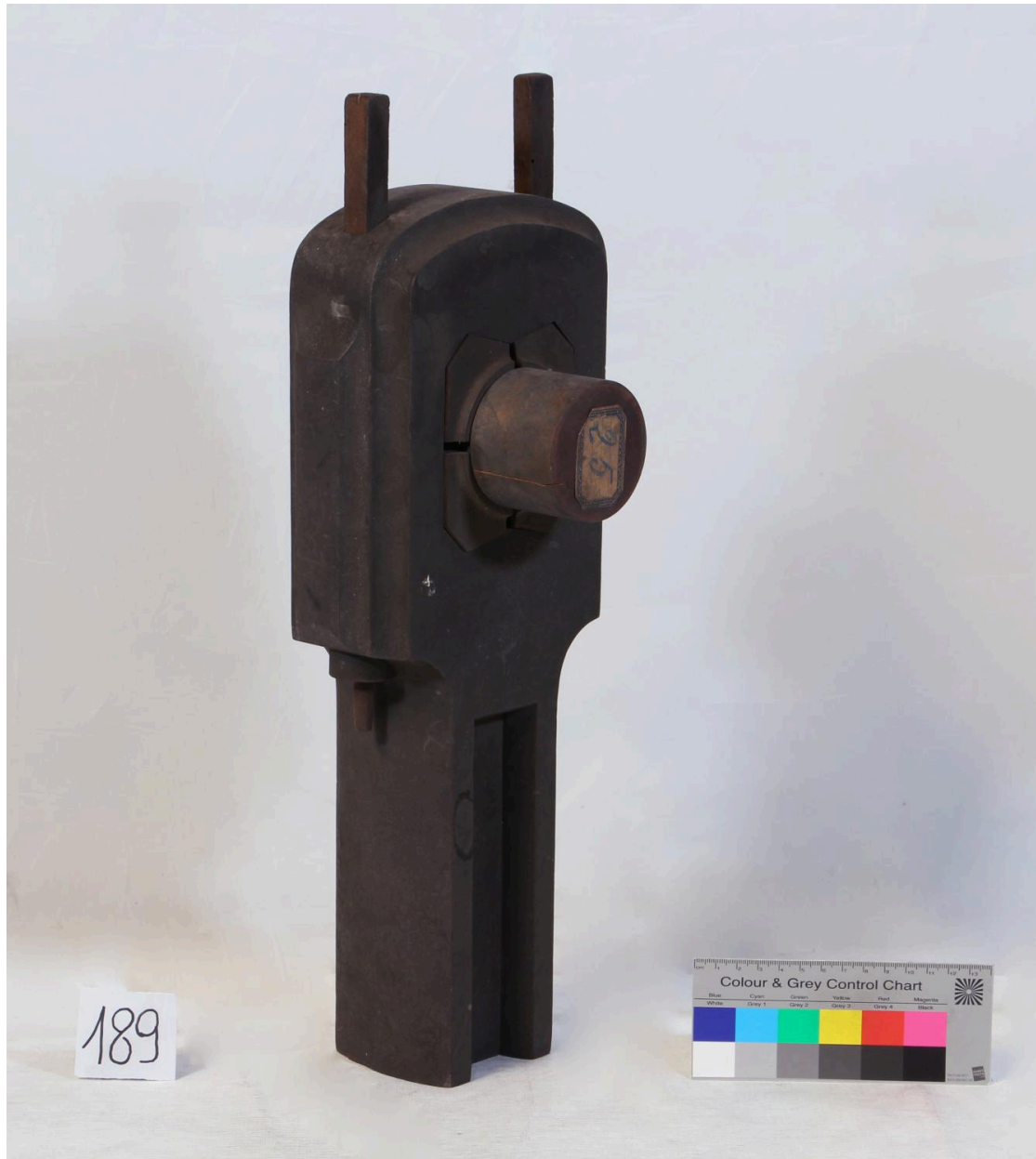
Tête de bielle, vue de côté (objet 189)