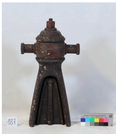
Vanne (objet 187), IVR84_20256901286NUCA