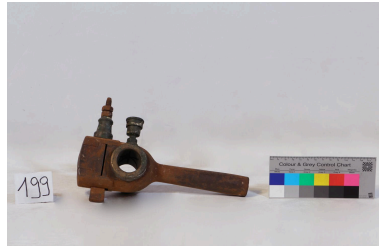
Tête de bielle (objet 199) IVR84_20256901302NUCA