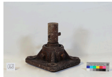
Support de réglage pour palier lisse, vue 2 (objet 068) IVR84_20256901109NUCA