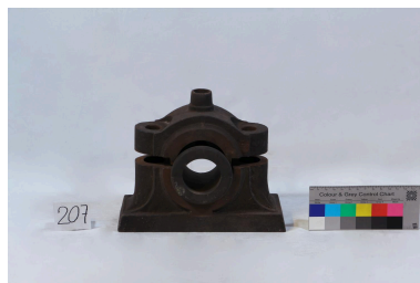
Palier, vue de face (objet 207) IVR84_20256901313NUCA