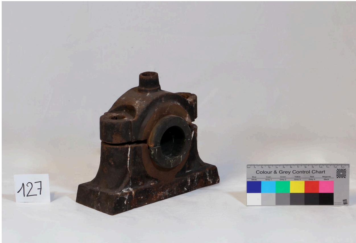
Palier, vue de côté (objet 127)