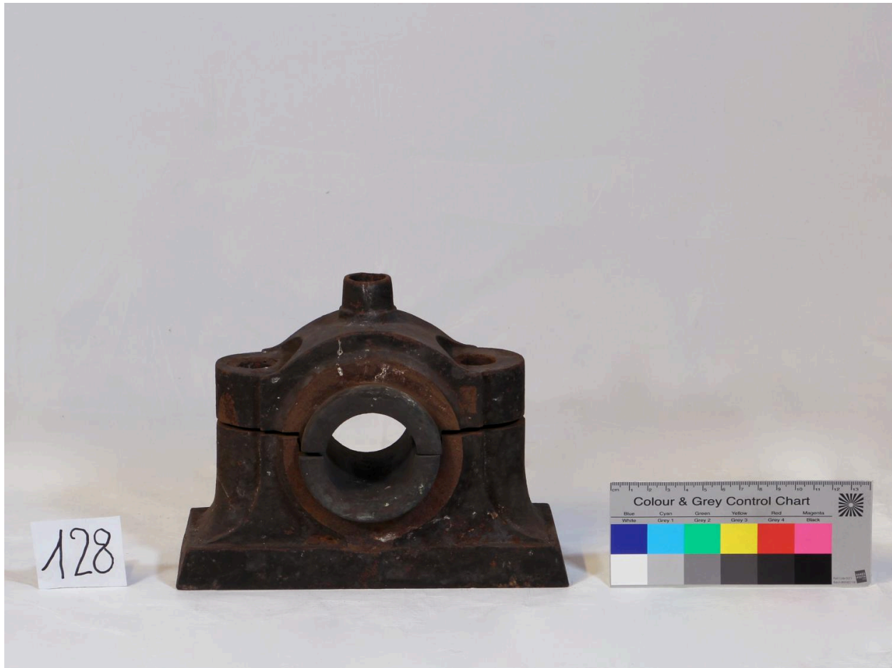
Palier (objet 128)