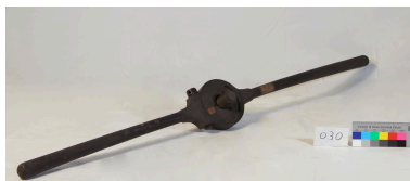
Clé de taraud, vue de côté (objet 030), IVR84_20256901012NUCA