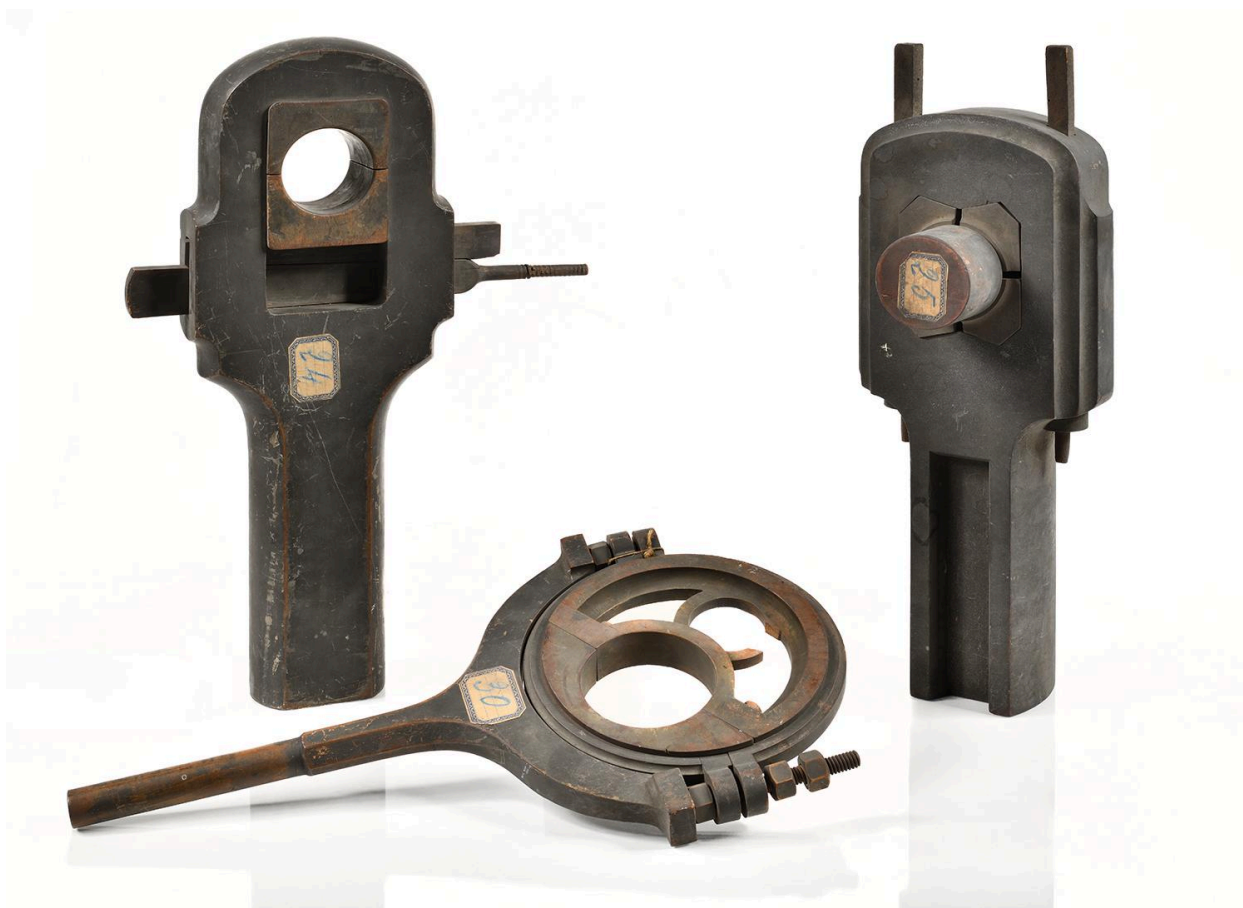
Modèles pour le dessin industriel (189, 193, 200)