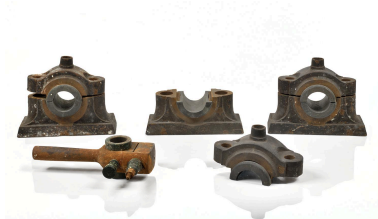
Modèles pour le dessin industriel (objets 127, 128, 199, 207) IVR84_20256901998NUCA