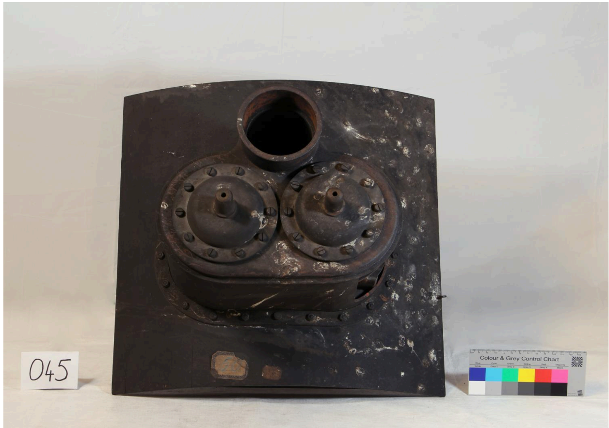
Modèle de valves haute pression (objet 045)