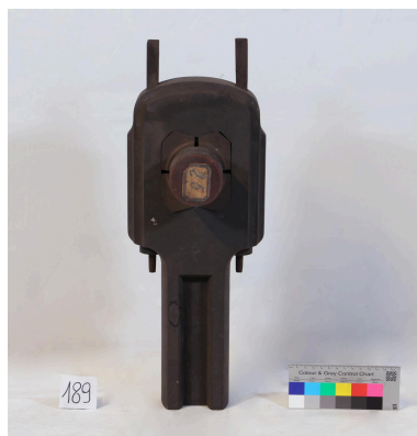
Tête de bielle (objet 189), IVR84_20256901289NUCA