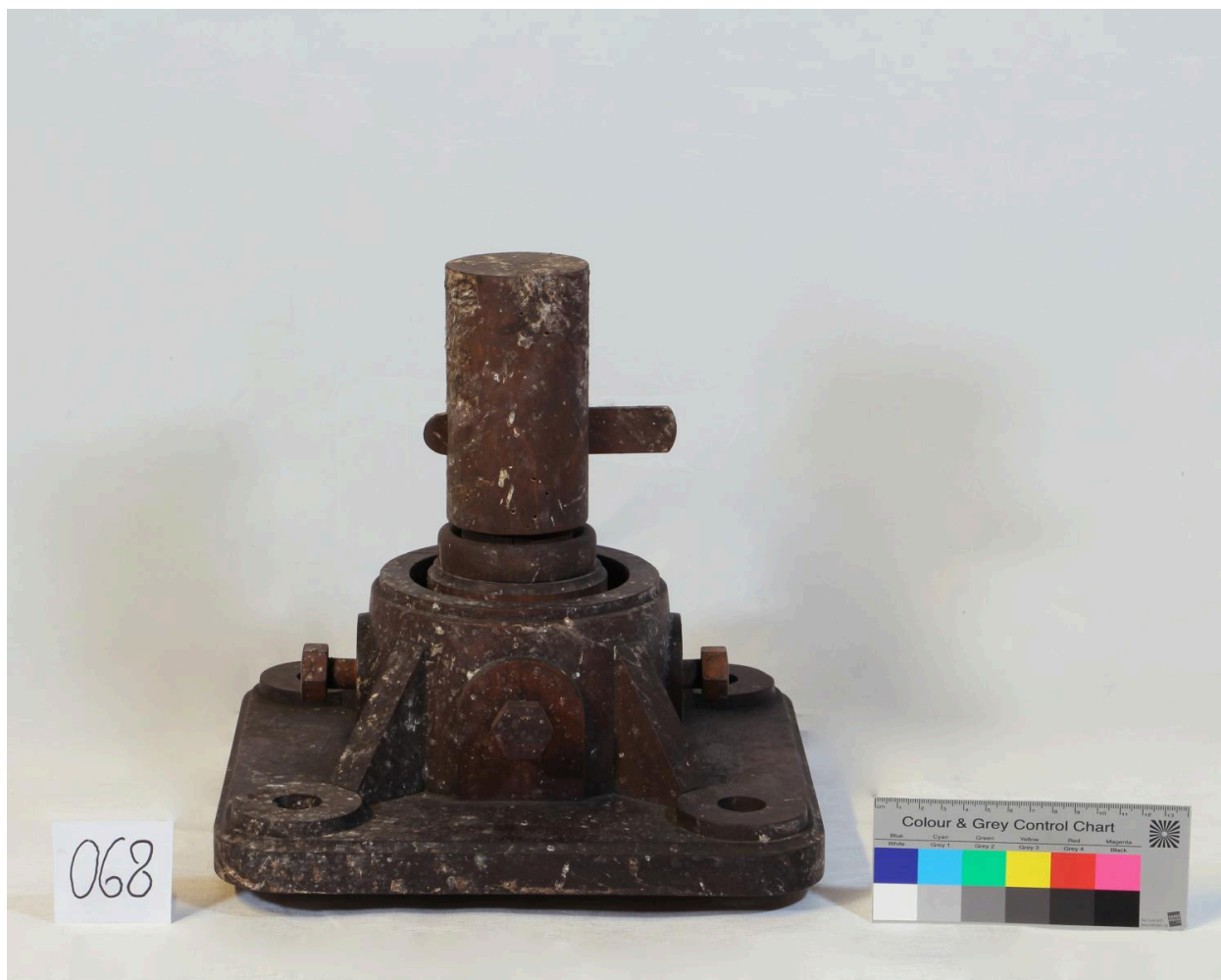
Support de réglage pour palier lisse (objet 068)