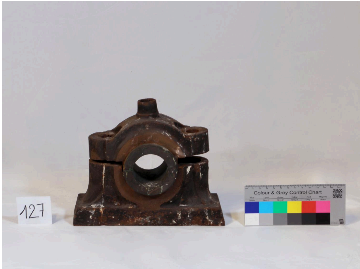
Palier (objet 127)