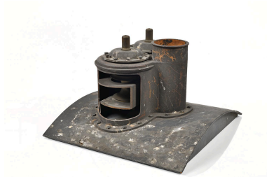
Modèle pour le dessin industriel (objet 045) IVR84_20256901997NUCA