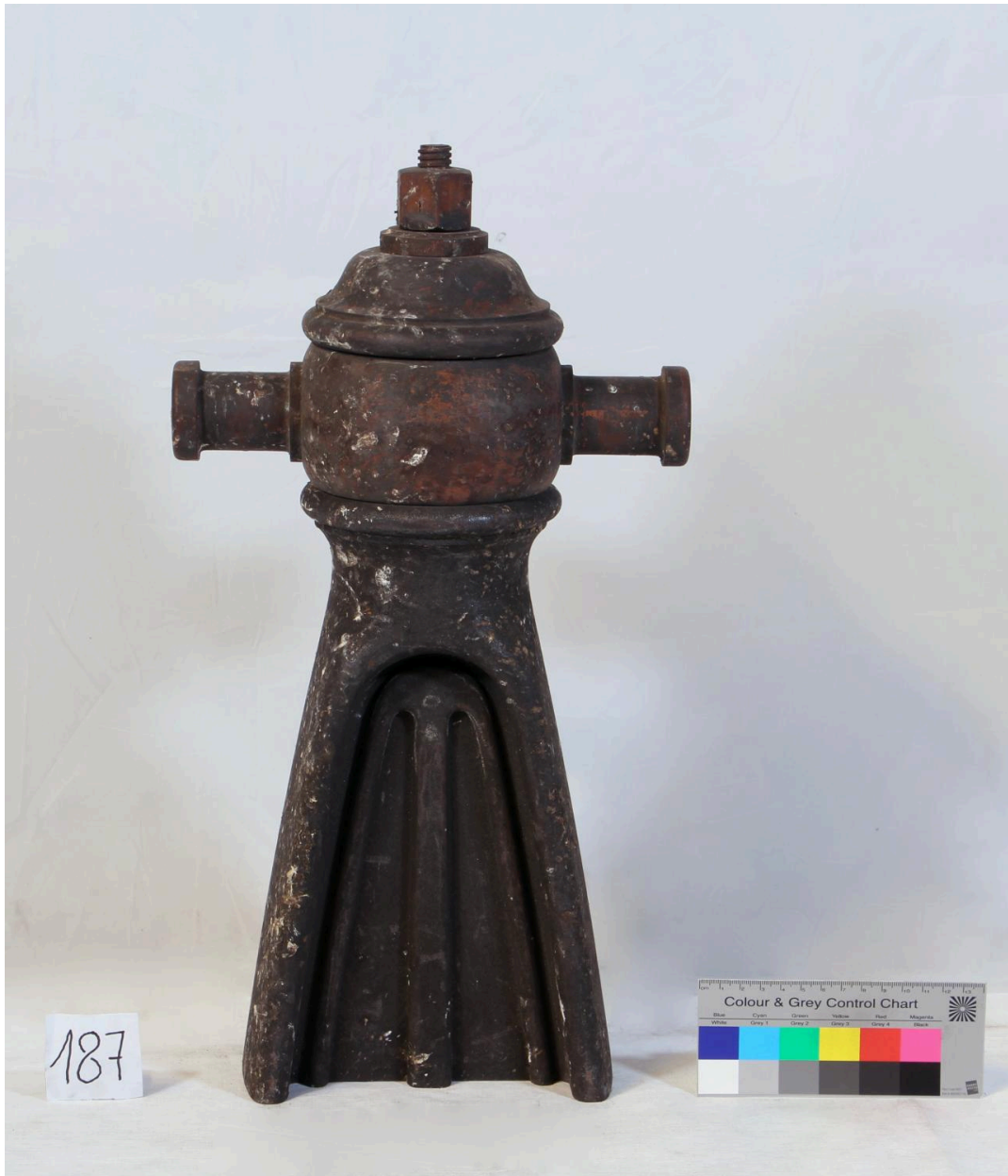
Vanne (objet 187)