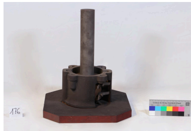
Palier (objet 176) IVR84_20256901268NUCA