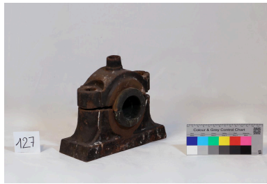
Palier, vue de côté (objet 127), IVR84_20256901200NUCA