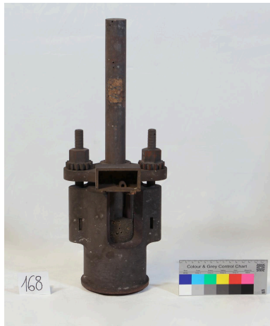
Palier lisse (objet 168), IVR84_20256901256NUCA