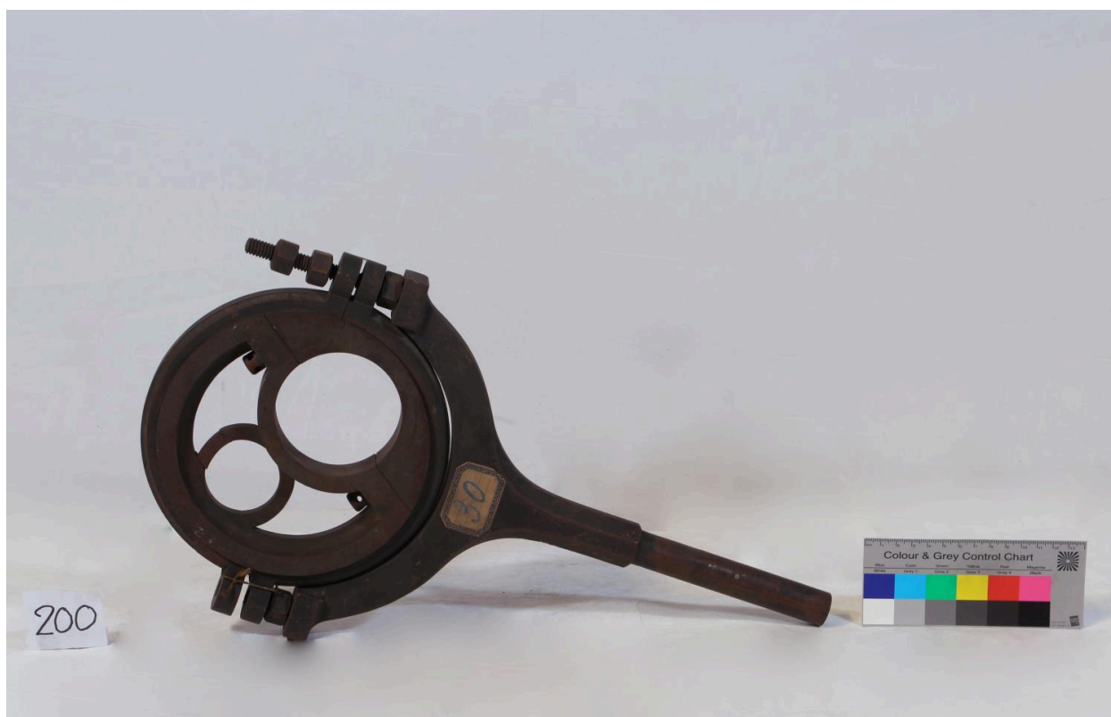
Excentrique (objet 200)