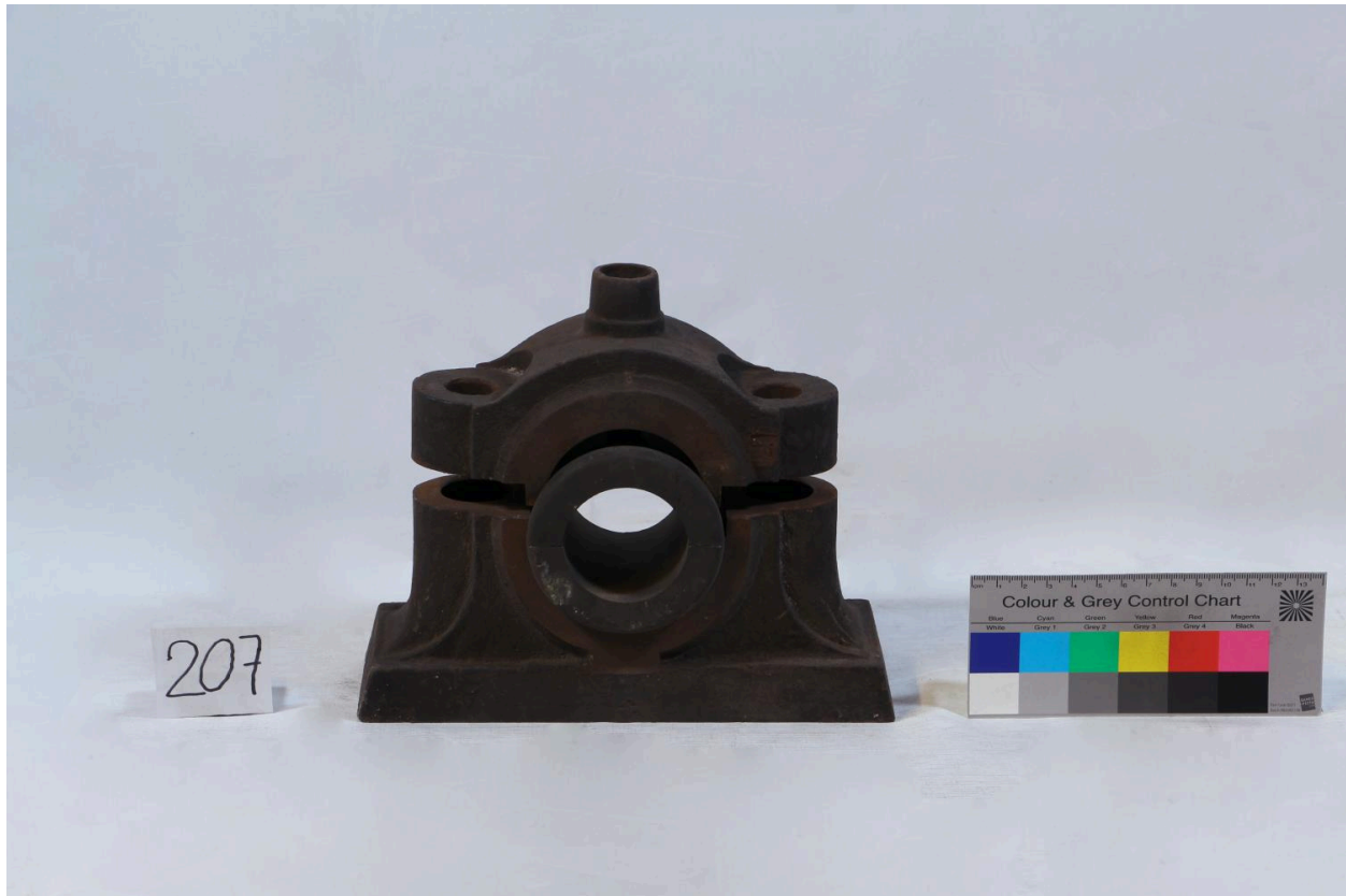
Palier, vue de face (objet 207)