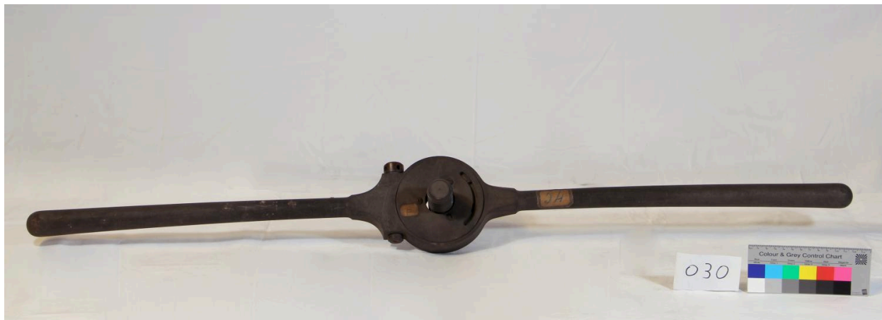
Clé de taraud ou filière (objet 030)