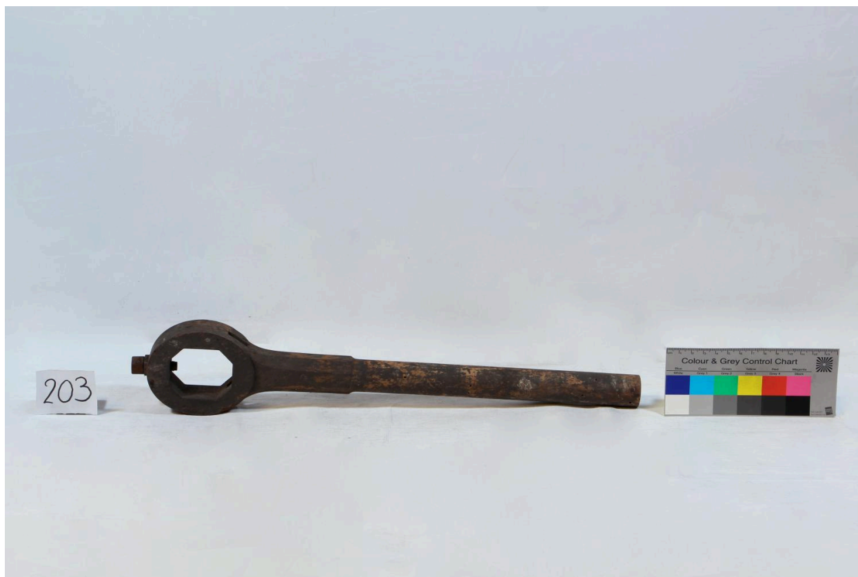
Bras de levier (objet 203)