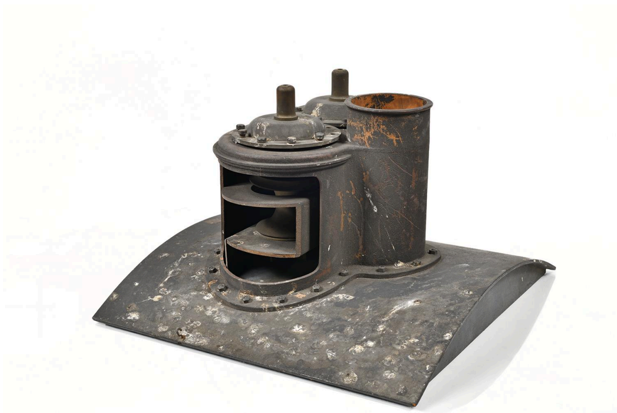
Modèle pour le dessin industriel (objet 045)