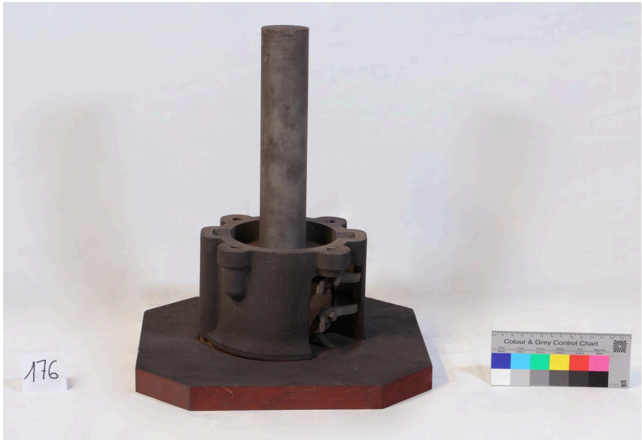
Palier (objet 176)