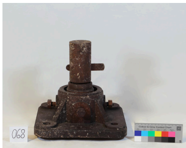
Support de réglage pour palier lisse (objet 068), IVR84_20256901108NUCA