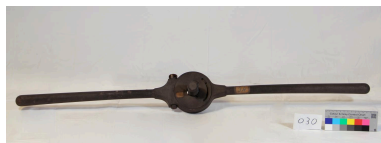
Clé de taraud ou filière (objet 030) IVR84_20256901011NUCA