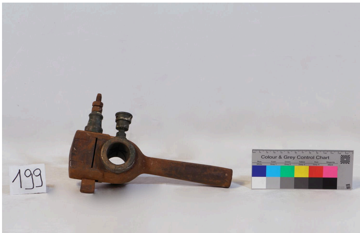
Tête de bielle (objet 199)