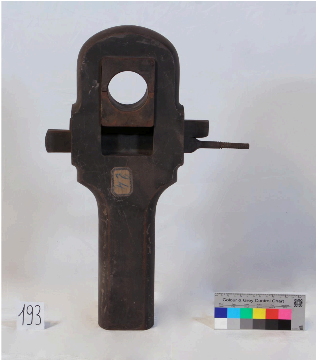
Tête de bielle (objet 193)