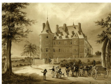
Vue est après travaux