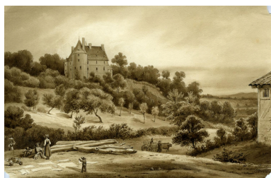
Vue sud avant travaux IVR84_20216300941NUCA