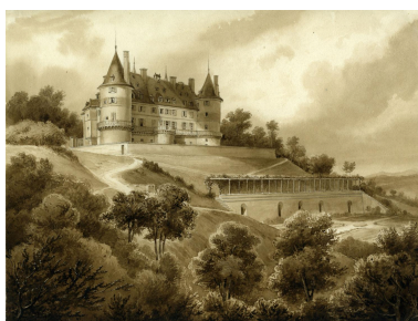
Vue sud après travaux IVR84_20216300945NUCA