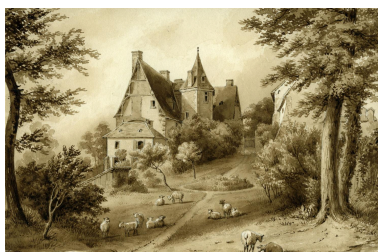
Vue est avant travaux IVR84_20216300942NUCA