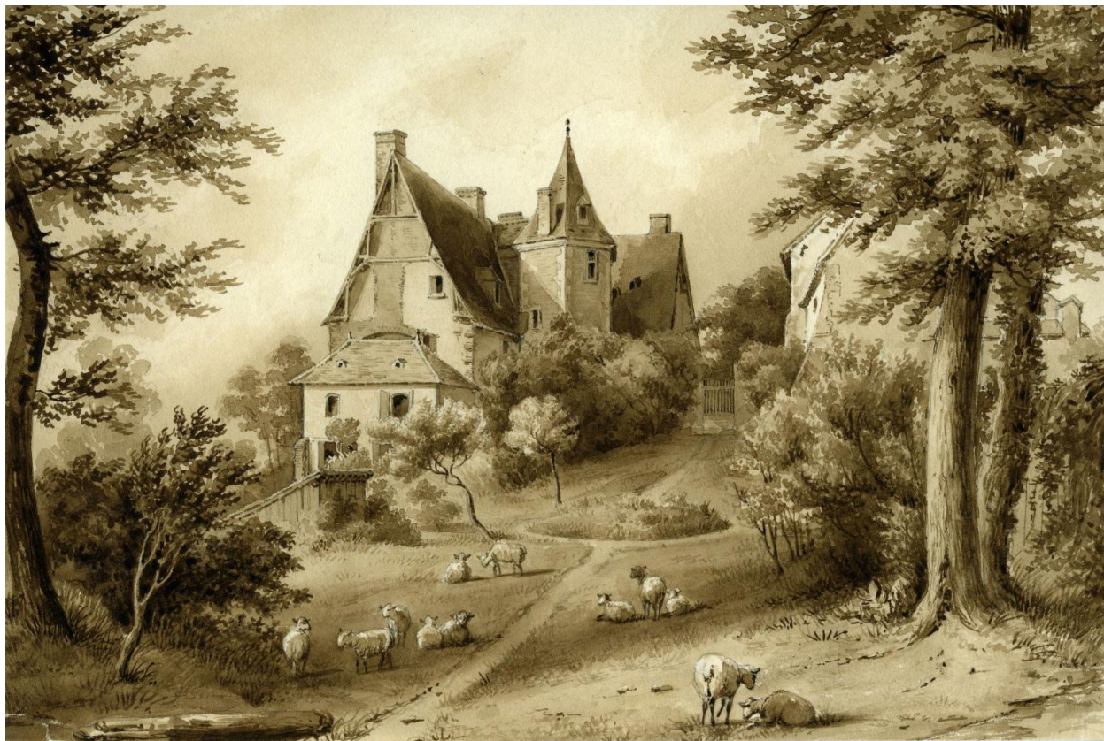
Vue est avant travaux