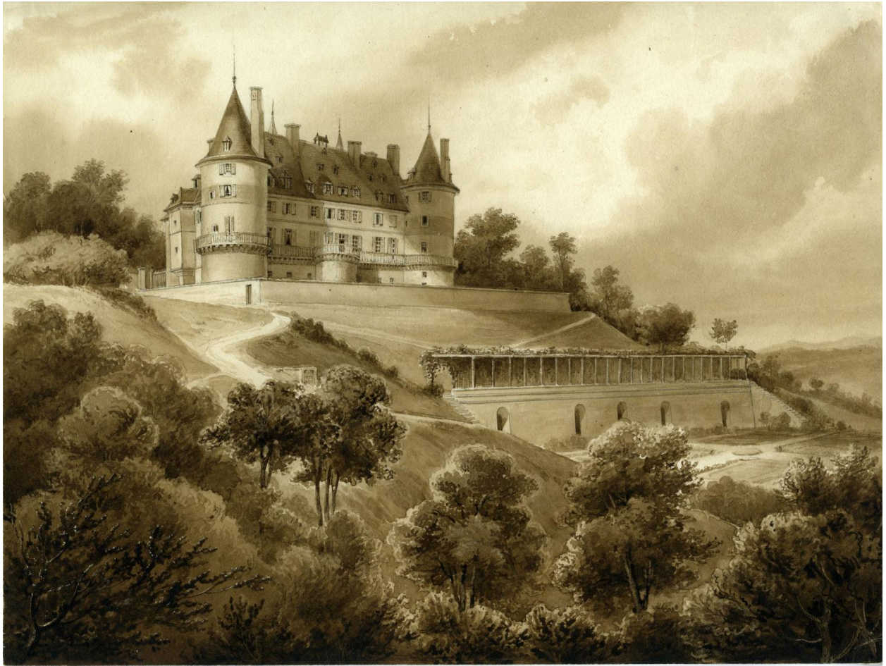
Vue sud après travaux