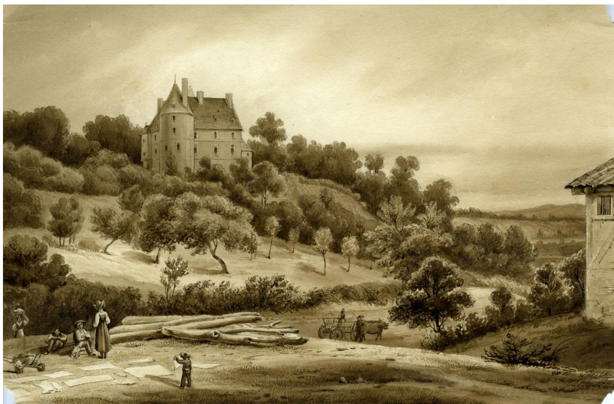
Vue sud avant travaux