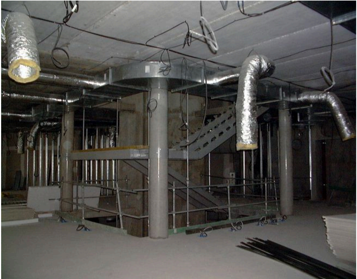
L'escalier en cours de construction, 23 mars 2000