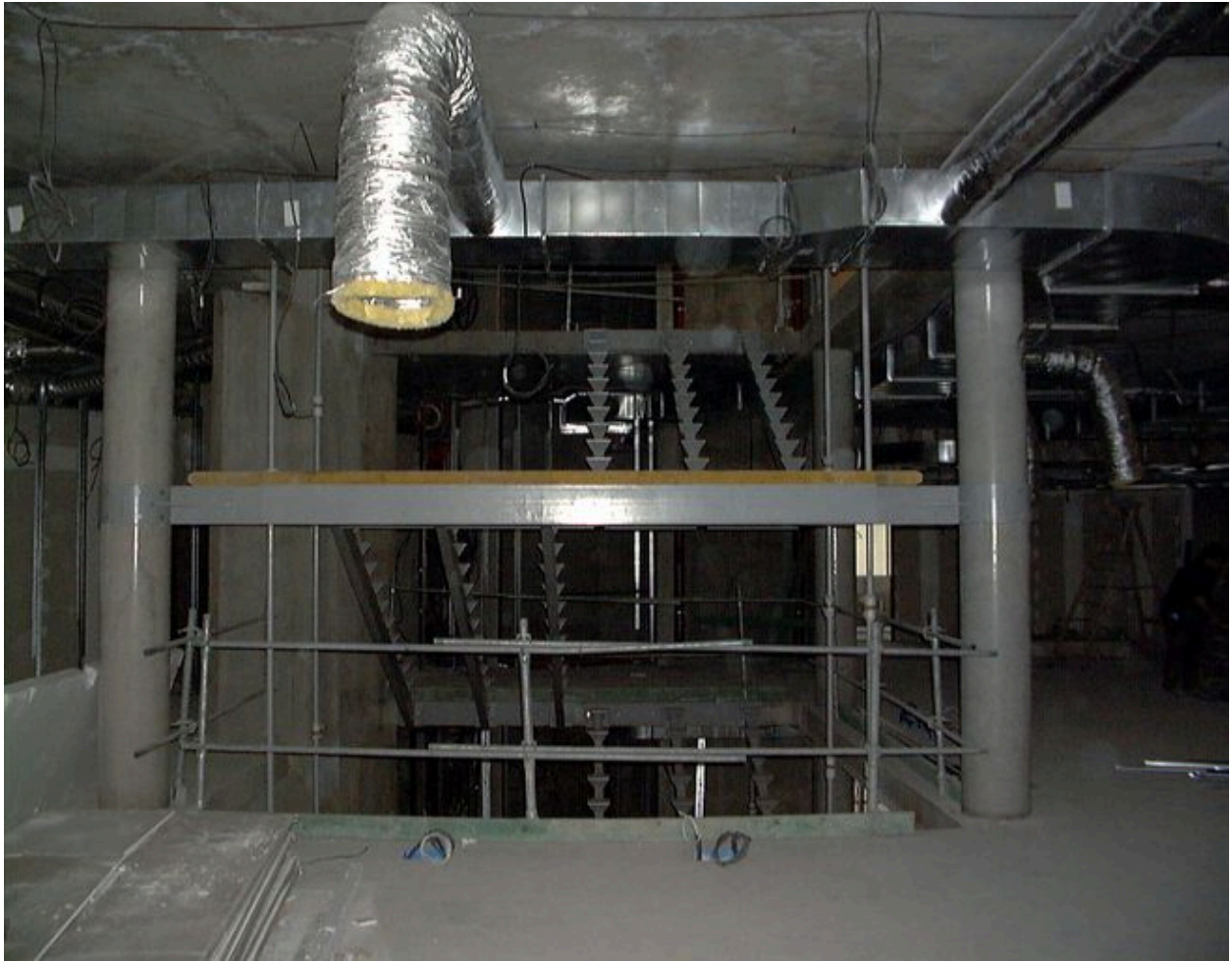
L'escalier en cours de construction, 23 mars 2000