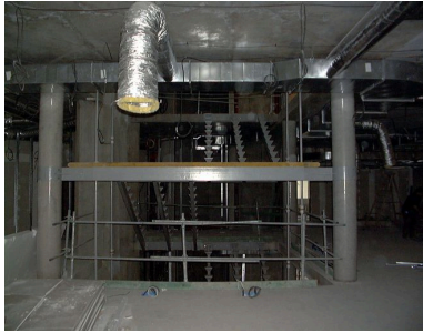
L'escalier en cours de construction, 23 mars 2000 IVR82_20006900448NUCA