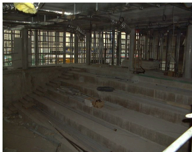
L'auditorium en cours de construction, 23 mars 2000