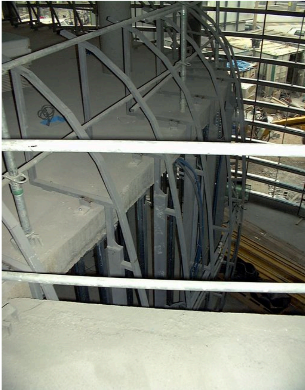
L'enveloppe de l'auditorium en cours de construction, 23 mars 2000