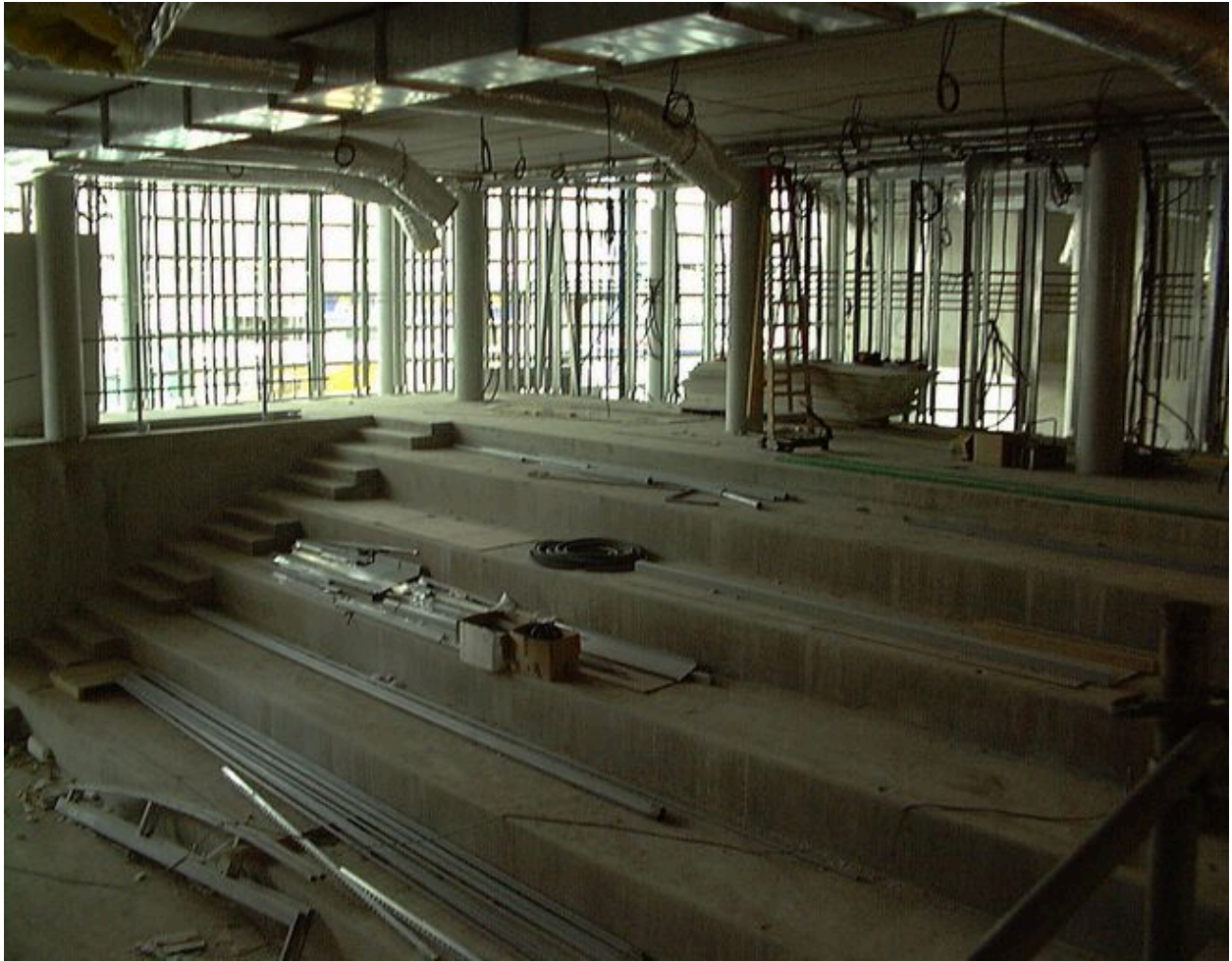
L'auditorium en cours de construction, 23 mars 2000