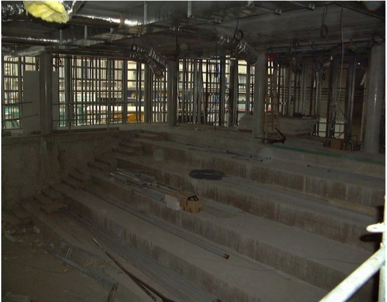
L'auditorium en cours de construction, 23 mars 2000