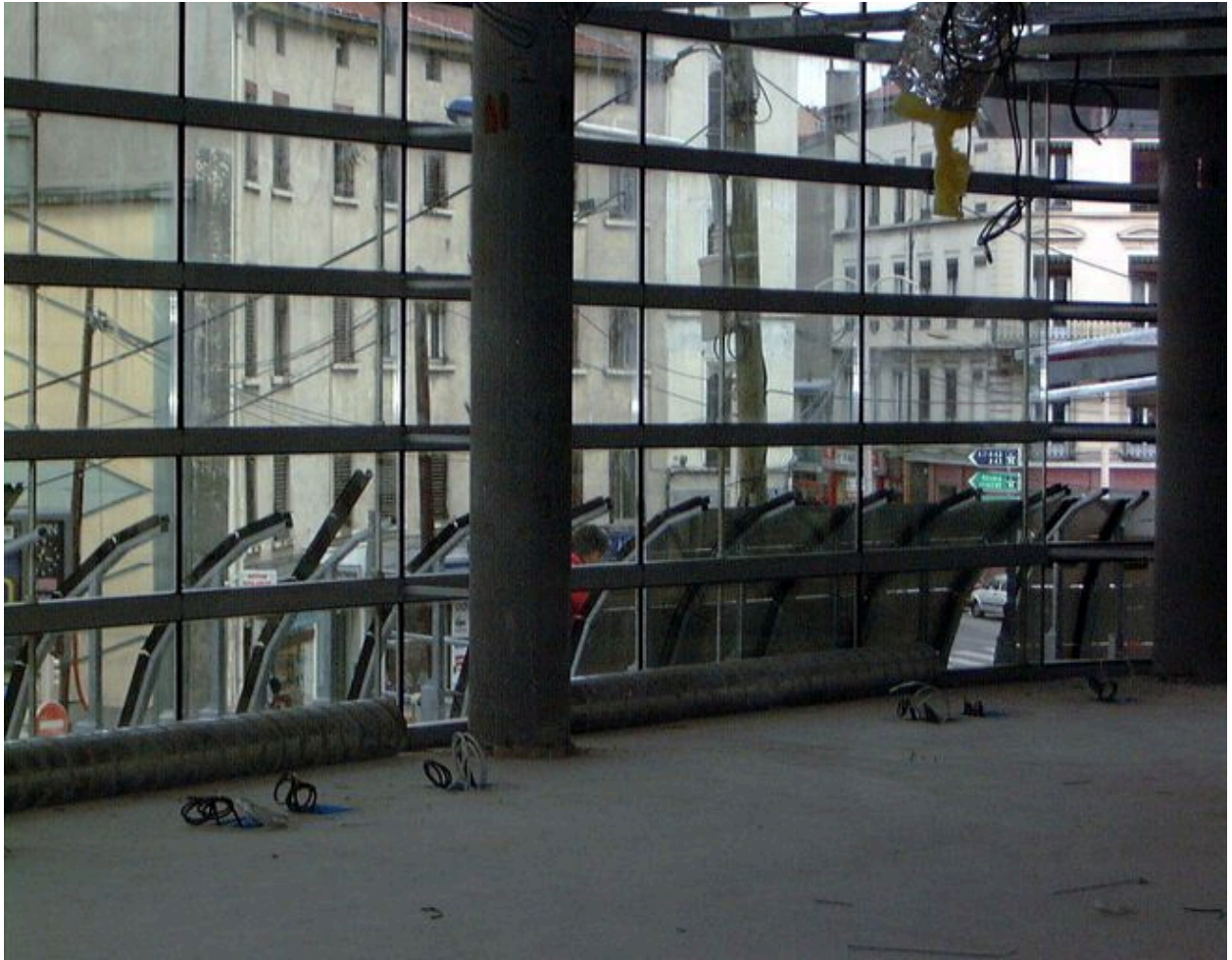
Vue partielle d'une salle de consultation, 23 mars 2000 ; espace largement ouvert par des baies vitrées sur la place Valmy et la rue de Bourgogne