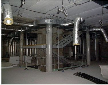
L'escalier en cours de construction, 23 mars 2000 IVR82_20006900449NUCA