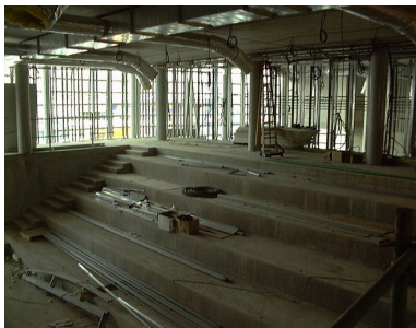
L'auditorium en cours de construction, 23 mars 2000